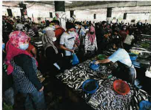
A fishmonger tending to customers at a market in Bayan Baru, Penang, yesterday.

Ismail Sabri said the anticipated increase in the cost of living