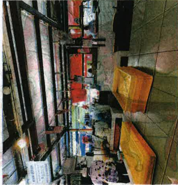
PENIAGA di Pasar Modern Seksyen 16, Shah Alam menumpah kedai pada pukul 9 pagi selepas ayam segar habis dijual dalam tempoh sejam.

"Tindakan pengeluar-pengeluar ini sangat menjejaskan kami yang berniaga, bukan sahaja kami, secara tidak langsung pelanggan kami juga menerima tempiaannya," ujarnya.