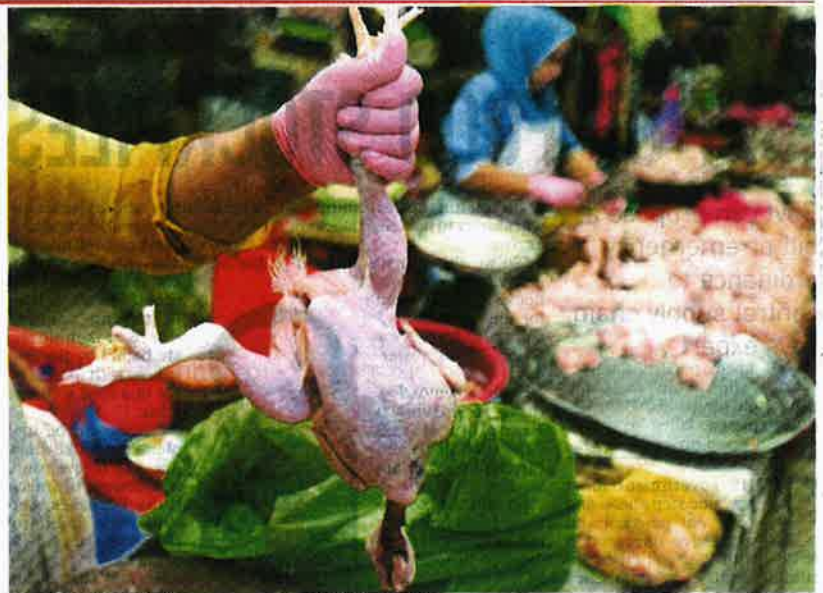
A trader selling chicken at Pasar Besar Siti Khadijah in Kota Baru yesterday. Due to the soaring prices of chicken, the number of buyers has dwindled.

"With supplies scarce, prices have soared. I hope this issue will