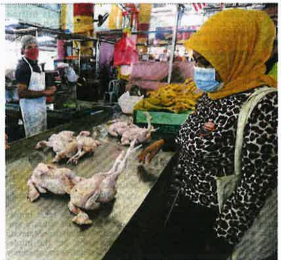
A woman buying chicken at the Selangor wholesale market in Putrajaya yesterday.