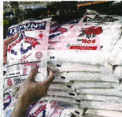
KEBANYAKAN kedai runcit, serbaneka akui kekurangan bekalan tepung sejak tiga hari lalu.

Seorang lagi pekerja kedai serbaneka yang turut tidak mahu dikenali, memaklum-