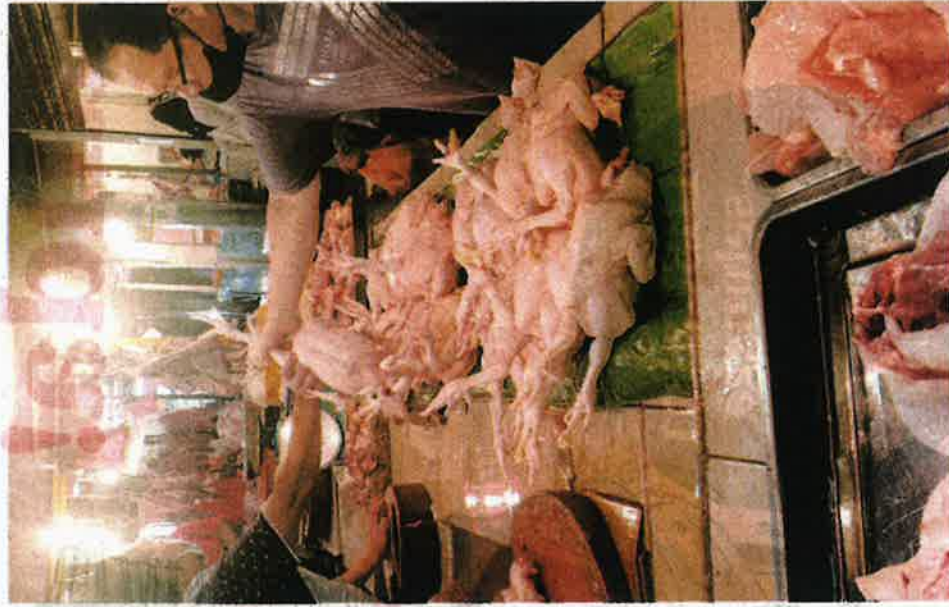
KEADAAN pasar basah Datuk Keramat, Kuala Lumpur dipenuhi orang ramai membeli ayam serantau.

"Ramai pelanggan setia saya merupakan orang yang berniaga, mereka sedikit kesewa kerana tidak dapat membeli ayam mengikut keperluan kedai mereka," katanya.