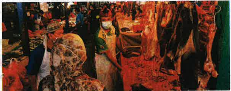
MESYUARAT Kabinet hari ini fokus menangani isu kos sara hidup yang semakin meningkat dan membebankan rakyat terutama golongan berpendapatan rendah.

"Bagaimanapun, pemansuhan AP itu mengambil masa untuk ia memberi kesan positif kepada pengguna kerana ia bergantung kepada berapa cepat proses perolehan dilakukan, pensijilan halal, pemeriksaan kastam dan sebagainya," katanya.