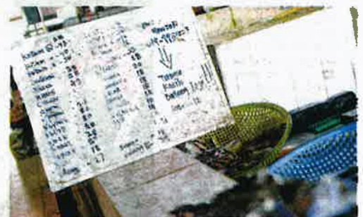
HARGA ikan yang lebih tinggi menjadikan makanan laut itu bukan alternatif terbaik bagi menggantikan penggunaan ayam.

Beliau berkata, pengguna juag boleh bertukar kepada ikan yang turut mempunyai sumber protein tinggi.