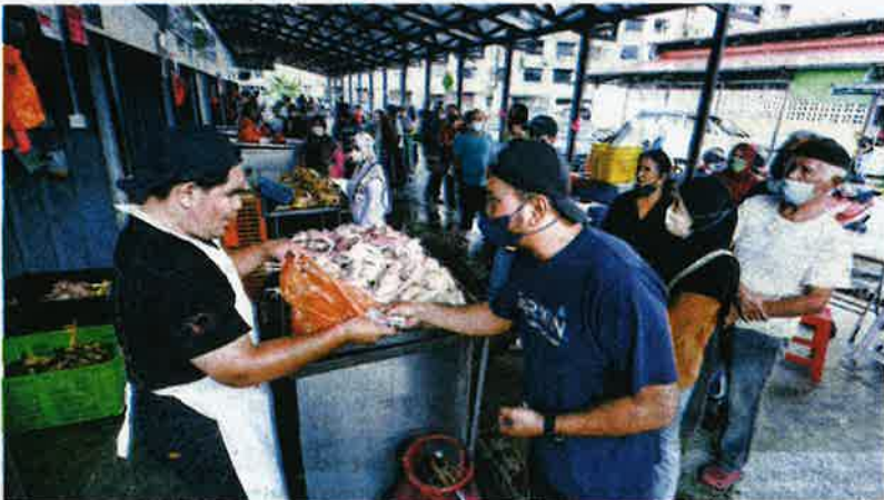
ORANG ramai di Ampangan. Seremban beratur untuk membeli ayam ekoran bekalan ayam yang terhad selepas kartel ayam menutup ladang selama dua hari. Situasi sama dilaporkan berlaku di seluruh negara.