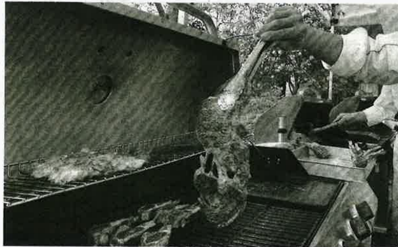
KERAJAAN menetapkan polisi halal yang ketat terhadap setiap produk daging sama ada lembu, kerbau, kambing, ayam atau haiwan halal import lain yang masuk ke pasaran. - GAMBAR HIASAN/AFP

Pelaksanaan dasar ini pastinya melibatkan Jabatan Kemajuan Islam Malaysia (Jakim) selaku pihak berkuasa dalam pensijilan halal di Malaysia. Namun, Jakim tidak pernah dan tidak mengeluarkan pensijilan halal secara terus kepada loji sembelihan luar negara sebaliknya berperanan menyelia dan memberi perakuan dari sudut keperluan halal dan kepatuhan syariah. Pun demikian, Jakim tidak akan berkompromi untuk merendahkan prosedur halal