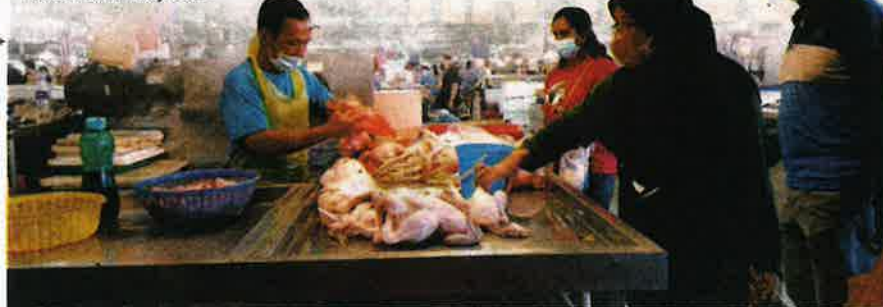
KEBANYAKAN peniaga hanya mendapat kurang separuh tempahan ayam dari pembekal ketika tinjauan di Pasar Awam Larkin semalam.

Bayan Lepas: Peniaga ayam dan pengguna di negeri ini menyuarakan keresahan berkaitan masalah bekalan ayam belum menunjukkan tanda akan pulih dalam tempoh terdekat.