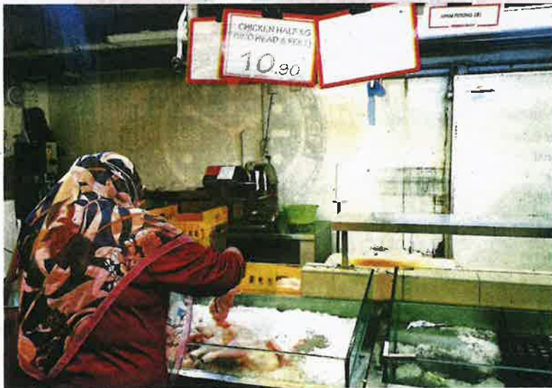
Cause for concern: The price of fresh chicken has increased between RM9.80 and RM10.50 per kg despite a ceiling price of RM8.90.

PETALING JAYA: Malaysians are feeling the pinch of the rising cost of living as they now have to fork out extra to buy essential goods.