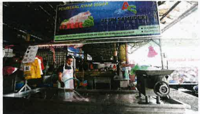
TINJAUAN di Pasar Borong Selangor mendapati ramai peniaga yang tidak boleh menjual ayam ekoran dada bekalan daripada pengilang.

"Kerajaan perlu segera atasi masalah ini dan jangan biarkan pihak tertentu mengawal pasaran sehingga memberi impak kepada rantaian bekalan makanan," katanya ketika ditemui di pasar terbabit, semalam.