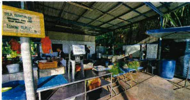
AYAM segar di sekitar Sungai Buloh dan Jeram, Kuala Selangor habis dijual seawal pukul 7.30 pagi selepas peniaga mendakwa mengalami kekurangan bekalan ayam daripada pembekal sejak kelmarin.

Katanya, dia terpaksa menggunakan alternatif tersebut untuk mendapatkan bekalan ayam dalam masa sama pada har-