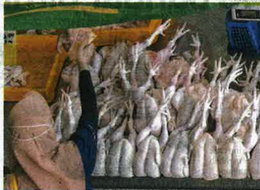
Mesyuarat kabinet dipercepatkan ke Isnin bagi membincangkan dua isu membabitkan kenaikan harga barang dan kekurangan bekalan makanan seperti ayam.

harga semua barangan keperluan dijangka meningkat sehingga 60 peratus pada Jun depan.