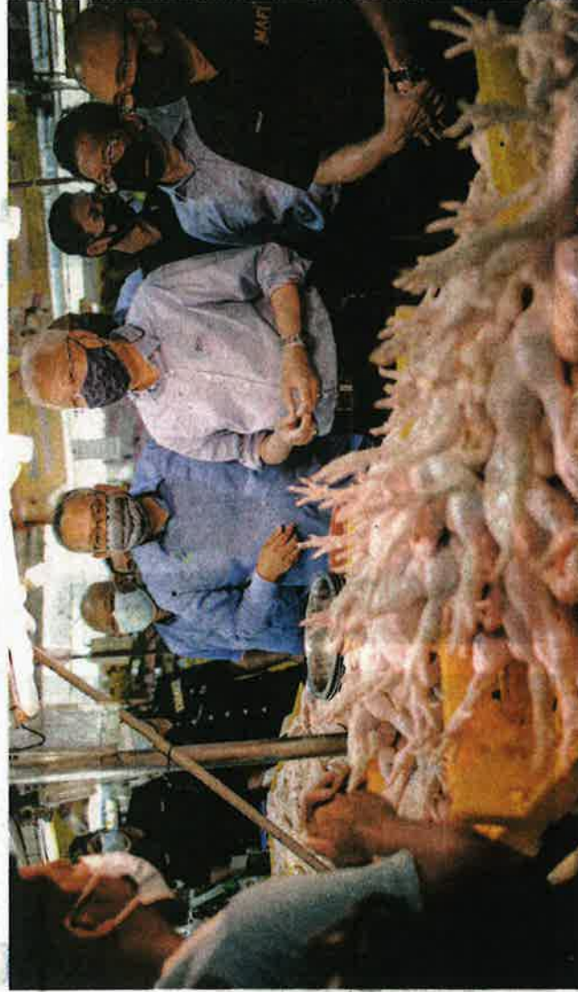
ISMAIL SABRI ketika meninjau jualan ayam segar di sebuah pasar di Putrajaya baru-baru ini.

"Jadi esok (hari ini), saya akan panggil mesyuarat Kabinet khusus bagaimana hendak kita mengatasi kenaikan kos sara hidup dan bekalan ayam," katanya.