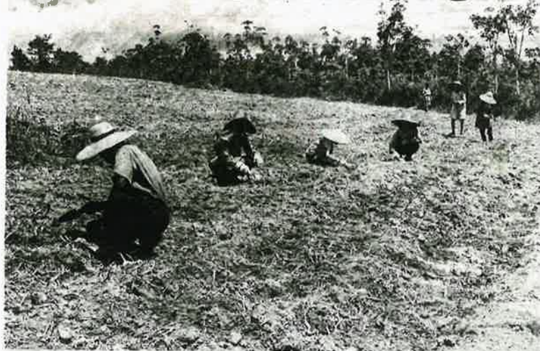
RANCANGAN Buku Hijau yang dilancarkan pada 1974 sebenarnya isyarat penting untuk mengekang kebergantungan terlampau terhadap makanan import. - UTUSAN

“ Ada duit belum tentu orang mahu menjual barang kepada kita.”