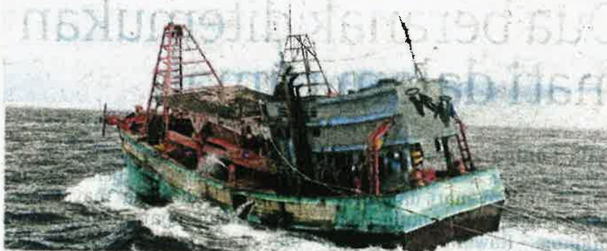
Bot nelayan Vietnam yang ditahan kerana mencero boh dan mencuri hasil laut negara.