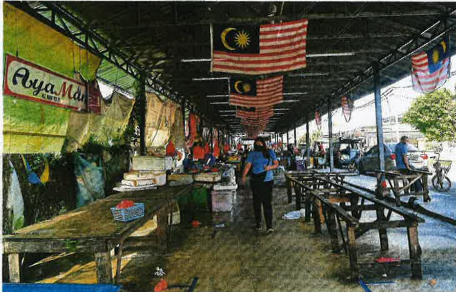
Market stalls selling chicken are closed in Pandamaran, Port Klang, yesterday due to the drop in chicken supply. Besides chicken, some seafood stalls are also closed because of poor catch brought on by bad weather.

CREATING a database of chicken supply and optimising cold storage facilities owned by the Agriculture and Industry Ministry (Mafi) and other agencies;