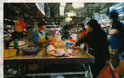
KEBANYAKAN peniaga hanya mendapat kurang separuh tempahan ayam dari pembekal di Pasar Awam Larkin.

"Manakala pasar basah atau awam pula, Pasar Awam Kuala Klawang dikesan tidak mempunyai bekalan ayam," katanya semalam.