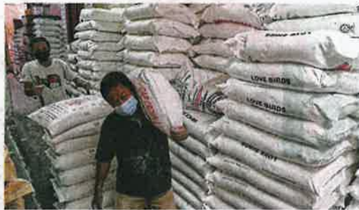
Hard at work: Workers arranging sacks of flour at a warehouse in George Town, Penang. The Cabinet met yesterday to discuss the wheat and chicken shortage.

Beginning June 1, the export of chickens - now numbering 3.6 mil-