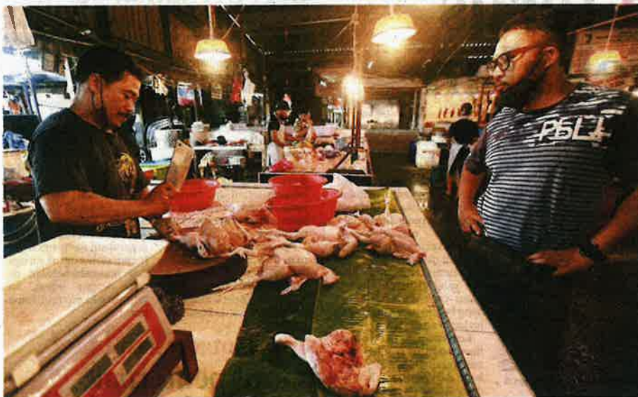
SEORANG peniaga menyiapkan ayam yang dipesan oleh restoran di Pasar Datuk Keramat, Kuala Lumpur.

"Bekalan ayam di Selangor sebelum ini memang tidak mencukupi, memang kami import. Hanya 35 hingga 40 peratus ayam tempatan yang selebihnya memang import," katanya.