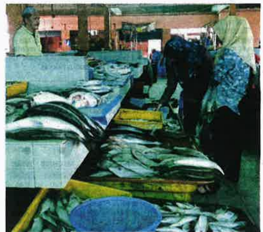
Harga ikan di pasar Sik meningkat berikutan kekurangan bekalan akibat cuaca tidak menentu sejak dua bulan lalu.

pernah turun daripada RM10, walaupun ikan kembung bersaiz kecil.