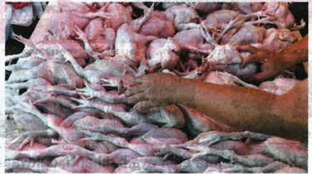
Kerajaan menghentikan eksport 3.6 juta ekor ayam sebulan bermula 1 Jun ini bagi menjamin bekalan untuk rakyat negara ini.

Ujarnya, harga siling ayam standard pada ketika ini adalah RM8.90