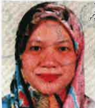
Pensyarah Kanan, Fakulti Ekonomi & Muamalat, Universiti Sains Islam Malaysia (USIM)

• Sumber pendapatan petani, penternak sara diri mungkin terjejas