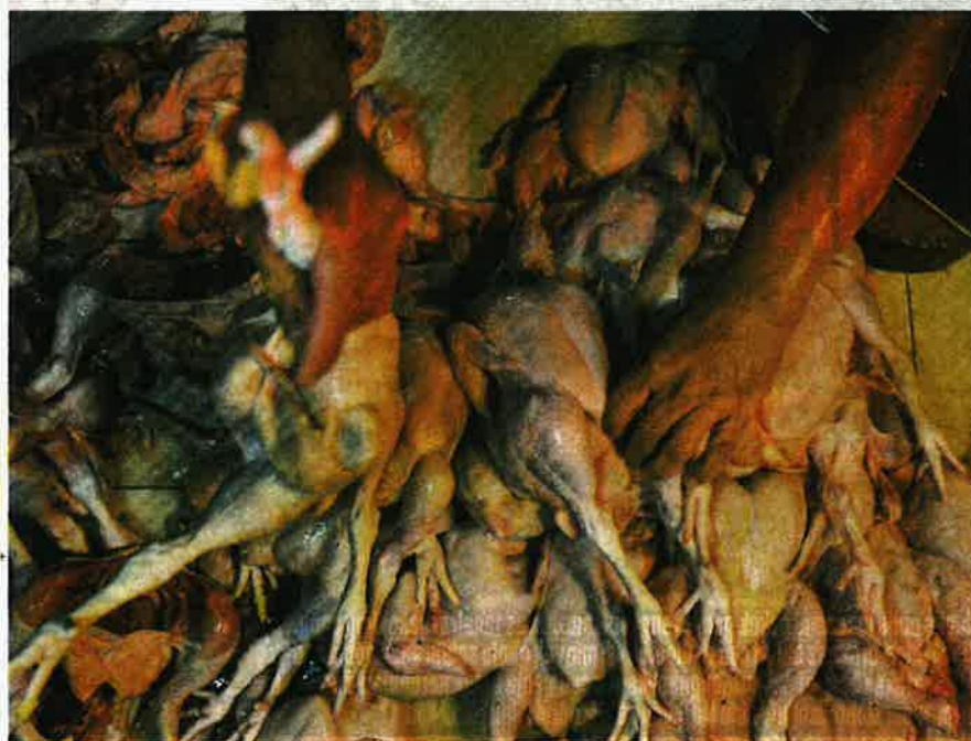
BEKALAN ayam mentah sukar diperoleh menyebabkan rata-rata peniaga menjual ayam pada harga sekitar RM11 hingga RM13 sekilogram ketika ini di Pasar Chabang Tiga, Kuala Terengganu.

"Katakan contoh sebelum ini untung untuk seekor ayam ialah RM2, apa salahnya dalam situasi sukar ini mereka ambil untung RM1 namun konsisten untuk ternak ayam secara berpanjangan dan jangan ada percaturan harga," katanya.