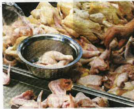
PELANGGAN memilih potongan ayam yang dijual di sebuah gerai ayam segar di Pasar Besar Seremban.

Ia berikutan masalah kenaikan berat badan ayam yang terganggu akibat kualiti dedak makanan ayam, jangkitan penyakit, keadaan cuaca panas yang mengganggu pembesaran ayam terutama di ladang reban sistem terbuka.