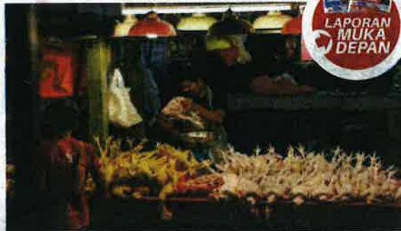
Tinjauan pendapat Sinar Harian mendapati orang ramai bersedia menggunakan kuasa pengguna dalam isu kekurangan bekalan ayam.

Selebihnya iaitu lima peratus pula menyatakan mereka tidak pasti sama ada mahu memboikot atau tidak pembelian ayam di negara ini. Undian bagi mendapatkan