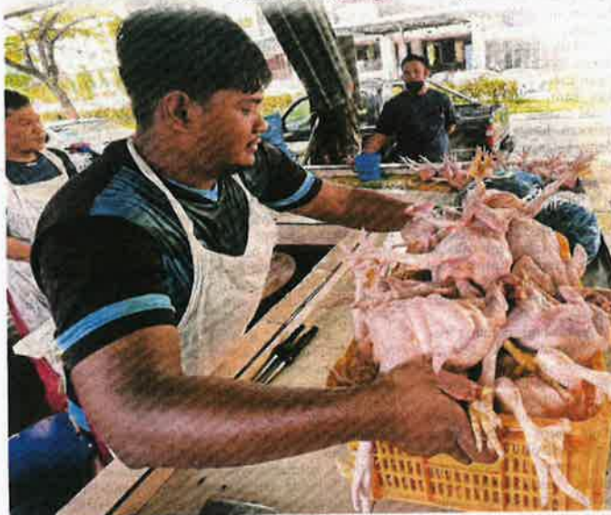
PENIAGA menyediakan tempahan dari pelanggan ketika tinjauan bekalan ayam di kedai runcit sekitar Kuala Lumpur berikutan penutupan kilang ayam dengan kebanyakan peniaga diberikan ayam dalam kuantiti kurang daripada biasa untuk jualan harian.

Menurutnya lagi, Kementerian Pemodenan Pertanian dan Pembangunan Wilayah Sarawak kini merancang untuk menswastakan Stesen Ternakan Meragang di Lawas bagi pengeluaran baka kerbau berkualiti.