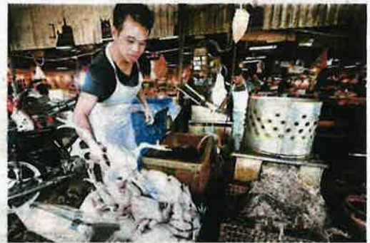
A chicken stall operator processing his stock in Pasar Datuk Keramat, Kuala Lumpur, yesterday.

"Although this is not the first time we have experienced rationing of processed chicken, this