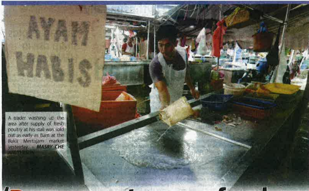
A trader washing up the area after supply of fresh poultry at his stall was sold out as early as 8am at the Bukit Mertajam market yesterday. — MASRY CHE