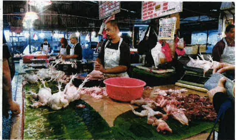
KERAJAAN menghentikan eksport ayam kerana mengutamakan bekalan untuk rakyat. - GAMBAR HIASAN