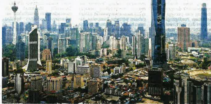
MALAYSIA perlu menghapuskan kerenah birokrasi dan ketirisan jika mahu memastikan pelan ekonomi negara berjaya dilaksanakan mengikut perancangan.

"Kita sudah mempunyai banyak dasar, tetapi paling penting adalah koordinasi terhadap pelaksanaannya supaya hasrat pelan ekonomi itu menepati