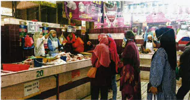
KEKURANGAN ayam menyebabkan pembeli perlu beratur sehingga 30 minit untuk mendapatkan bekalan itu di Pasar Besar Kuantan, Kuantan, Pahang.