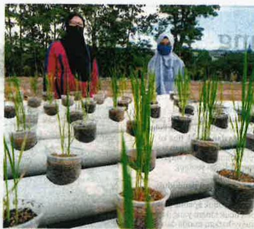
PADI ini ditanam menggunakan teknik hidroganik khas untuk tanaman anak padi.

Selain terbiar, kawasan yang terabai sejak 20 tahun itu turut menjadi tempat dan laluan jenayah serta aktiviti tidak bermoral sehingga menjadikan persekitaran komuniti dan penempatan tidak selamat termasuk mencacatkan pemandangan. Namun bermula Jun