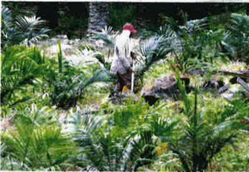
KEKURANGAN buruh di ladang kelapa sawit mengakibatkan industri itu kerugian RM21 bilion tahun lalu. - GAMBAR HIASAN