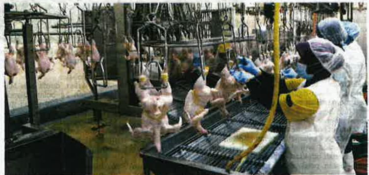
KILANG memproses ayam milik Pertubuhan Peladang Kebangsaan (Nafas) mempunyai kemudahan yang lengkap tetapi kini hanya membekalkan ayam untuk agensi kerajaan.

Dia melihat kerjasama di antara kerajaan negeri Selangor dan Negeri Sembilan bagi mengusahakan tanaman jagung bijirin di tanah seluas 162 hektar tanah di Gemas, Tampin sebagai satu usaha yang sangat baik.