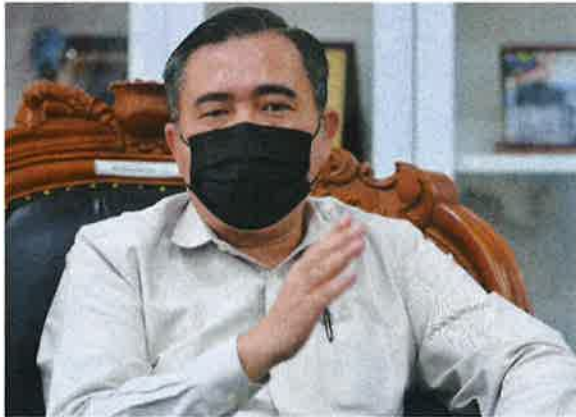
ANTHONY LOKE SIEW FOOK

PETALING JAYA: Kerajaan perlu memastikan penternak dan seluruh rantai bekalan ayam tidak kerugian dengan pelaksanaan bantuan subsidi yang mencukupi dan akhirnya mampu menampung kenaikan kos luar biasa.