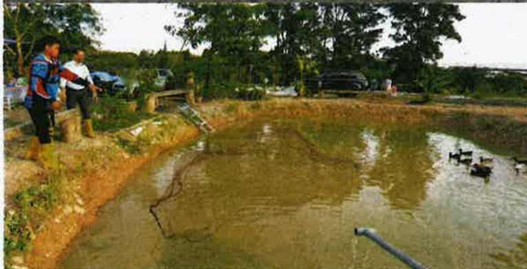
SEBUAH kolam buatan dibina bagi memelihara ikan patin dan keli dari sumber air bawah tanah.