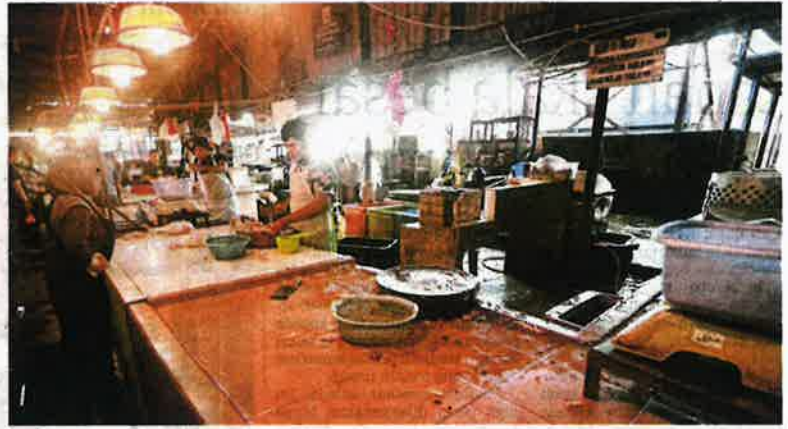
Peniaga memotong ayam yang dipesan pembeli di Pasar Datuk Keramat, Kuala Lumpur, semalam.

yang enggan dikenali berkata, kakitangan terlibat mendapat 'duit tepi' daripada pelanggan berkenaan, selain ada juga kakitangan melakukannya secara percuma atas dasar setia kawan.