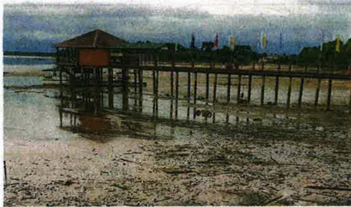
Tasik Bukit Merah yang menjadi lokasi ternakan ikan air tawar semakin surut.