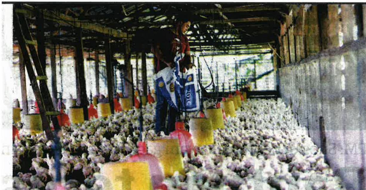
SUBSIDI kepada penternak dihapuskan mulai Julai ini kerana ia gagal membendung kenaikan harga ayam di pasaran. - GAMBAR HIASAN.