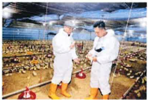
Minister Mafi (left) during an official visit to the Dewing Poultry Development Centre, Sarawak.

KUALA LUMPUR The Ministry of Agriculture and Agro-based Industry (MAFI) has stated the supply of chicken in the market throughout the country has stabilised and there will be no major shortage in the near future, mainly because of the government's intervention in the supply of chicken. The minister also stressed support for the bird being to meet domestic needs. He said after meeting with the industry, MAFI will continue to support the industry to ensure the supply of chicken is stable. He also reported that chicken supply is stable and there is no major shortage in the near future, mainly because of the government's intervention in the supply of chicken. The supply of chicken was reported to be stable and there is no major shortage in the near future, mainly because of the government's intervention in the supply of chicken.