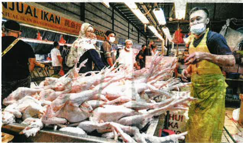
KEPUTUSAN untuk menyekat eksport ayam mampu menstabilkan semula harga ayam di pasaran tempatan.

Selebihnya ialah Thailand yang sekadar mengimport 1,024,902 ekor unggas itu, Pakistan pula hanya 650 ekor dan paling sedikit ialah Kuwait yang hanya mengimport 150 ekor ayam.