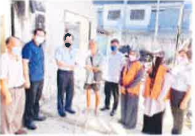
BERNAMA: Menteri Besar Limbang menyerahkan sambutan kepada Bomba dan Penyelamatan (JBPM) dan Bomba Limbang semasa majlis percutian.

BERNAMA: Bomba dan Penyelamatan Limbang (JBPM) membantu mangsa kebakaran bina semula rumah.