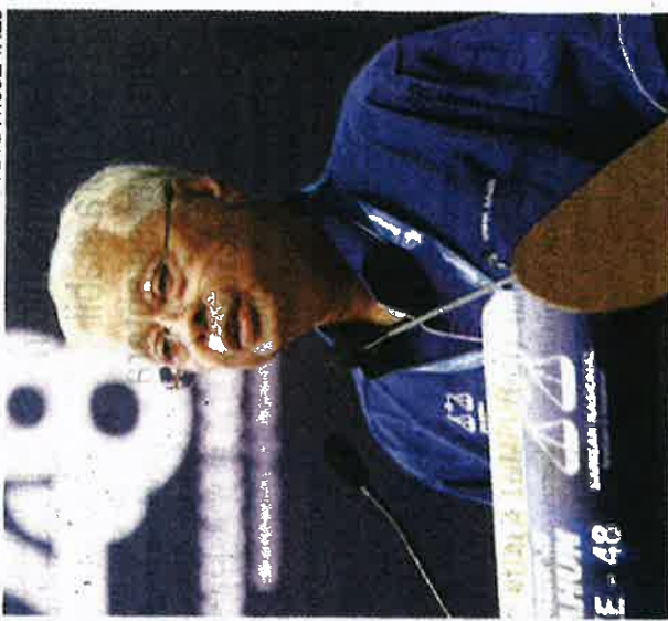
Ismail Sabri berucap pada konvensyen Barisan Nasional pada Rabu.