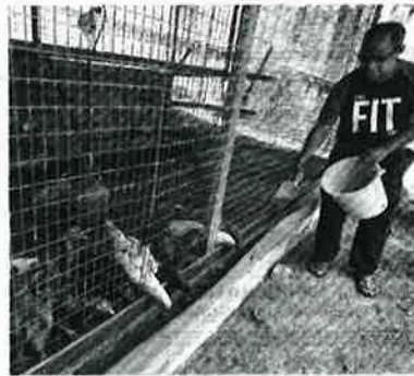
AYAM boleh diberi makan dedak sawit sebagai alternatif kepada soya dan jagung.