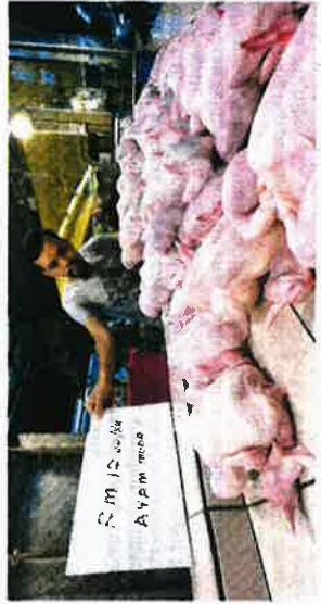
Harga ayam segar melonjak kepada RM12 sekilogram berikutan peningkatan kos pengangkutan.

dan pengeluaran ayam kembali stabil sebagai memberi keutamaan kepada rakyat negara ini. Pengguna, Ah Peng, 40, berkata ayam segar semakin sukar dibeli berikutan bekalannya yang sering kehabisan awal.