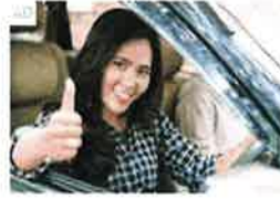
Save up to 18% on your car