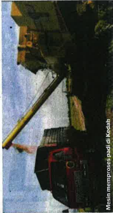
Mesin memproses padi di Kedah

Saranan Menteri Besar agar siasatan dilakukan kewujudan kartel padi ini dan wajar diperangi habis-habisan.