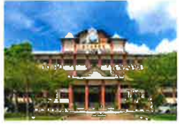
开办多领域大学基础课程! 南方大学学院