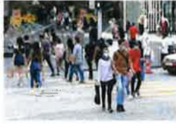
只有大马人才懂! 每天经历10个日常肯