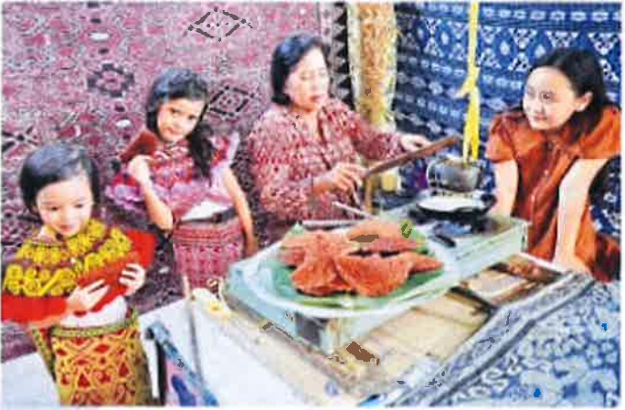
GAWAI TREAT The management and staff of The Borneo Post wish all our readers and advertisers Happy Gawai Dayak. We are taking a break today. Your favourite newspaper will be available as usual on Friday.

KUCHING The Gawai festival could become a platform for the exchange of thoughts and opinions to resolve longstanding issues and strengthen the unity and commitment of the Dayak community as well as encouraging them to be more participative in the development of Sarawak. In highlighting this to the State Dayak and Sarawak Premier, Tanjong Pagar Yee, he urged the Dayak and Sarawak Dayak to be institutionalised as an effort to build the trust by all the Dayak of Sarawak and become a point of unification of all members of the community. The Dayak have huge assets in the form of land ownership, which should give them the ability to generate income by developing it (land) through agriculture, agro-forestry or other forms of entrepreneurship. Dayak Sarawak Development Authority