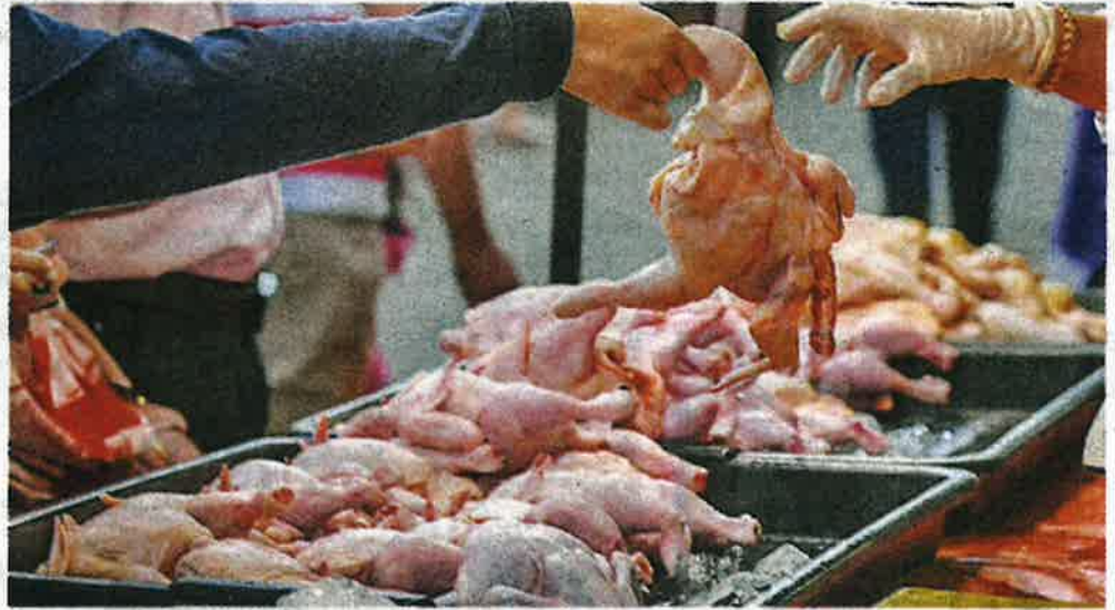
Orang ramai tetap memilih ayam walaupun harganya meningkat.

Katanya, sepanjang kerajaan menetapkan harga sil-