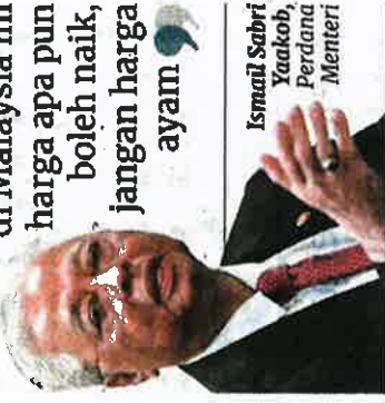
Ismail Sabri Yaakob, Perdana Menteri

Apabila kita perkenalkan subsidi untuk (penternak ayam) memastikan harga ayam tidak dinaikkan, di Malaysia ini harga apa pun boleh naik, jangan harga ayam