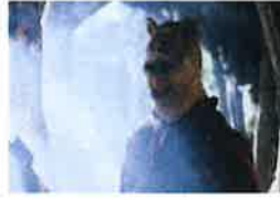
童年毁了! 小熊维尼变反派 血腥画面曝光