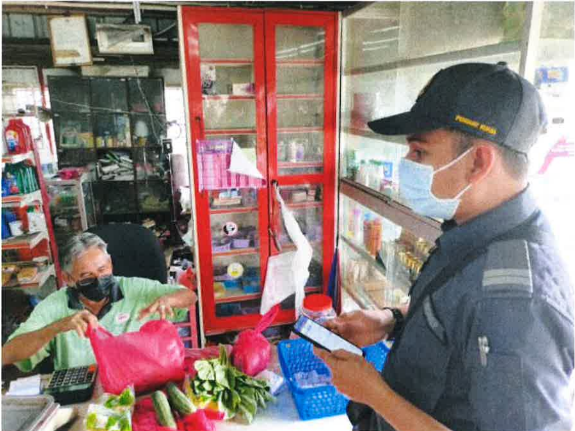
执法人员检查零售商，并针对违法业者开出罚单。