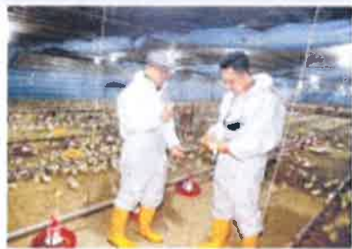
BERNAMA: Bomba dan Penyelamatan Limbang menyerahkan sambutan kepada Bomba dan Penyelamatan (JBPM) dan Bomba Limbang semasa majlis percutian.

BERNAMA: Pengerusi Biro Makanan Pertanian dan Industri Halaham, MAFI, menyatakan bekalan ayam di negara ini adalah stabil dan tiada kekurangan ketara.