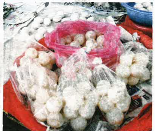
PENIAGA boleh didenda sehingga RM250,000 jika didapati menjual telur penyu di Terengganu.

Terengganu merupakan negeri terakhir di negara ini yang mengharumkan penjualan telur penyu iaitu haiwan reptilia yang hampir pupus.