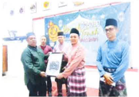
BERNAMA: Menteri Besar Limbang menyerahkan sambutan kepada Bomba dan Penyelamatan (JBPM) dan Bomba Limbang semasa majlis percutian.

“Membina projek ini bertujuan untuk meningkatkan keselamatan kebakaran di kawasan tersebut. Projek ini dilaksanakan dalam dua fasa. Fasa pertama melibatkan membaiki 10 unit pili bomba di Limbang dan fasa kedua melibatkan membaiki 10 unit pili bomba di Lawas. Projek ini dilaksanakan dalam dua fasa. Fasa pertama melibatkan membaiki 10 unit pili bomba di Limbang dan fasa kedua melibatkan membaiki 10 unit pili bomba di Lawas.