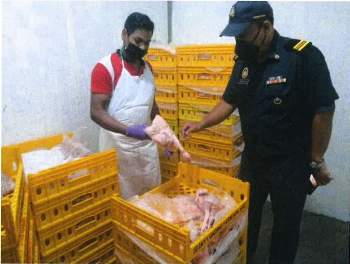
彭州贸消执法组今年首5个月在全彭，进行了2万8142次物价检查，包括检查肉鸡及库存量及价格。

他说，从今年1月至5月24日为止，彭亨州内一共有4宗商家因为售卖高于顶价的肉鸡而被罚款，款额从500令吉至3000令吉。