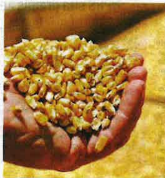
Ketika ini sejumlah 121.4 hektar tanaman jagung bijirin diusahakan oleh PKPS di Kuala Langat, Selangor.

Beliau berkata demikian pada sidang akhbar selepas Majlis Pelancaran Benih Tanaman Selangor di Selangor Fruit Valley (SFV) di Bestari Jaya, di sini pada Khamis.