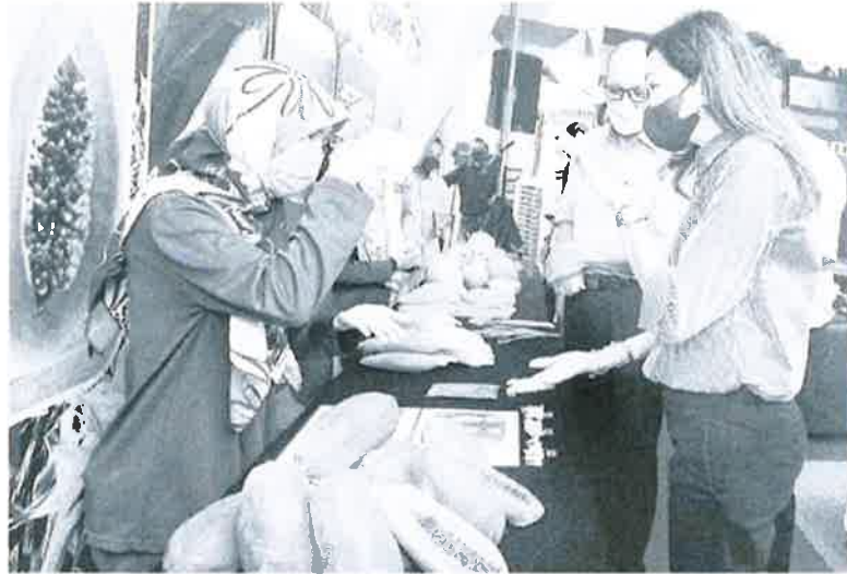
LAWAT PAMERAN: Tengku Permaisuri Norashikin (kanan) berkenan meluangkan masa melawat pameran selepas menyempurnakan majlis Pelancaran Benih Tanaman Selangor di Selangor Fruit Valley Bestari Jaya, di Kuala Selangor semalam.