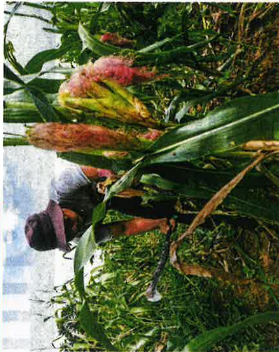
Food production and supply planning for all countries will remain a key concern of development policy planning for all countries.

Now, we are confronted with increases in prices of eggs and chicken, imported items, petroleum and public transport too, mainly due to oil price increases amid