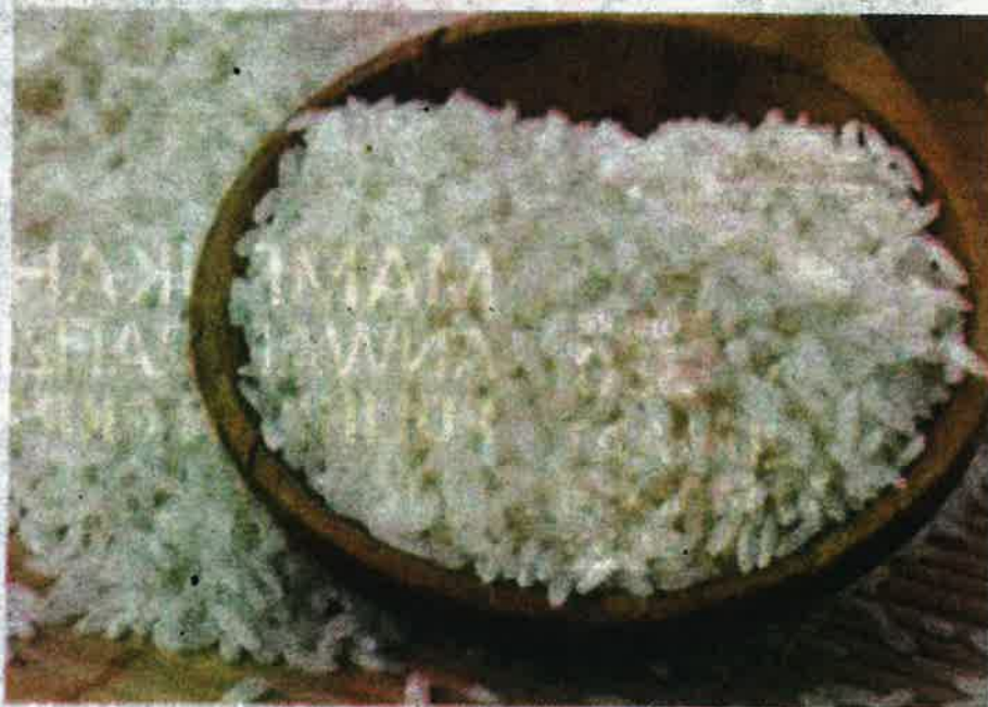
MoU itu menggalakkan kaedah pertanian moden bersifat mekanikal dan teknologi IoT : Gambar Hiasan

Koperasi Felcra adalah sebuah pertubuhan untuk meningkatkan taraf sosio-ekonomi ahli-ahli dan masyarakatnya. -Bernama