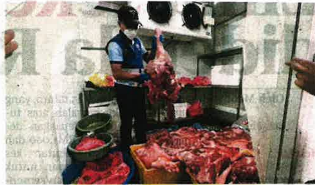
PENGUAT KUASA JPV Pulau Pinang menunjukkan karkas babi yang dirampas dalam dua pemeriksaan yang dijalankan.