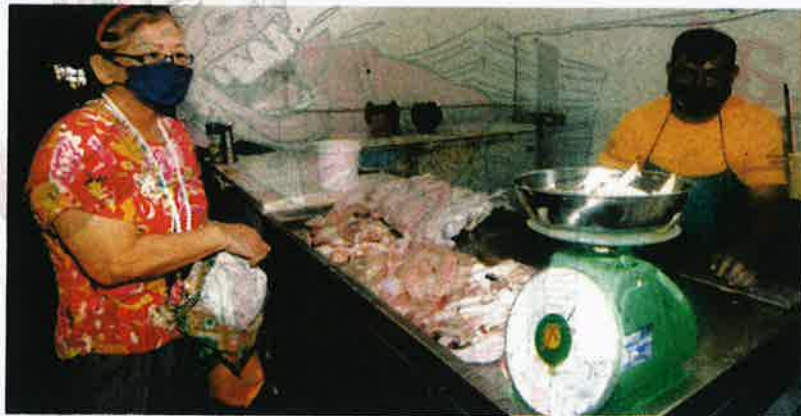
SEORANG pelanggan mendapatkan bekalan ayam di Pasar Awam Chowrasta, George Town semalam.

ng tiada setelah bekalan ayam kembali mencukupi sehingga ada yang terlebih dihantar pihak pembekal semalam (kelmarin).