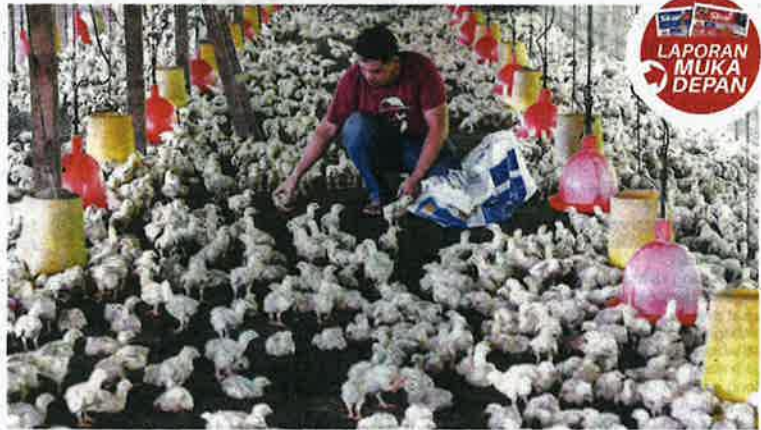
Kerajaan perlu mewujudkan satu mekanisme bagi memastikan kesemua golongan sasar mendapat bantuan yang disalurkan selepas subsidi ternakan ayam dihentikan.

Perdana Menteri, Datuk Seri Ismail Sabri Yaakob pada Rabu,