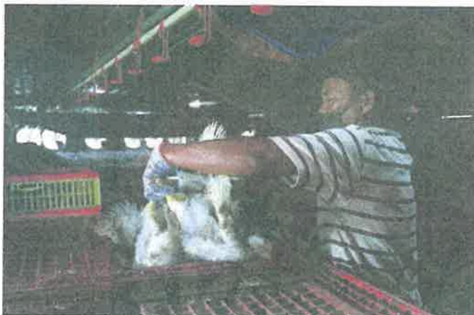
In a bind: A worker putting chickens into a cage for transport to market at a poultry farm in Sepang, Selangor. Breeders are also urging the government to expedite subsidy payments.

Instead it will be channelled directly to the people who are in