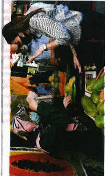
TENGGU Permaisuri Norashikin (kanan) berkenan melawat pameran di Selangor Fruit Valley Bestari Jaya.