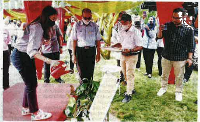
Tengku Permaisuri Norashikin menyiram pokok nanggem pada Majlis Pelancaran Benih Tanaman Selangor di SFV di Bestari Jaya, Kuala Selangor pada Khamis.

Izhah memberitahu, tanaman itu dijangka menjadi penanda aras baharu dalam bidang pertanian moden di negeri ini.