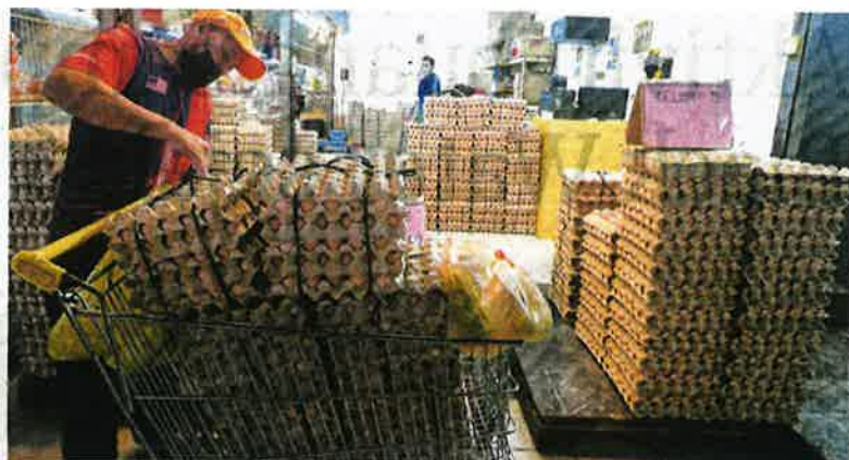
Peniaga diingatkan tidak mengaut keuntungan yang tidak munasabah ketika berdepan isu kenaikan harga barang. (Foto hiasan)

"Kerajaan juga ingin menggalakkan semua pengguna