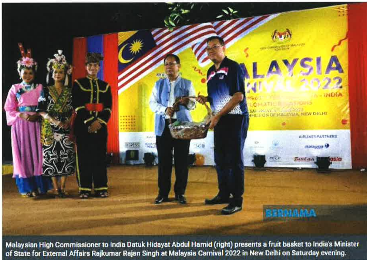
Malaysian High Commissioner to India Datuk Hidayat Abdul Hamid (right) presents a fruit basket to India's Minister of State for External Affairs Rajkumar Ranjan Singh at Malaysia Carnival 2022 in New Delhi on Saturday evening.

NEW DELHI June 5 (Bernama): Malaysia organised a festival of food and culture in New Delhi on Saturday evening to celebrate 65 years of diplomatic relations with India.