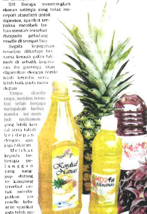
SEBAGIAN daripada produk keluaran Sorellicious.

naikkan semangat mereka untuk terus berusaha selain fokus mengeluarkan produk berkualiti untuk meningkatkan kualiti kes-