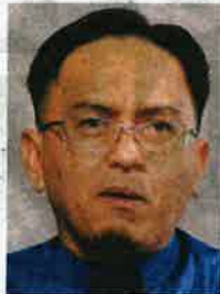
Senator Ir Ts Haji Khairil Nizam

"Terbaharu, India pula mengumumkan larangan eksport gandum; antara sebabnya kesan perubahan iklim sekali gus menyaksikan harga global komoditi itu naik mendadak 60 peratus. Bener, Malaysia tidak mengimport dari negara itu,