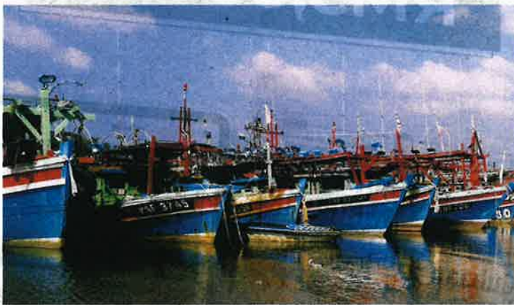
BOT nelayan kelas C2 menjadi penyumbang terbesar tangkapan ikan dalam negara.

Terdahulu, akhbar melaporkan, Kementerian Pertanian dan