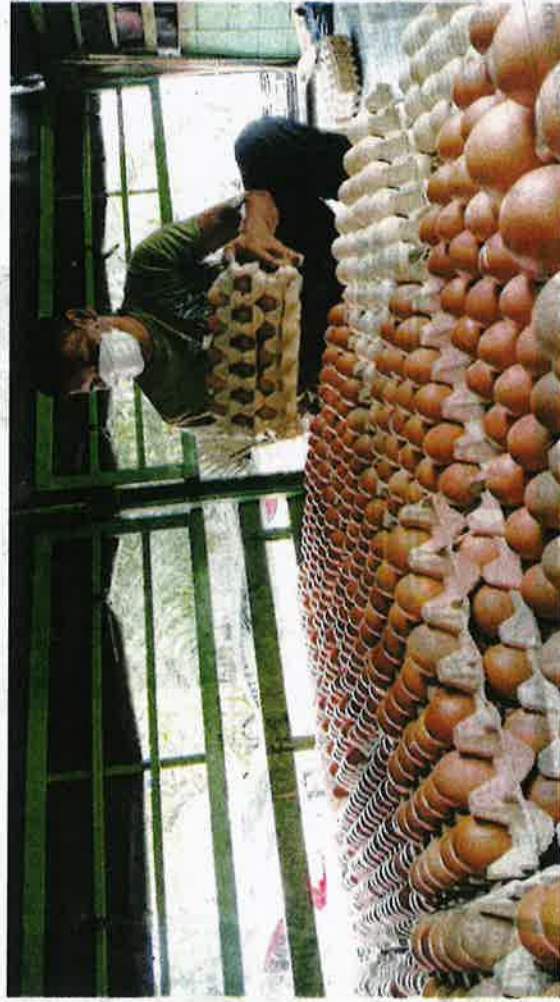
BEKALAN telur ayam di Pulau Pinang didakwa berkurangan 60 peratus sejak dua minggu lalu. - GAMBAR HIASAN

Katanya, bekalan yang diperoleh setakat ini hanya mencukupi untuk kegunaan harian, manakala pengedaran kepada