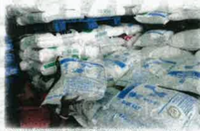
Pelan mitigasi komprehensif mesti diadakan agar risiko kewujudan 'bom jangka' dapat diminimumkan impaknya sekecil yang mampu.

Apatah lagi, katanya pada aspek harga, Bank Dunia juga meramal ia akan meningkat