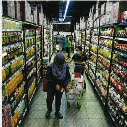
People shopping at a supermarket. The government has formulated short-, medium- and long-term measures to stabilise food supplies and prices.

several medium- and long-term measures to stabilise the supply and prices of food.