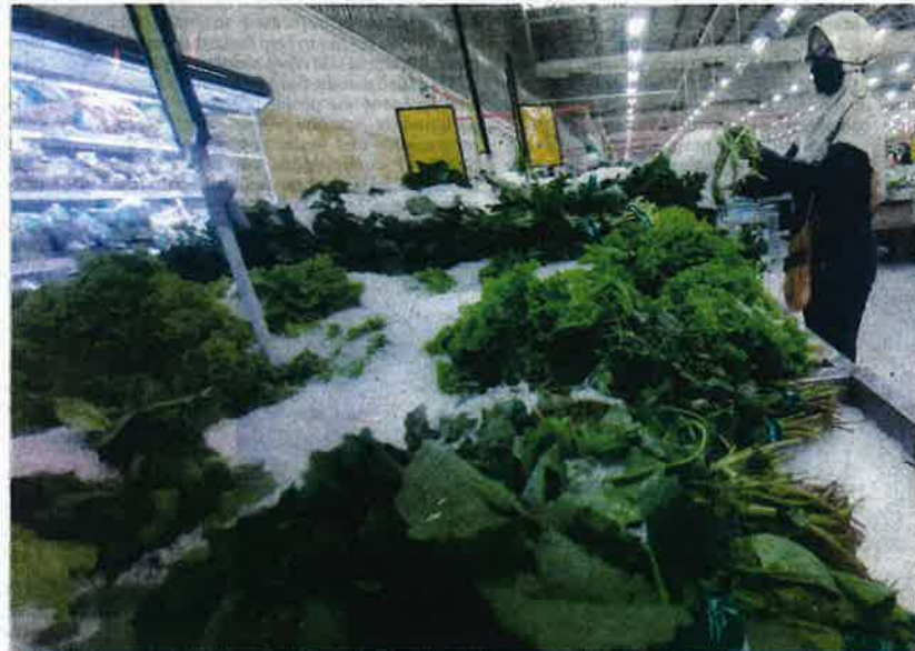
Due to the current food supply issue affecting the nation, people have been urged to grow their own vegetables.

Last Tuesday, the Perak government urged people in the state to grow vegetables and rear livestock for their own consumption due to the current food supply shortage, which sparked criticism from various parties, including