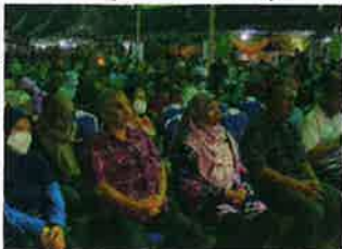
Orang ramai hadir memeriah majlis perasmian Pesta Orkid, Flora dan Herba 2022 yang berlangsung di RTC, Tunjung, Kota Bharu bermula Khamis.

"Sektor ini akan kekal sebagai teras ekonomi dan pemangkin kepada perkembangan pengeluaran Orkid, Flora dan Herba Negara," katanya selepas merasmikan Pesta Orkid, Flora dan Herba 2022 di Pusat Transformasi Luar