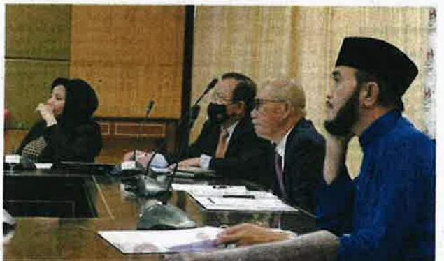
Mesyuarat bersama beberapa anggota Kementerian dan pihak berkaitan bagi membincangkan mengenai isu bekalan makanan.

Macam juga padi kita, padi perlukan air sebab itu pada yang varieti yang ada di tempat kita ini tidak se- suai ditanam di negara ma- cam di Mesir, Syria, nega- ra-negara yang ada padang pasir, tetapi di sana ada padi dia, ada berasnya.