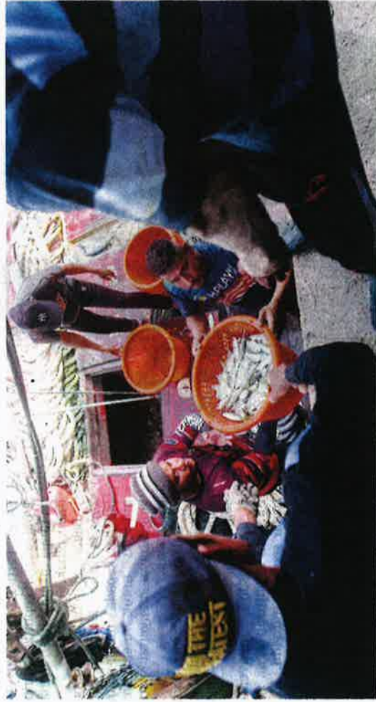
HASIL tangkapan nelayan didakwa dikuasai oleh orang tengah yang bertindak sebagai pembeli utama bertujuan menguasai pasaran, harga dan bekalan ikan di seluruh negara.