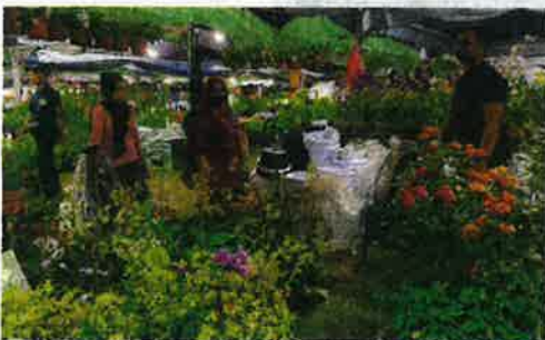
Pengunjung tidak melepaskan peluang mendapatkan pokok bunga yang dijual dengan harga berpatutan.