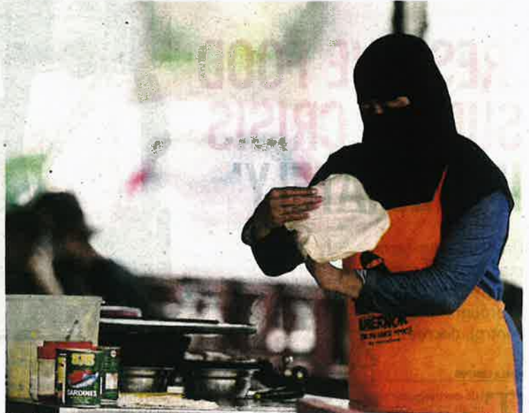
A roti canai seller preparing the dish at a stall in Taman Cempaka Ampang, Kuala Lumpur, recently. Roti canai is a popular dish for breakfast.

"But I have noticed that the price of roti canai has increased between 20 and 50 sen per piece from its usual price of RM1."