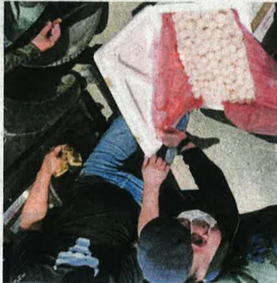
ANGGOTA PGA memeriksa kotak mengandungi telur penyu dipercayai cuba diseludup keluar oleh suspek ke negara jiran melalui ICQS Merapok, Lawas.