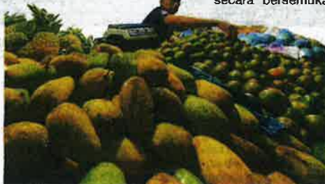
Pelbagai jenis buah-buahan segar turut dijual sepanjang pesta diadakan.