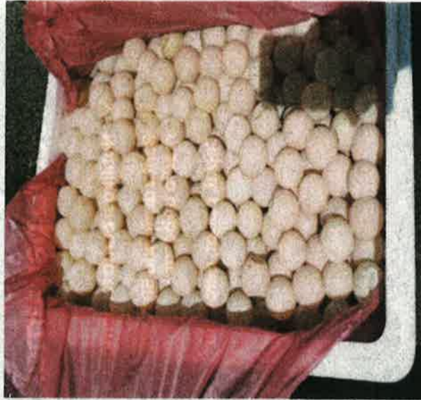
TELUR penyu yang dirampas.

Katanya, tangkapan dan rampasan diserahkan kepada Perbadanan Perhutanan Sarawak Bahagian Larian untuk tindakan dan siasatan lanjut mengikut Seksyen 29 (1) Ordinan Perlindeungan Hidupan Liar Sarawak 1998.