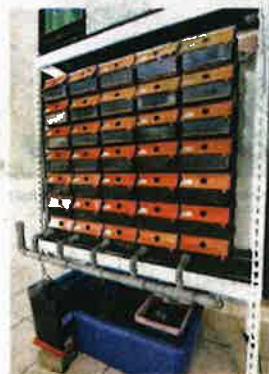
SET sistem ini dari sudut pandang keseluruhan.

Bentuk sistem ini seakan rumah kondominium dan ia tidak memerlukan ruang yang terlalu besar."