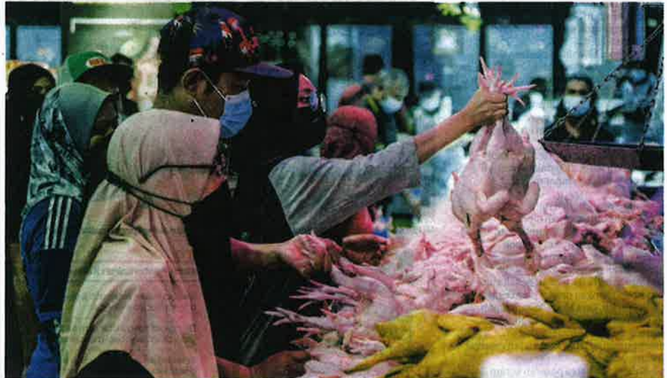
KRISIS makanan termasuk harga ayam yang melambung baru-baru ini turut menambah lagi kesukaran hidup rakyat yang baru sahaja bergelut dengan kesan pandemik Covid-19. - GAMBAR HIASAN

Bahkan, yang lebih membimbangkan, sejak sedekad lalu, jumlah terkumpul import makanan negara ialah sebanyak