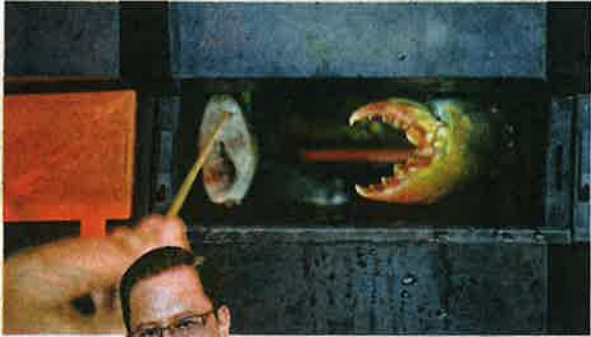
POTONGAN isi ikan kecil disua ke dalam kotak ketika memberi makan ketam.

D i satu sudut kelihatan seorang lelaki sedang memegang isi ikan yang telah dipotong kecil dengan menggunakan penyepit untuk diberi makan kepada ketam-ketam nipah ternakannya. Menariknya ketam-ketam tersebut bukan berada di dalam kolam sebaliknya dalam kotak-kotak seperti peti surat di apartment atau kondominium. Kepingan kecil ikan itu disua ke arah ketam selepas pintu kotaknya dibuka. "Ketam ini hanya makan sekali sehari dan biasanya saya akan memberi ikan