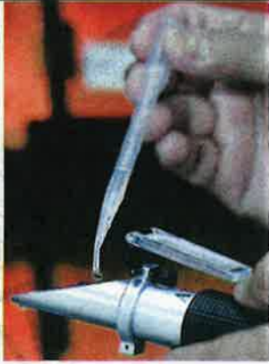
PERALATAN yang digunakan untuk memantau kesihatan air.