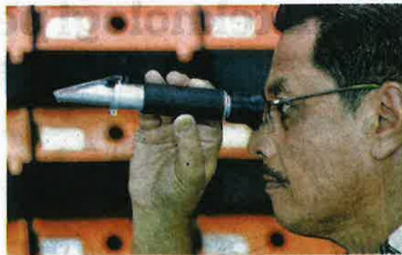
MUSA sedang mengamati kemasinan air yang digunakan dalam penternakan ketam.