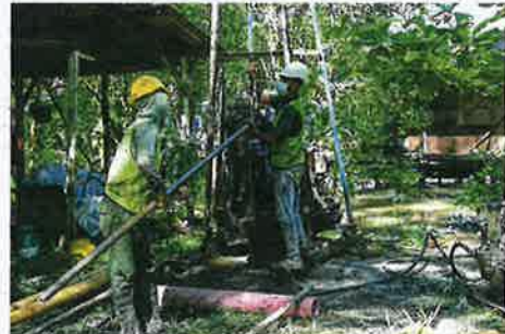
Soil investigation works are now underway at Sungai Bayan Lepas where the state government will build temporary jetties and storage facilities for Permatang Tepi Laut fishermen, in addition to the multipurpose jetty that will be built after PSI's island A has taken shape.