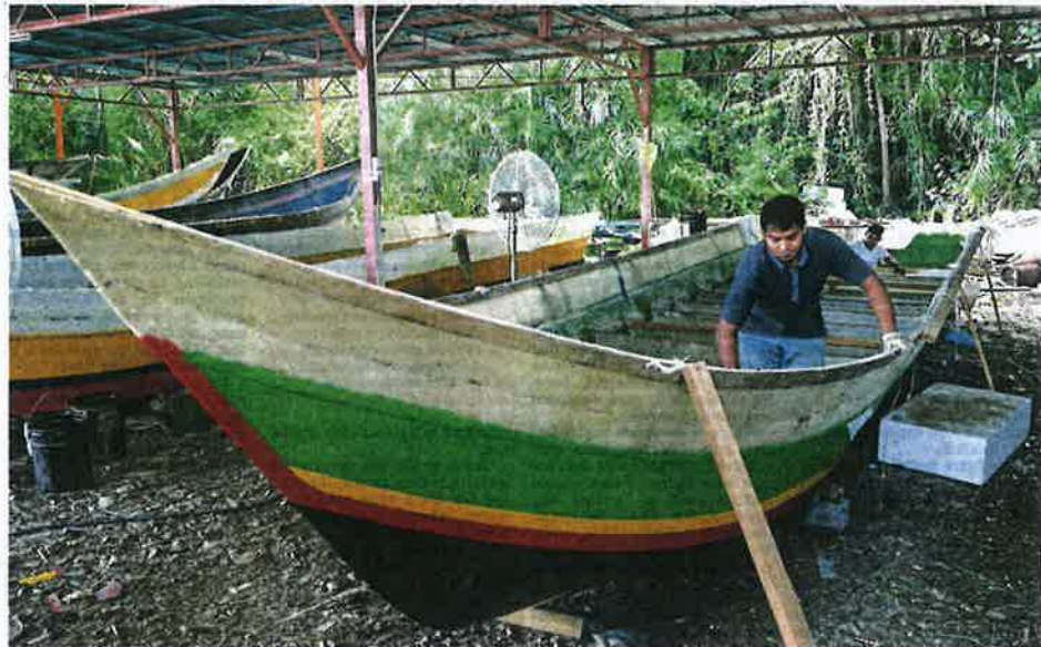
The Penang government is working on providing the first 20 boats to boat owners who have signed up for the Social Impact Management Plan.

KKPPSB hopes for more roles in Penang South Islands' Social Impact Management Plan