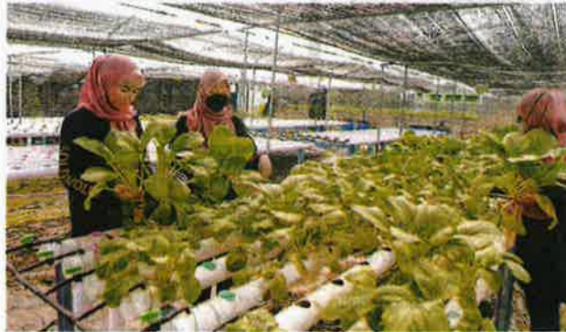
BAGI mengatasi pergantungan import makanan, rakyat Malaysia seharusnya mula memanfaatkan pelbagai teknologi pertanian untuk bercucuk tanam. - GAMBAR HIASAN

RM482.8 bilion berbanding eksport (RM296 bilion).