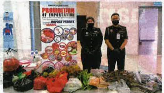
PENGUAT Kuasa Maqis bersama rampasan sayur-sayuran serta ikan tanpa permit di Kompleks ICQS Sempai Melaka, Melaka kelmarin.

"Maqis sentiasa mengawasi aktiviti keluar masuk di semua pintu masuk negara bagi memastikan komoditi pertanian, ikan dan haiwan mematuhi syarat dan peraturan ditetapkan," katanya.