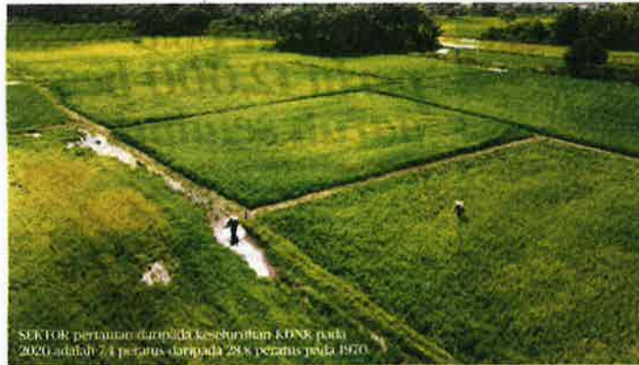
SEKTOR pertanian daripada kesedaran KDNK pada 2020 adalah 7.4 peratus daripada 28.8 peratus pada 1970.