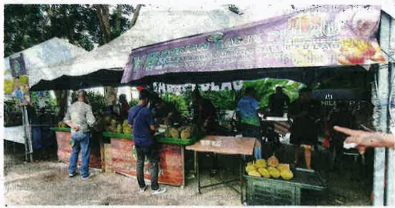
Gerai #YB Durian Balik Pulau antara yang menjadi tumpuan di Anjung Indah, Balik Pulau.

"Tambah pula musim cuti sekolah baru-baru ini. Setiap hujung minggu dipenuhi pengunjung dan penggemar durian yang datang dari seluruh negara dan pelancong asing," ujarnya.