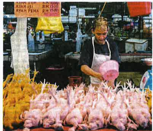
Edi terpaksa jual ayam segar melebihi harga siling RM8.90 sekilogram.

"Saya pastikan bekalan dihabiskan pada hari sama untuk mengekalkan kesegaran ikan, tak boleh bawa ke hari berikutnya," katanya.