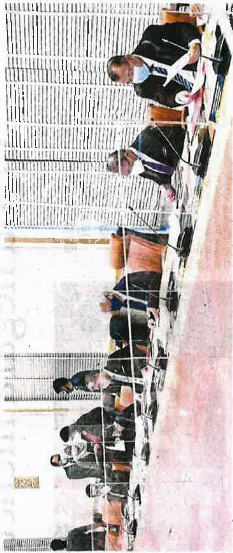
Isma Sabri memimpin mesyuarat Majlis Tindakan Ekonomi di Kuala Lumpur, semalam.

Langkah kedua diputuskan EAC semalam, kata Perdana Menteri, adalah memperluas sistem agronomikan dengan ransangan kerajaan (GLC), syarikat pelaburan berkaitan kerajaan (GLIC) dan agensi kerajaan.