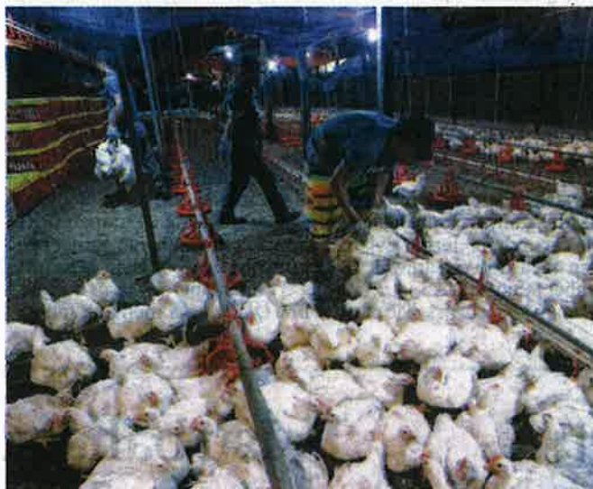
SYARIKAT pelaburan berkaitan kerajaan perlu memainkan peranan memastikan bekalan makanan di negara ini stabil dan mencukupi.

"Kerjasama awam dan swasta dipertingkatkan bagi memberi fokus terhadap usaha modenisasi dan menggalakkan pertanian pintar dalam meningkatkan hasil pertanian. Inisiatif ini akan disokong melalui usaha menyatukan tanah ladang, tanah terbiar dan tanah wakaf," katanya dalam kenyataan semalam.