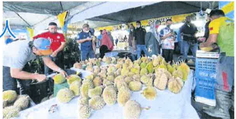
■2022年榴槤嘉年華嘉年華從上周五至周日進行，匯集各種浮羅山背的榴槤品種，包括紅蝦、貓山王、坤寶、葫蘆及黑刺。（檔案照）