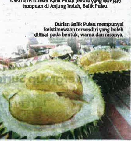
Durian Balik Pulau mempunyai keistimewaan tersendiri yang boleh dilihat pada bentuk, warna dan rasanya.