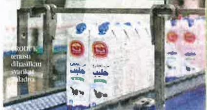
KLANG memproses hasil tenusu milik syarikat Baladna di Qatar.