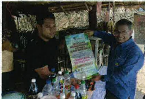
Seorang peniaga gerai menerima banner Pelancaran Minuman Isotonik Sweet Nira Terengganu.

"Sekarang, kita ke arah tukar daripada menggunakan gula putih kepada gula merah atau molases.