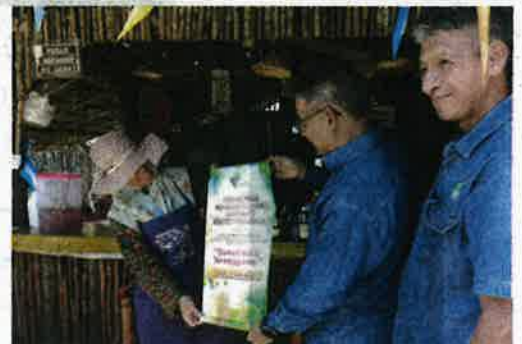
Seorang peniaga wanita menerima banner Pelancaran Minuman Isotonik Sweet Nira Terengganu.