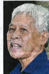
Tan Sri Idris Jusoh

"This is not only to increase the income of Felda settlers and its new generation but also to help