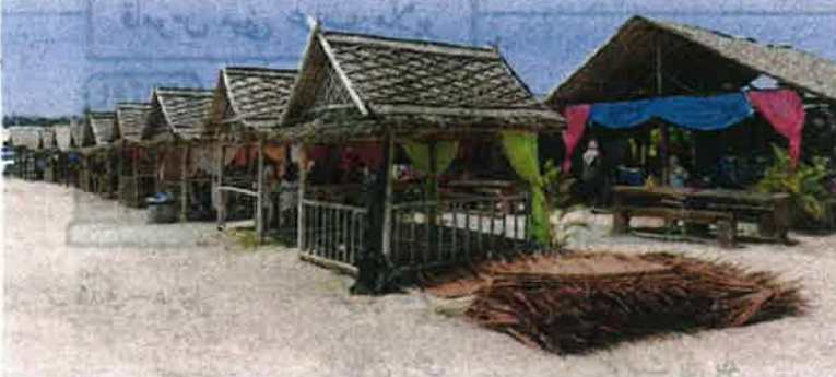
Deretan gerai dan wakaif unbuik peniaga serta pengunjung Dataran Batu Putih, Marang.