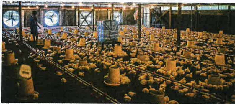
Pelbagai strategi dirancang NAFAS dan ANGKASA bagi meningkatkan pengeluaran serta memenuhi permintaan ayam di pasaran. (Foto hiasan)