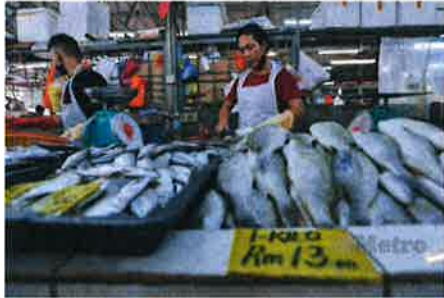
PENJUAL ikan di Pasar Jalan Raja Bot, Chow Kit.

Kuala Lumpur: Kabinet hari ini bersetuju dengan pelaksanaan tiga lagi intervensi tambahan bagi menangani isu bekalan makanan negara sekali gus merancakkan aktiviti pengeluaran makanan domestik.