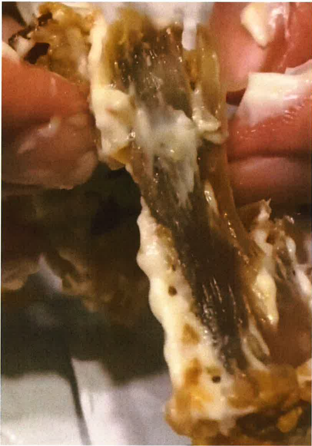
阿斯拉夫炮轰鸡肉如轮胎，咬不断！（视频截图）