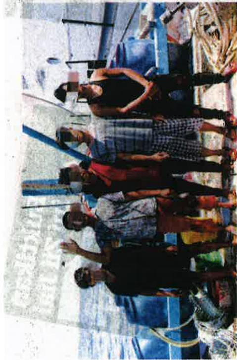
SEBAHAGIAN nelayan asing yang ditahan APMM di kedudukan 22 batu nautika barat daya Sungai Besar dekat Klang kelmarin.

Kes disiasat mengikut Akta Perikanan 1985 dan Akta Imigrasi 1959/63.