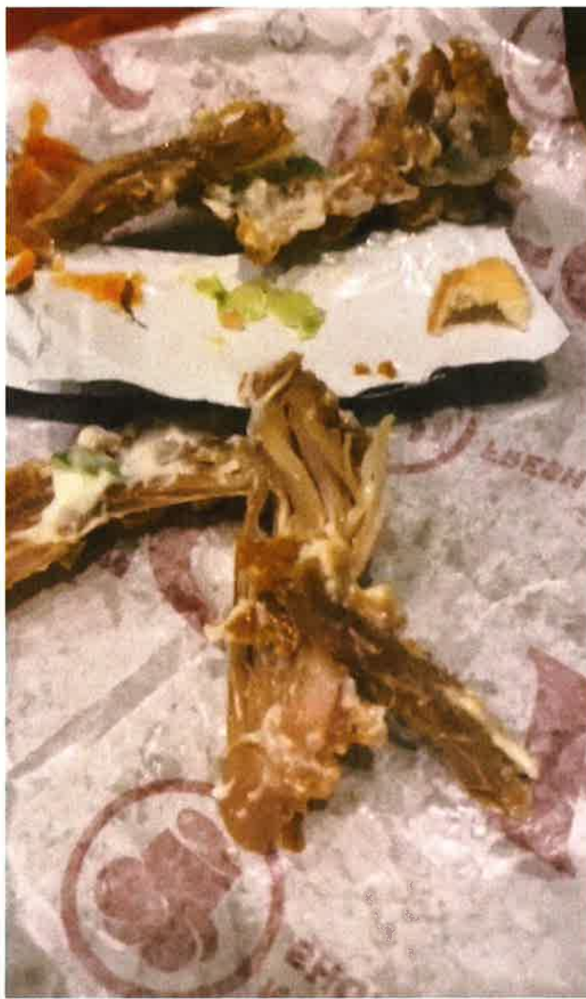
阿斯拉夫怀疑鸡肉是否被加热无数次？（视频截图）