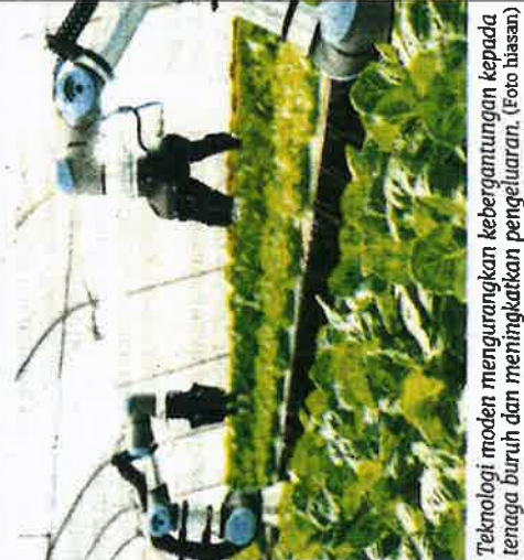
Teknologi moden mengurangkan keberagutan kepada tenaga buruh dan meningkatkan pengeluaran. (Foto hiasan)

Kaedah lain termasuk memberi latihan kepada semua pihak dalam rantaian bekalan seperti pengangkutan dan logistik, kawalan mutu kualiti produk serta khidmat pelanggan, bagi menghapuspkan keberagutan dan peranan kartel memampukan pengurusan rantaian bekalan makanan.