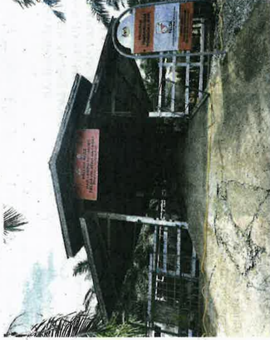
Hab Lembu Pedaging yang terletak di Felda Sahabat, Sabah.

dengan kelebihan tanah yang luas mempunyai potensi yang baik untuk menjadi hab lembu pedaging seperti dilaksanakan di Felda Sahabat, Sabah.