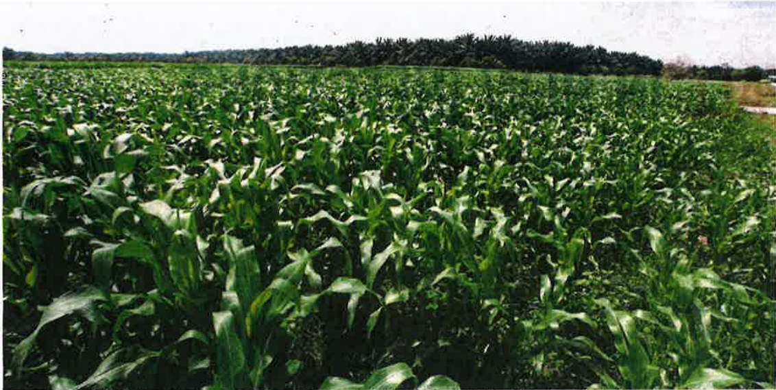
The government's initiative to encourage efforts to grow grain corn will empower the chicken industry value chain. FILE PIC