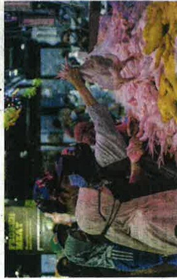
ORANG ramai berkunjung ke pasar raya ST Rosyam Mart di Setiawangsa bagi mendapatkan bekalan ayam. Baru-baru ini bekalan ayam mengalami gangguan ekoran permintaan tinggi semasa musim perayaan.

"Isu sekarang kalau kita faham dengan teliti adalah disebabkan permintaan yang meningkat berkali ganda kerana musim perayaan, rumah terbuka dan kenduri. Tetapi suasananya aktiviti itu dan permintaan sekarang sudah berkurang, jadi permintaan bekalan sudah mula normal. "Jadi, kalau tambahkan pengeluaran dan dalam masa sama permintaan tak ada, apa jadinya? Harga ayam turun sampai penternak rugi sebab ayam itu tak terjual. Itu sebab susah kalau orang tak pelan dalam jangka panjang.