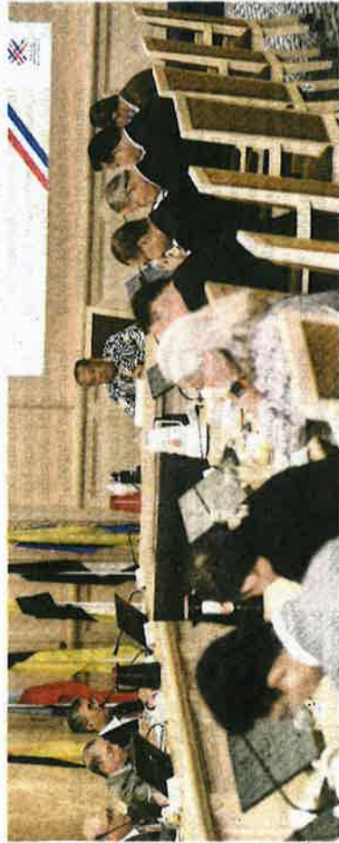
MUHYIDDIN ketika hadir untuk memperkeratkan Mesyuarat MPN B16/2022 di Kementerian Kewangan.