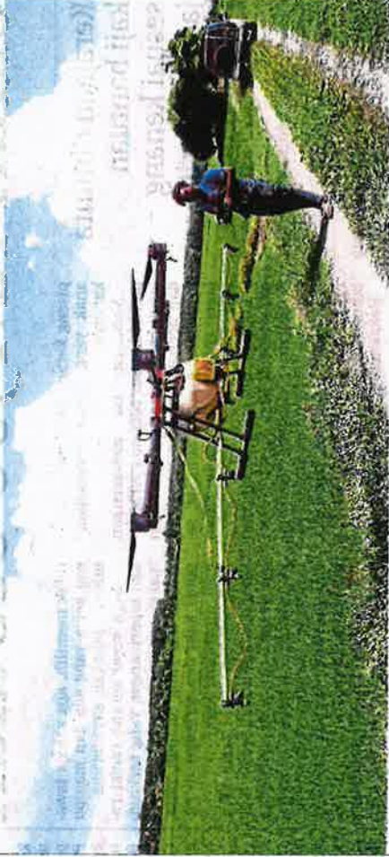
Pembabitkan generasi muda dalam pertanian dengan teknologi moden jamin sekuriti makanan negara.

Apabila kegiatan berkebun dilakukan, masalah ancamannya sekuriti makanan akan dapat diatasi se- perti disarankan pihak kerajaan secara jangka pendek dan panjang. Pada masa sama harga bagi keperluan asas akan dapat diturunkan dan me- ningkatkan kuasa beli rakyat semula.