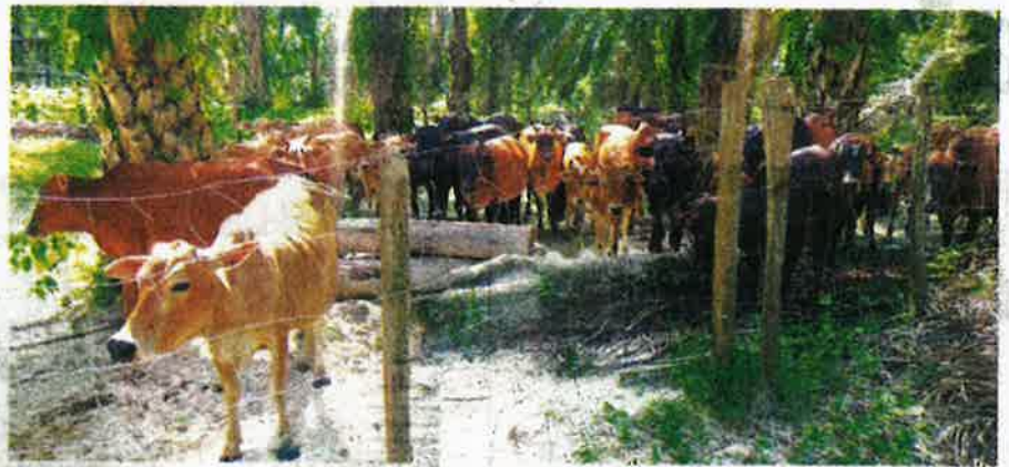
LEMBU dan kerbau dibawa dari Thailand setakat ini bebas daripada sebarang penyakit.

Keadaan itu menyaksikan Malaysia hanya mengimport sebanyak 10,192 ekor lembu dari Thailand pada tahun lalu sebelum larangan dikuatkuasakan menjelang perayaan tersebut.