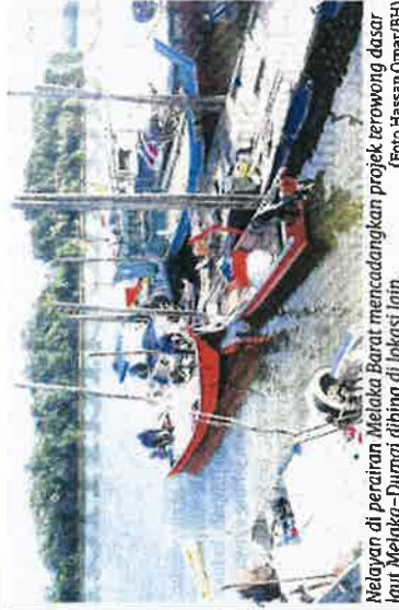
Nelayan di perairan Melaka Barat mencadangkan projek terowong dasar laut Melaka-Dumai dibina di lokasi lain.