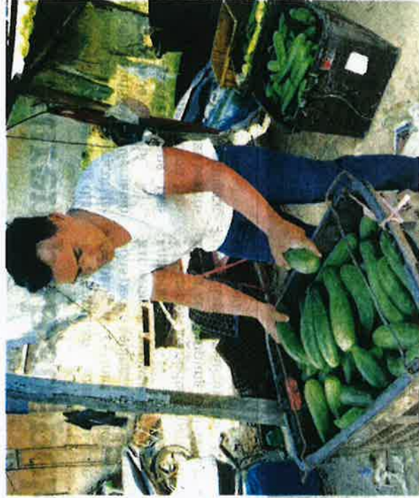
ANAS menyusun timun yang baru dipetik untuk dijual kepada pemborong ketika ditemui di Kota Tinggi semalam.

"Kami mohon tanah kebun ini secara komuniti untuk diusahakan. Saya ambil masa enam hingga tujuh bulan untuk membeli barangan sedikit demi sedikit dan memulakan tanam dengan 2,000 polibeg," katanya ketika ditemui di Bandar Tenggara semalam.