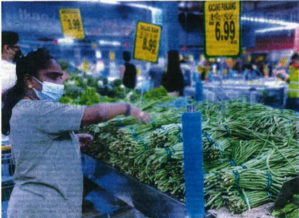
Mohideen said a study should be conducted to ascertain the reasons Malaysia needs to import produce that can be grown locally.