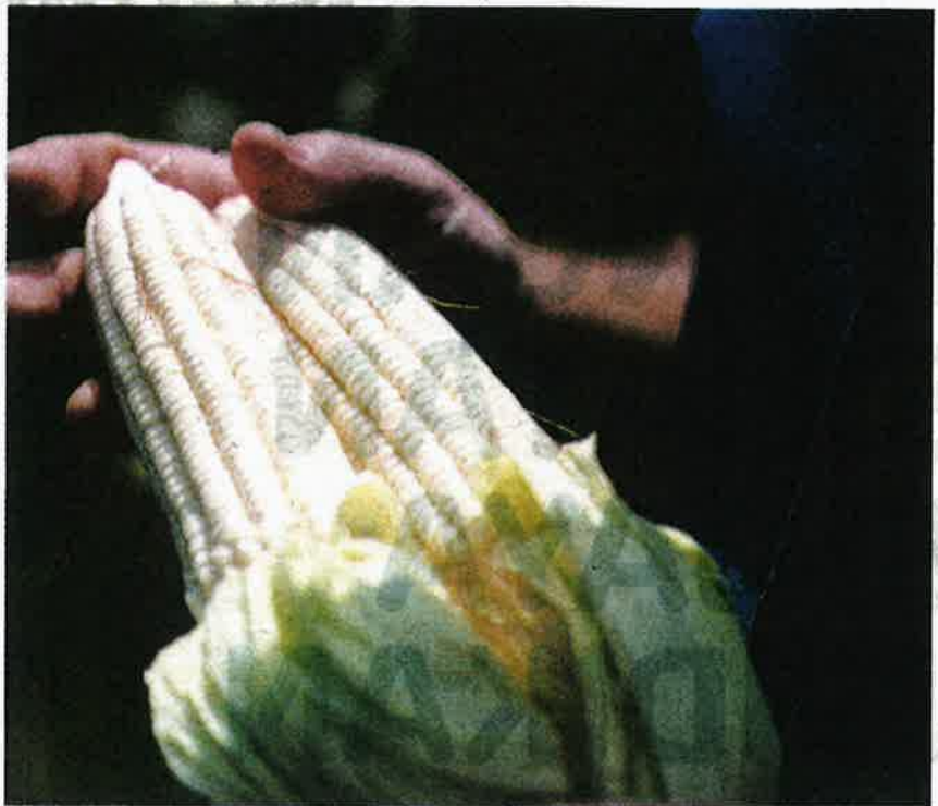
TANAMAN jagung bijian akan dimulakan dalam skala besar di Kelantan dan Terengganu.

“Usaha ini dalam masa yang sama dilihat dapat mewujudkan peluang pekerjaan yang baharu dan dapat meningkatkan aktiviti ekonomi di sekitar kawasan yang