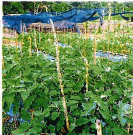
Tanah terbiar wajar dibangunkan untuk projek pertanian bagi memastikan bekalan makanan dalam negara terjamin. (Foto hiasan)

"Antara pendekatan yang akan diambil bagi membangunkan tanah terbiar sama ada milik tempatan, agensi dan kerajaan negeri," katanya.