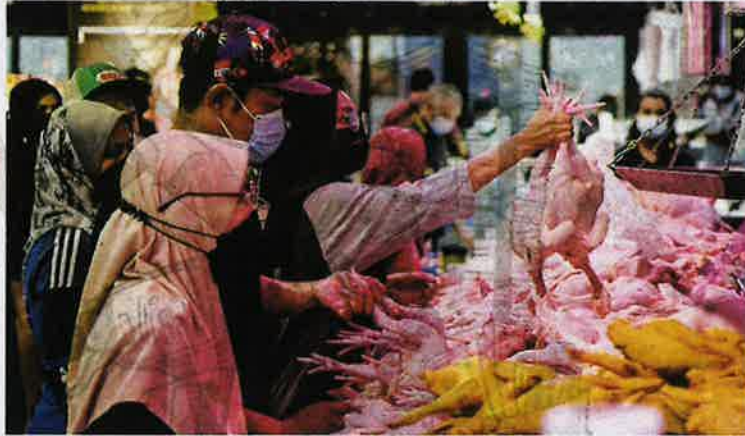
SKIM harga maksimum runcit ayam akan berakhir pada 30 Jun ini.

"Kalau kenalkan itu tidak munasabah, kita masih ada kuasa