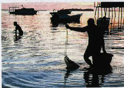
Traditional coastal fishermen catching fish in front of their houses, off the Mantanani Islands in Sabah recently.

"Statistics can show that there is a decline. But what can we do about it? That needs a lot of collaboration." By OLIVIA MIWIL