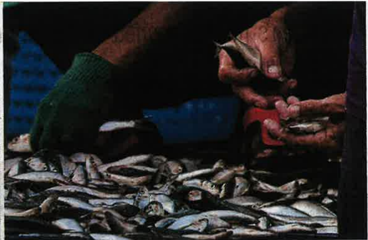
Fresh fish being sold at the Semporna Fish Market on Saturday.