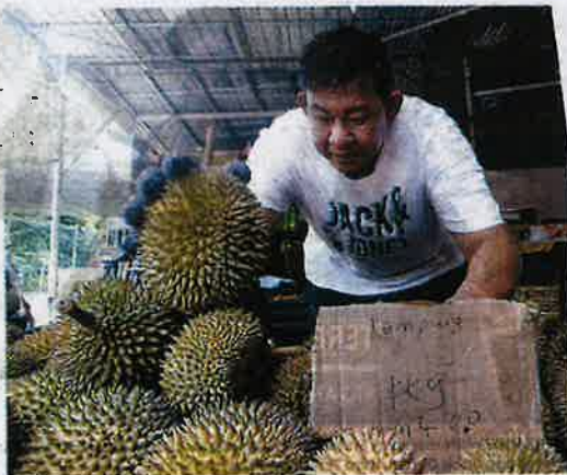
HARGA durian premium di Pulau Pinang dijangka kekal hingga akhir musim. Jualan ini berikutan mendapat permintaan tinggi dalam kalangan peminat raja buah itu. – IQBAL HAMDAN

"Setiap kali musim durian terutama hujung minggu, Pulau