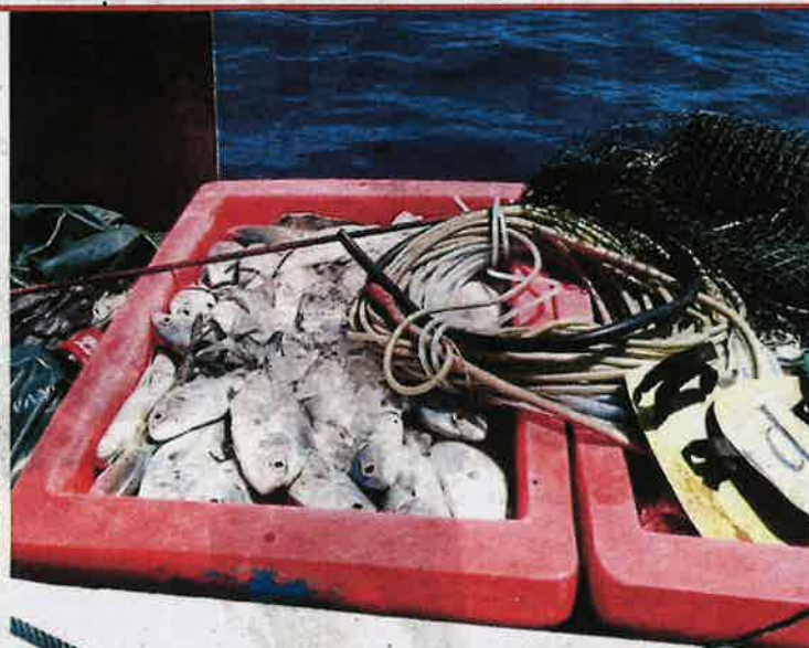
Fish seized by the marine police from people suspected of fish bombing off Pulau Gaya in Sabah. FILE PIC