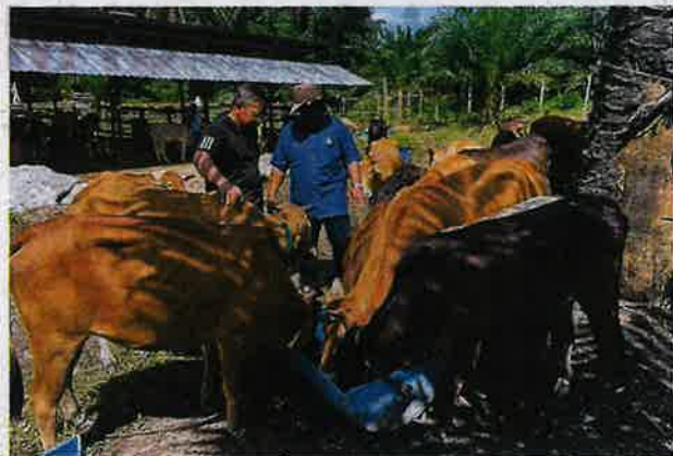
Menjengah ke arah lembu.

musim tengkujuh adalah musim nelayan 'pecah celeng' (labung). Tapi, kali ini bukan sahaja tabung tidak perlu pecah, malah boleh simpan lagi untuk tabungan.