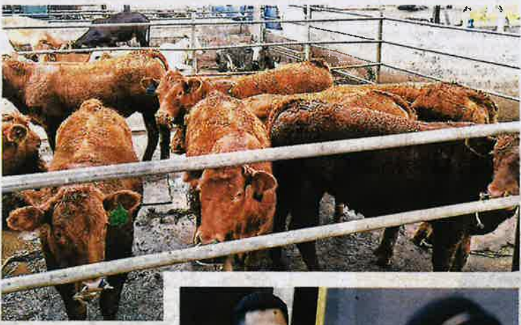
LADANG lembu berteknologi tinggi dapat menghasilkan daging berkualiti bagi memenuhi pasaran tempatan.

"Kami ingin membantu Keluarga Malaysia mendapatkan produk pada harga yang berpatutan dan tidak membebani mereka. Pada masa sama, objektif ladang lembu ini juga bukan setakat untuk pasaran daging di Malaysia, sebaliknya akan dipasarkan kepada negara jiran pada masa akan datang apabila kami mendapat sijil bebas FMD," jelas beliau.