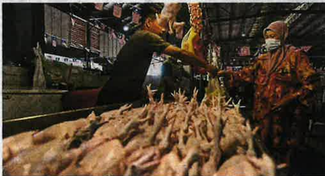
ORANG ramai membeli ayam segar di Pasar Chabang Tiga, Kuala Terengganu.

tindakan itu membebaskan pengguna namun ayam kini menjadi pilihan utama susulan kenaikan melampau harga ikan sejak kebelakangan ini.