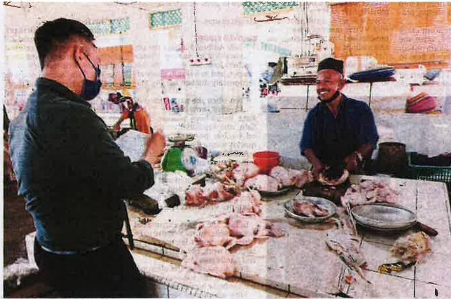
A chicken seller speaking to an enforcement officer at the Wakaf Baru wet market in Tumpat yesterday.

Another chicken seller, who wanted to be known only as Lily, said because of this, she could sell fewer than 10 chick-