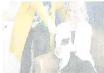
您的意见很重要, 今天就参与并获得奖励。