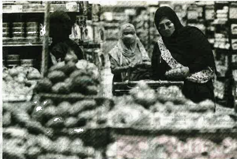
PENGGUNAAN baucar makanan di pasar, kedai runcit dan pasar raya pada masa hadapan misalnya adalah mekanisme yang cekap dalam membantu mengurangkan kos hidup kumpulan memerlukan.

“ Pada masa hadapan, pemberian kepada isi rumah yang memerlukan perlu diberikan secara khusus dan tersasar.”