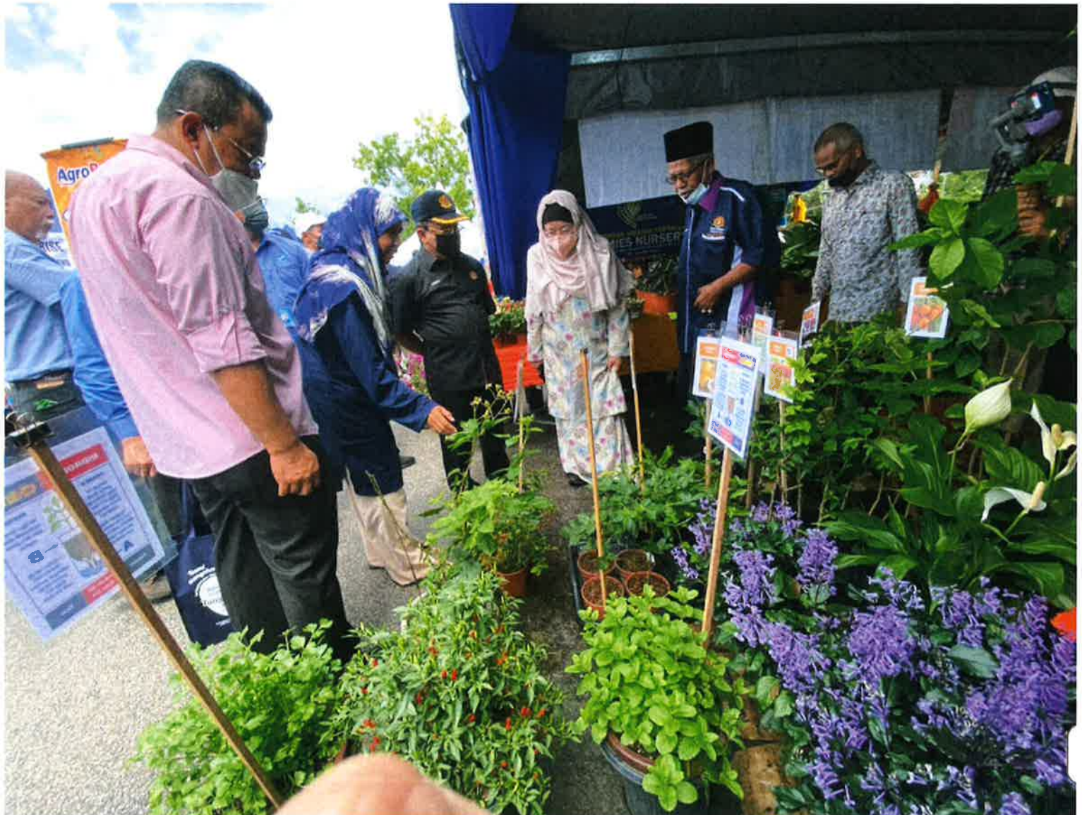
阿末韩查（左三）在槟州农业与农基工业委员会主席诺丽拉（右三）等人的陪同下，参观参展摊位。

（北海23日讯）农业及食物工业部副部长拿督斯里阿末韩查指出，该部原本预测本月开始的榴梿季节，会受天气影响减产30%至40%，但没料到最近榴梿的收成却大好，不但供应充足，价格也平稳。