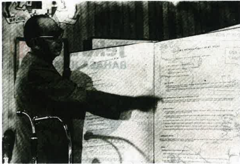
RANCANGAN Buku Hijau yang dilancarkan pada 20 Disember 1974 oleh Perdana Menteri ketika itu, Tun Abdul Razak Hussein menumpukan perhatian kepada penggunaan tanah untuk tanaman jangka pendek dan perkebunan cara berkelompok.