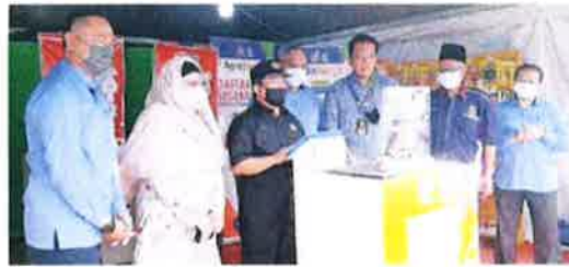
阿末韩沙 (左 3) 在檳州行政议员诺蕾拉 (左 2) 等人的陪同下为檳州水果、花卉及美食嘉年华展主持开幕。

【北海 23 日讯】农业及食品工业部副部长拿督斯里阿末韩沙指出，根据该部门的观察，6 月份的首两周肉鸡及鸡蛋供应稳定，没有出现短缺情况，因此，该部希望这种情况能够持续下去。