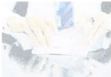
下周一政府再加码派钱! BKM第二阶段你能拿多少?