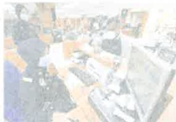
去JPG无须再人挤人! 教你用线上系统拿号码排队