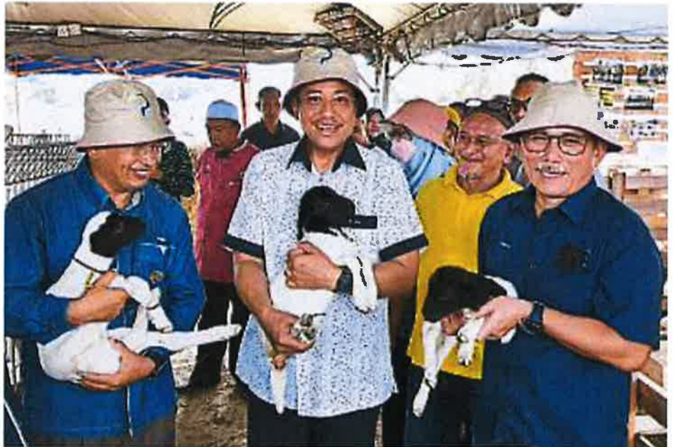
阿兹曼依布拉欣(左起)、阿末山苏里及罗纳建迪出席在登嘉楼举行的2022年农民、畜牧业者及渔民日开幕仪式,并开心抱起现场的羊只。