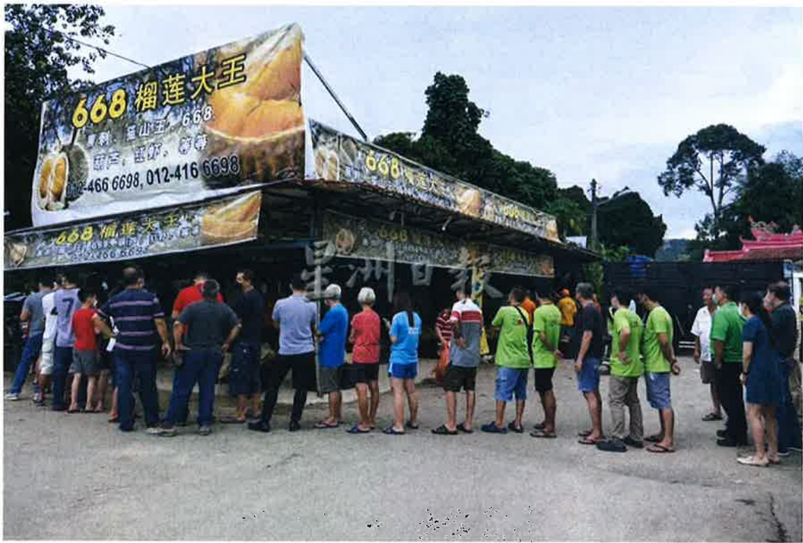
668榴梿大王攤子排了200多人。

(威南23日訊) 本季黑刺、貓山王盛產且有價，668榴梿大王舉辦榴梿嘉年華回饋顧客，包括貓山王和黑刺的2噸榴梿免費吃。