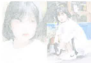
最强童颜震惊全网! 女星演小学生竟零违和