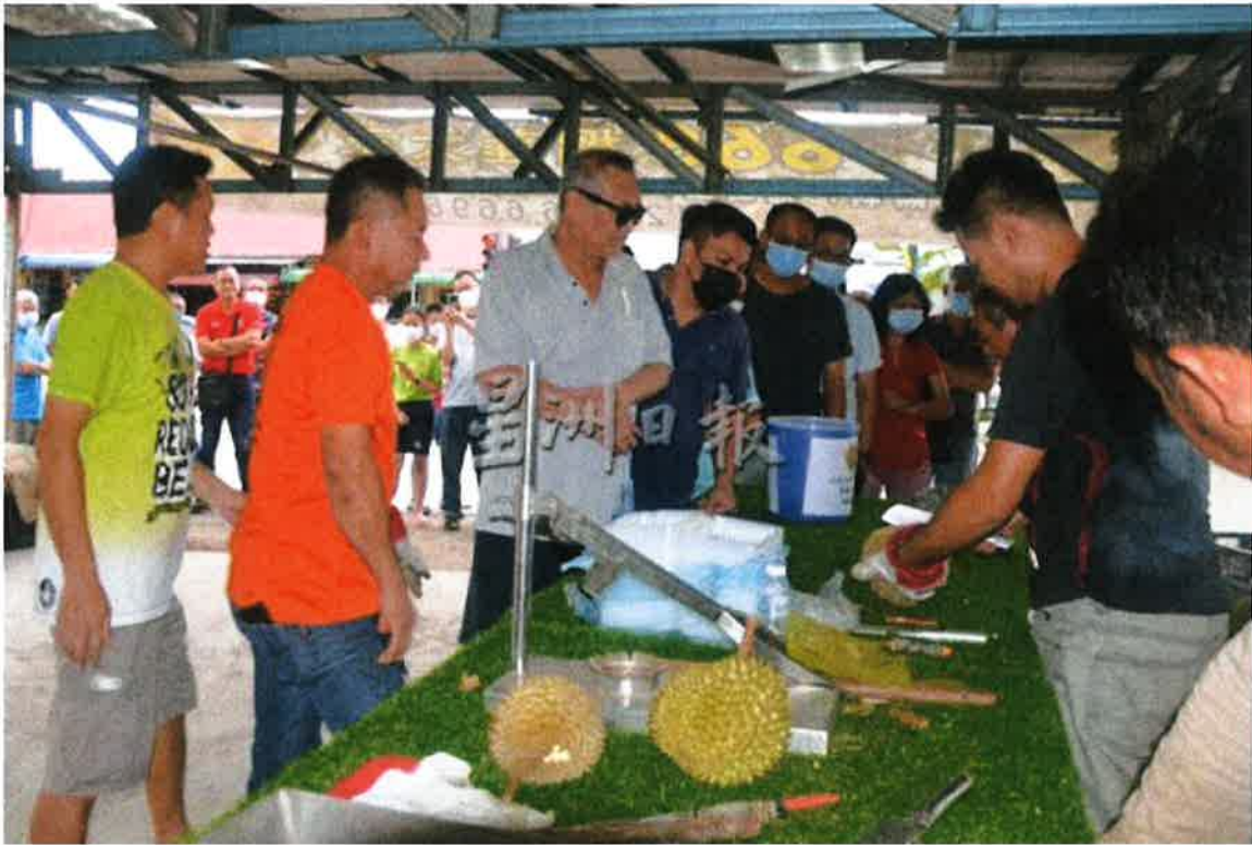
民众吃完再到柜台领取榴梿，工作人员开榴梿开到手软。

活动是在下午2时开始至吃完为止。据工作人员指出，今早就有很多外地人包括槟岛，大山脚人来摊子询问，获知是在下午2时才开始后，索性待在摊子等待。