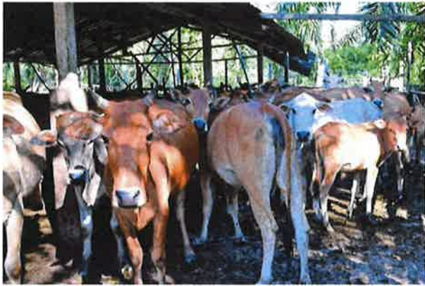
Kuarantin lembu dari Thailand disingkatkan kepada tiga hari saja.