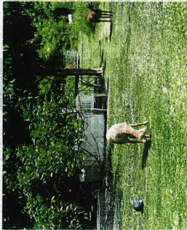
Pusat Komuniti Kebun-Kebun Bangsar turut memelihara haiwan ternakan menimbulkan ketidakelesen kepada penduduk