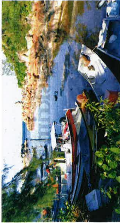
SEBAHAGIAN bot nelayan di Pantai Penanjung, Kijal, Kemaman, Terengganu.