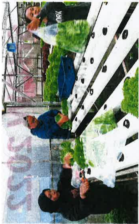
The Kundasang Aquafarm aims to educate people on the importance of food security to cushion the impact of inflation and rising prices.

Today, the farm annually supplies about 300 tonnes of crop, worth about RM300,000, to hypermarkets and hotels in Sabah. The crops are also exported to Sarawak and Brunei.