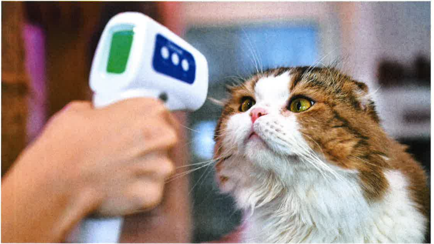
图非涉事宠物猫。