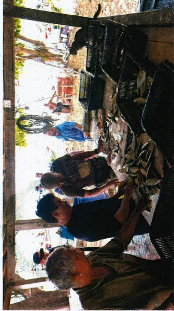
NELAYAN digalak menjual terus tangkapan ikan mereka kepada orang ramai bagi mengelak orang tengah.

Katanya, kehidupan beribu-ribu nelayan pantai khususnya sudah banyak berubah selepas kerajaan membangunkan lebih 140 Kompleks LKIM di seluruh negara bertujuan memberi peluang kepada nelayan untuk menjual sendiri hasil tangkapan mereka.