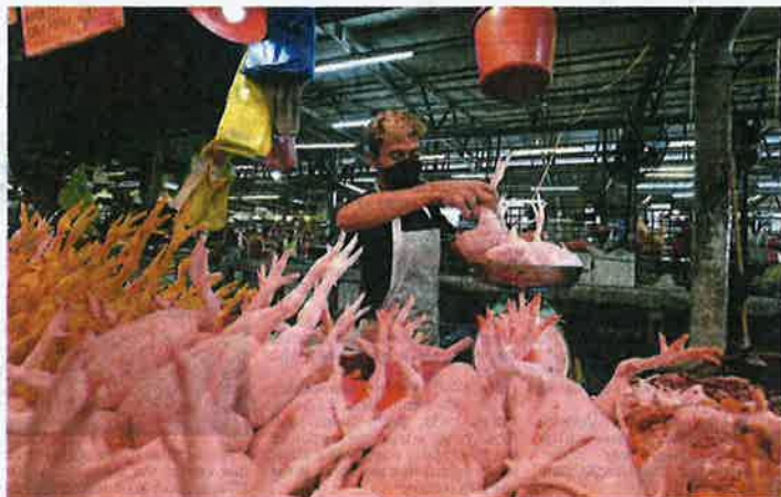
Soaring prices: The new ceiling price for standard chicken and eggs is set to be enforced tomorrow.

not to increase the price of our meals as we know that our customers will not be happy.