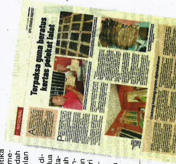
Laporan Sinar Harian pada Rabu.

kuasa Kemajuan dan Keselamatan Rancangan (JKKR) Felda Titi pula mencadangkan supaya ladang ayam berkenaan dipindahkan ke lokasi lain yang lebih sesuai seterusnya dapat menjalankan operasinya dengan lebih baik.