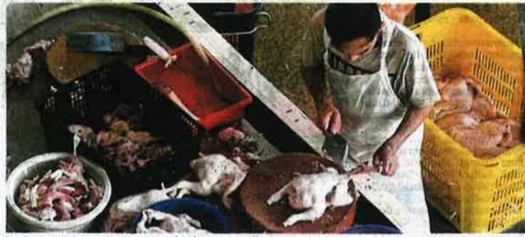
Pentaga memotong ayam segar untuk pelanggannya di Pasar Awam Presint 8, Putrajaya, semalam. Harga siling baharu ayam ditetapkan RM9.40 mulai esok.

"Isu kenaikan harga barang tidak berlaku di Malaysia sahaja, sebaliknya ia adalah fenomena