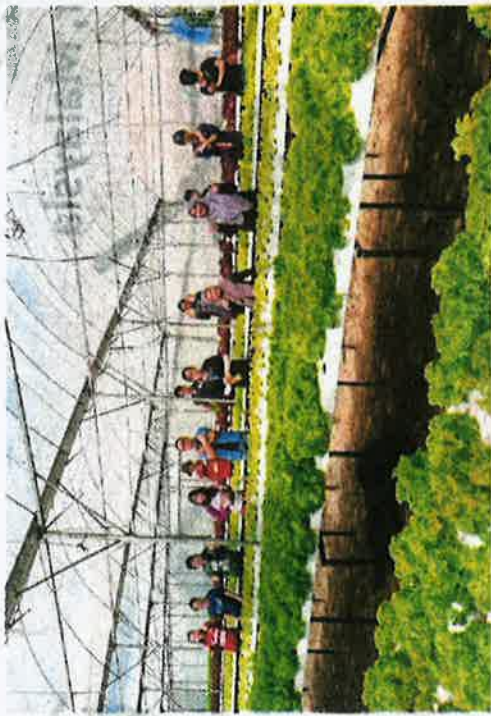
People at a training session on modern farming methods at the Kundasang Aquafarm in Ranau.

After winning cash prizes and grants worth RM85,000 in three competitions organised by the government in 2016, he set up a modern farm in Kundasang.