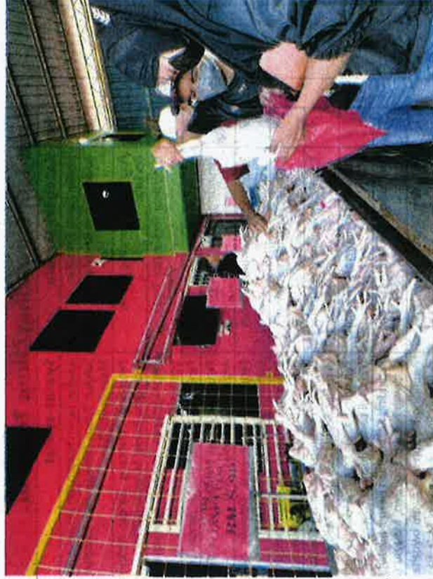
PELANGGAN mendapatkan ayam bulat super di pusat jualan Ayam Bismi yang dijual pada harga RM8.90 sekilogram di Simpang Empat, Alor Setar.

"Apabila pengguna bayar pada harga itu (RM9.90) mereka rugi antara 90 sen sehingga RM1.80, kami cuma ingin bantu pengguna dan peniaga kecil yang beli ayam di sini pada harga rendah untuk jual di kampung masing-masing," katanya