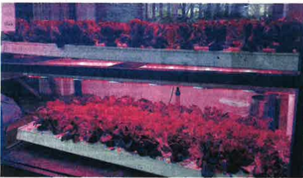
PERTANIAN bandar menerapkan penggunaan pelbagai teknik penanaman yang selamat dan bebas bahan perosak.

Ini khususnya di kawasan-kawasan yang didapati berlaku peningkatan populasi di mana dengan cara itu juga boleh menjana pendapatan alternatif.