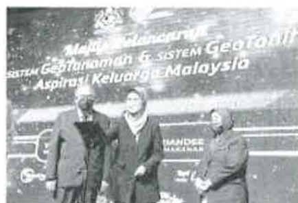
PELAKSAMA: Datuk Seri Menteri Pertanian dan Keluan M. Saifuddin bin Yusoff (tengah) bersama pegawai-pegawai MAFI dan pihak berkepentingan semasa sidang media bertajuk 'Sistem GeoTanaman & Sistem GeoTanih Aspirasi Keluaran Malaysia' di Kompleks Pejabat Tanah dan Galian, Putrajaya, Selasa (10/1/2022).

Beliau berkata, GeoTanaman dan GeoTanih adalah sistem pertanian yang berorientasikan teknologi dan berasaskan data. Sistem ini akan membantu petani untuk meningkatkan hasil dan kualiti hasil pertanian mereka dengan menggunakan teknologi geospasial.