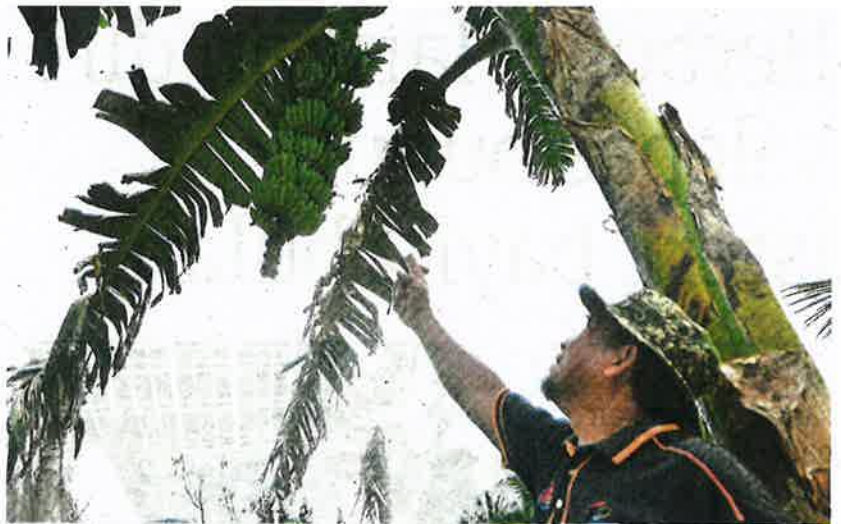
Hamsari menunjukkan pokok pisang yang mengalami serangan Moko menyebabkan kerugian kepada pengusaha di Sabak Bernam.

aktif dalam bidang pertanian, berkata antara tip kawalan jangkitan bakteria itu ialah memastikan peralatan seperti parang digunakan pada pokok pisang yang sudah terkena serangan dibasuh dengan cecair antibakteria atau dibakar bagi mengurangkan penularan.