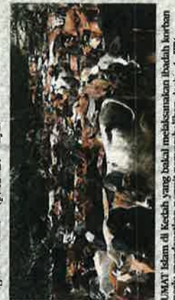
UMAT Islam di Kedah yang bakal melaksanakan ibadiah korban perlu mendapatkan permit penyembelihan daripada JPV.

"Kita memohon kerjasama semua pihak yang berhasrat melaksanakan ibadah korban membuat pendaftaran ternakan dan mendapatkan kebenaran di Pejabat Perkhidmatan Veterinar daerah setempat," katanya.