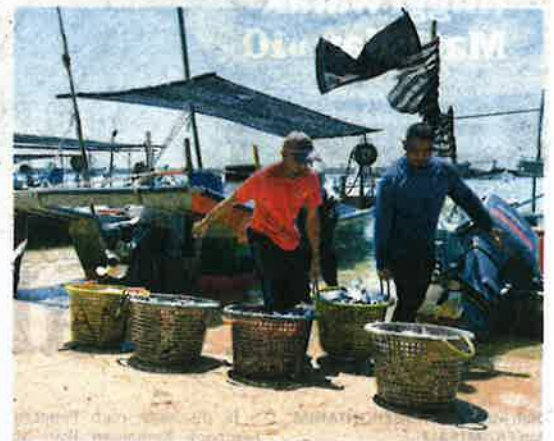
BEKALAN ikan untuk pasaran tempatan berkurang kerana kartel menjualkan sebahagian tangkapan di tengah laut. - GAMBAR HIASAN

Perkara ini bukan cakap kosong kerana ia terbukti apabila negara pernah kehilangan sejumlah RM6 bilion hasil laut negara akibat dirompak ne-