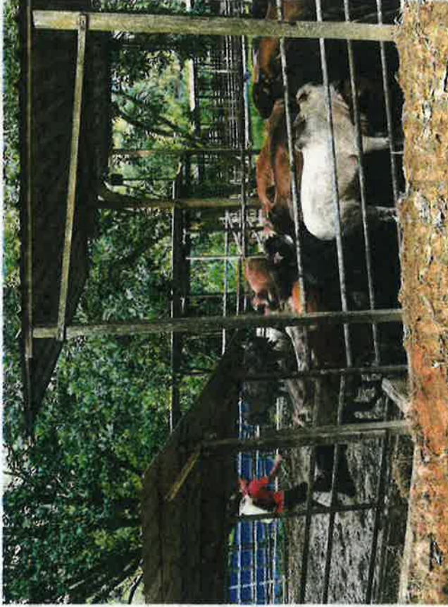
PENINGKATAN kos makanan ternakan tempatan turut menyebabkan pengeluaran ternakan terjejas

Sementara itu, JPV berkata, mengikut Perangkaan Ternakan 2020/2021, popu-