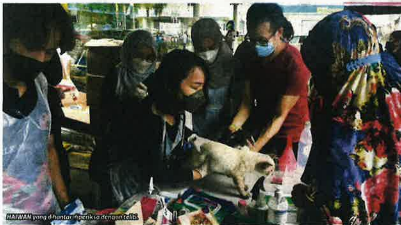
HAIWAN yang dihantar diperiksa dengan teliti.