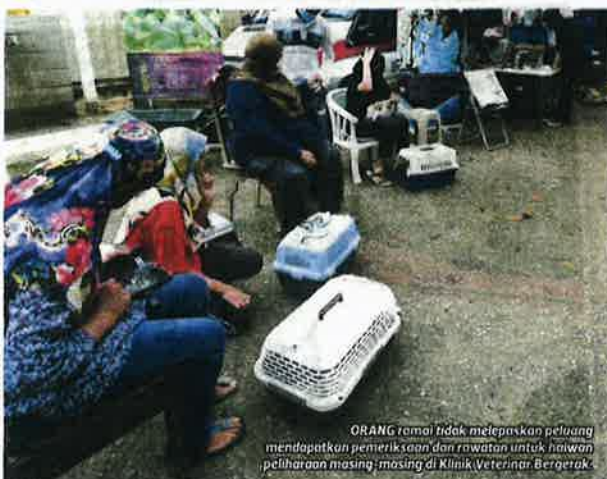
ORANG ramai tidak melepaskan peluang mendapatkan pemeriksaan dan rawatan untuk haiwan peliharaan masing-masing di Klinik Veterinar Bergerak.

"Keprihatinan mereka benar-benar memberi makna tersendiri dan semua itu menguatkan lagi semangat kami untuk terus membantu haiwan yang memerlukan," katanya.