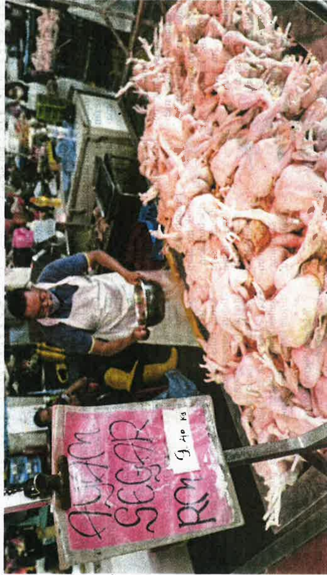
PENIAGA menjual ayam pada harga RM9.40 seperti ditetapkan kerajaan dalam tinjauan di Pasar Borong Selangor.

Kuala Lumpur: Tinjauan di beberapa pasar basah di sekitar Lembah Klang mendapati peniaga ayam segar menjual mengikut harga siling RM9.40 sekilogram.