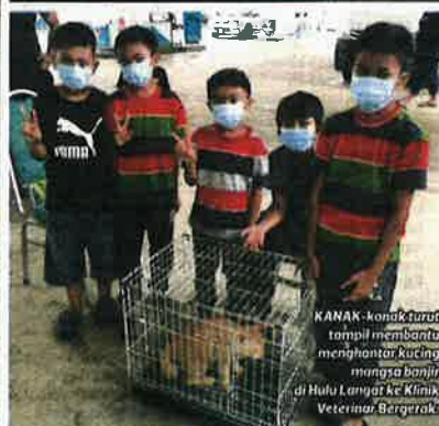
KANAK-kanak turut tampil membantu menghantar kucing mangsa banjir di Hulu Langat ke Klinik Veterinar Bergerak.