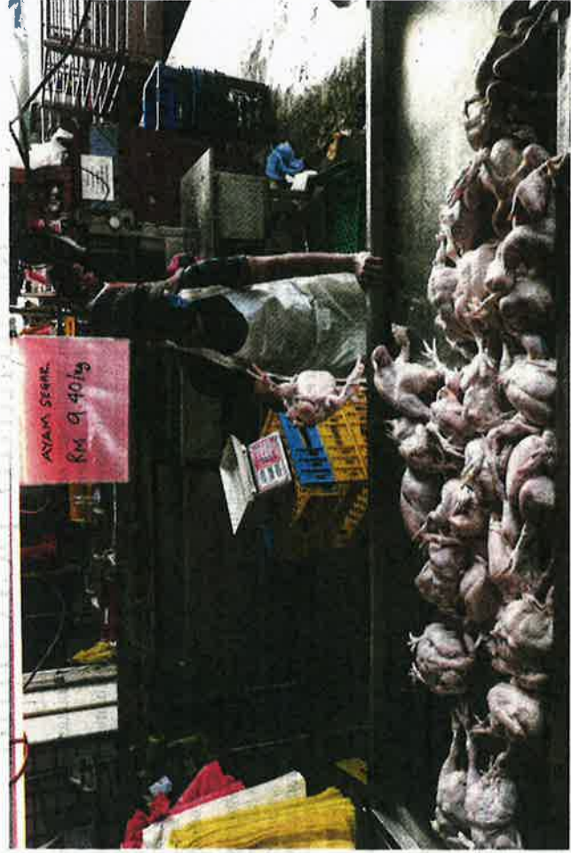
Tinjauan harga ayam yang dijual pada harga RM9.40 di Pasar Borong Selangor.

"Saya memang biasa beli di sini berbanding pasar di kawasan Ampang sebab di sana lebih mahal. Jika ikan sini RM18 sekilogram, di sana mencecah se-