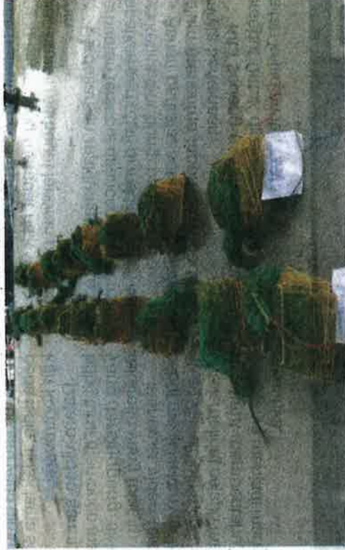
Kesemua set bubu naga yang dirampas pada Isnin dibawa ke Jeti Polis Marin Batu Uban untuk tindakan lanjut.

Menurutnya, kesemua bubu naga yang dirampas dibawa ke