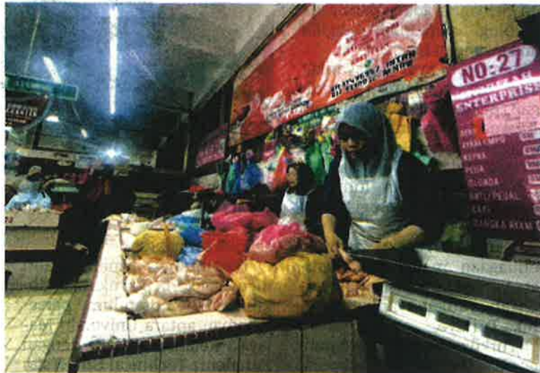
PENIAGA nafi mereka menyimpan bekalan ayam sebelum ini untuk manipulasi harga