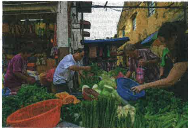
Sinergi memperkasakan sekuriti makanan negara dibangunkan untuk menjamin kelangsungan bekalan makanan yang berterusan.

syarikat kerajaan negeri berkaitan pertanian yang kemudiannya akan memajakkan tanah tersebut kepada usahawan tani untuk tempoh 30 tahun.