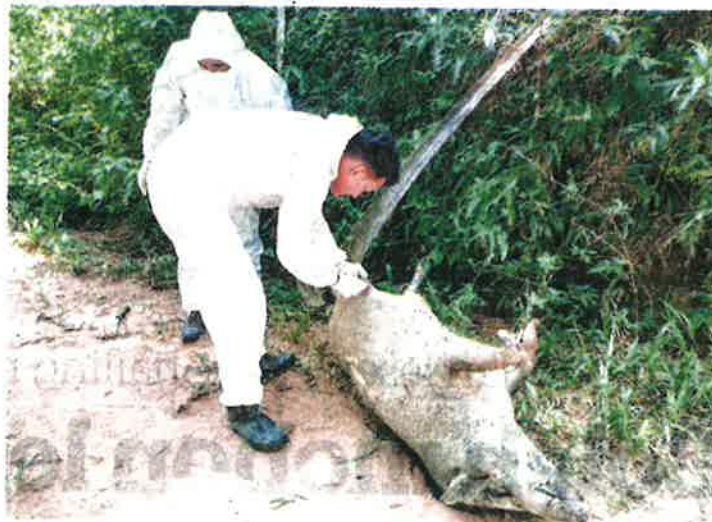
PEGAWAI JPV Terengganu memeriksa bangkai babi hutan yang disyaki mati akibat penyakit ASF di Hutan Air Putih, Kemaman baru-baru ini.

Dalam perkembangan sama, tambah beliau, pihak JPV Terengganu turut melakukan pemantauan di kesemua daerah di negeri ini sebagai langkah awal pencegahan penularan tersebut.