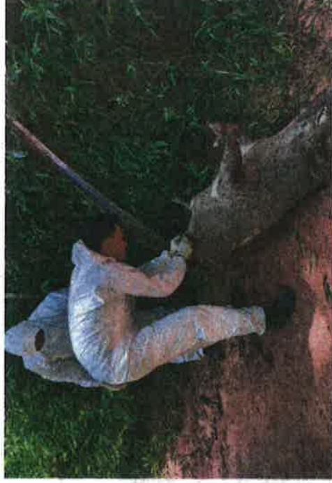
Sampel babi liar yang mati di kawasan hutan Air Putih, Kemaman diambil bagi mengenal pasti punca kematian.

"Pihak veterinar telah mengambil sampel pada bangkai haiwan berkenaan pada 21 dan 22 Jun lalu dan keputusannya ujian sampel yang diketahui pada 27