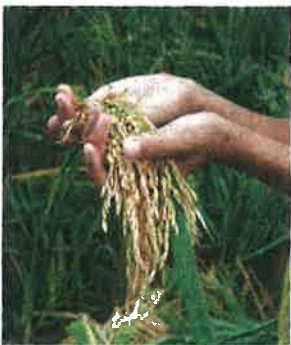
Tanah-tanah pertanian milik kerajaan negeri bakal diusahakan bagi mengukuhkan sekuriti makanan dan menjamin kos sara hidup.

"Kerajaan negeri telah bersetuju melaksanakan beberapa inisiatif, antaranya meningkatkan keluasan tanah milik negeri untuk aktiviti pertanian, memperkasakan pemberian tanah milik negeri kepada anak