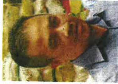
Dato' Azman Nashrudin

"Mana-mana individu yang melanggar undang-undang terbabit boleh dikenakan denda tidak melebihi RM15,000," tegas Ahli Dewan Undangan Negeri (ADUN) Lunas itu lagi.