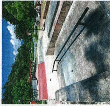
A granite skatepark has also been built at the farm academy.

In addition to fundraising for items such as building materials, beds, fruit trees, industrial wood chipper, woodwork tools, composting equipment and industrial kitchen equipment, Dignity is also looking for volunteers who can share their experience and skills.