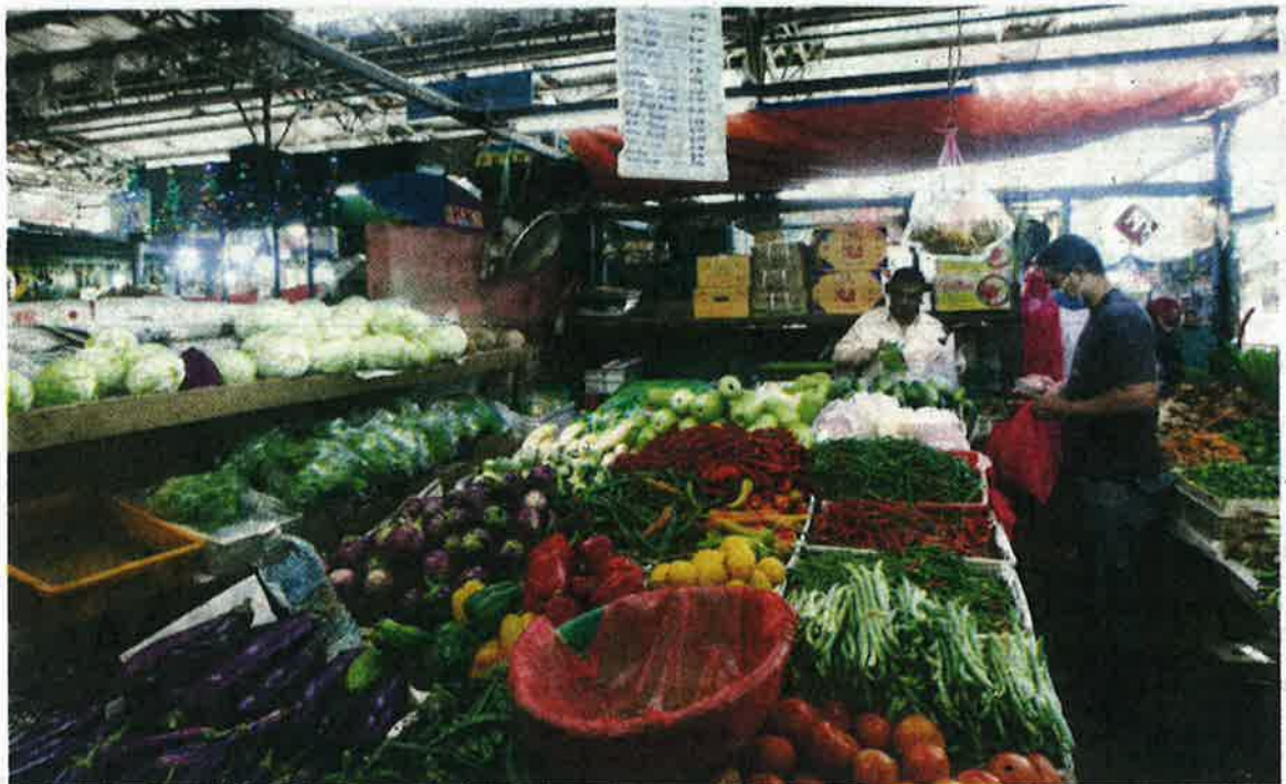
HARGA sayur-sayuran dijangka kembali stabil selepas sambutan Hari Raya Aidiladha.

Oleh Sri Ayu Kartika Amri kartika@hmetro.com.my