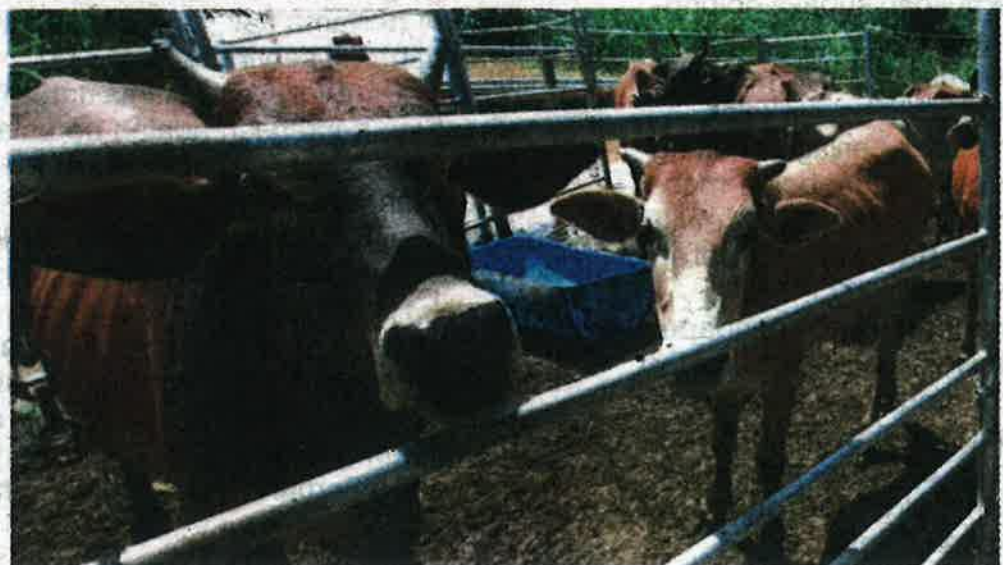
JPV Pahang mengeluarkan 621 permit sembelihan haiwan ternakan untuk ibadah korban.

"Jadi kita minta pihak yang melakukan ibadah korban diingatkan supaya sentiasa menjaga keselamatan bagi mengelak sebarang kejadian tidak diingini berlaku," ujarnya.