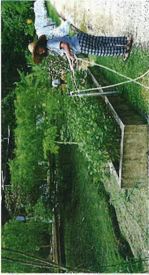
Dignity Farm Academy in Bentong, Pahang, is envisioned by its founders as an integrated learning community.

Launched on July 2, skateboarders can utilise the skatepark for a fee on weekends, which gives them a safe environment to