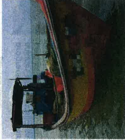
Bot nelayan yang dikendalikan dua krew ditahan selepas didapati memiliki bubu naga yang menyalahi undang-undang.

"Pemeriksaan mendapati bot berkenaan mempunyai dokumen vesel yang sah, namun memiliki 35 set bubu naga yang disyaki digunakan sebagai alat me-