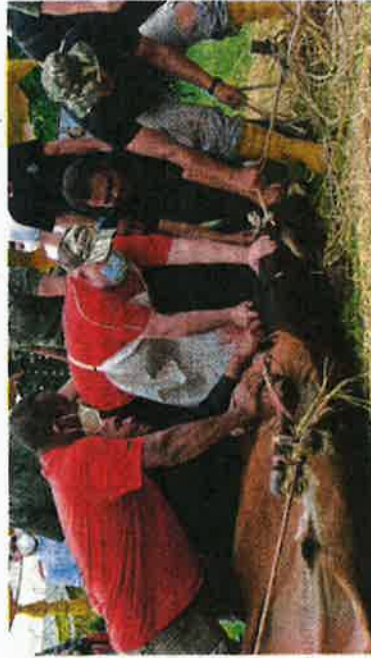
Sultan Muhammad V (dua dari kiri) berkenan menyempurnakan penyembelihan lembu pada Program Majlis Korban Jama'ie MAIK di Kota Bharu, semalam.

"Program korban ini antara inisiatif UDA meraikan keberkatan Aidiladha dan menzahirkan rasa syukur atas kelancaran serta prestasi baik permulaan serpanjang tahun lalu walaupun berhadapan dengan cabaran COVID-19," katanya.