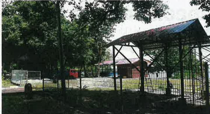
A permanent building for the turtle conservation centre is being built in Pangkor.

Nizam says the number of turtle nests have declined steeply since the conservation centre was taken over by the Perak Fisheries Department in 2021.