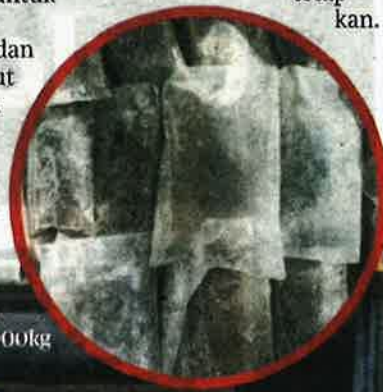
KONTENA berisi ketam sejuk beku seberat 10,000kg yang dirampas Maqis.

Mengulas lanjut, katanya, Maqis akan sentiasa memastikan tindakan penguatkuasaan undang-undang terus diperluaskan di semua pintu masuk negara bagi memantau dan memeriksa setiap keluaran pertanian yang diimport ke negara ini bebas ancaman perosak, penyakit dan bahan cemar serta mematuhi syarat dan peraturan yang ditetapkan.