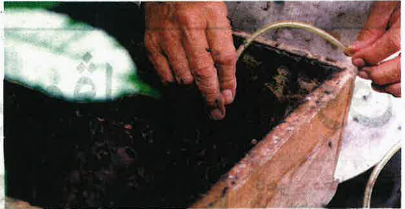
MALAYSIA merupakan negara yang sesuai untuk menternak lebah kerana kedudukan sebagai sebuah negara tropika.

Di samping itu, penggunaan racun yang keterlaluan dalam aktiviti pertanian secara umumnya juga masih berleluasa yang