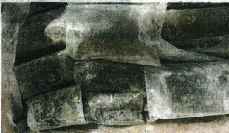
Maqis Selangor merampas ketam sejuk beku bernilai RM46,000 di Pelabuhan Klang pada Isnin lalu.

Tegas Maqis, pihaknya akan sentiasa memastikan tindakan penguatkuasaan undang-undang terus diperluaskan di semua pintu masuk negara.