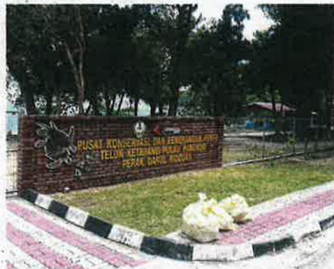
The turtle conservation and information centre is now managed by the state Fisheries Department.