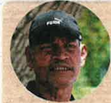
Rasli says local fishermen had been providing fresh food for the turtles.

fenced up the area, there is no one to monitor the place at night, when turtles usually come to the beach to lay their eggs.