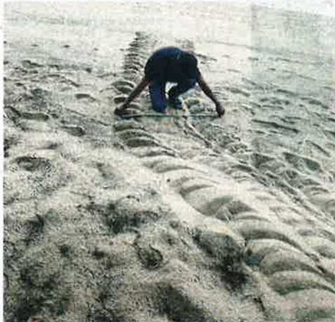
A trail left by nesting turtles at Teluk Ketapang being measured.