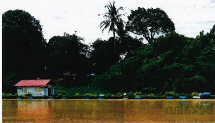
SANGKAR ternakan ikan yang diusahakan warga Kemboja di Sungai Perak ketika tinjauan di Parit, baru-baru ini.

bagai makanan ikan membolehkan mereka jimatkan kos, tetapi ini menyebabkan pencemaran sungai dan bau yang busuk.