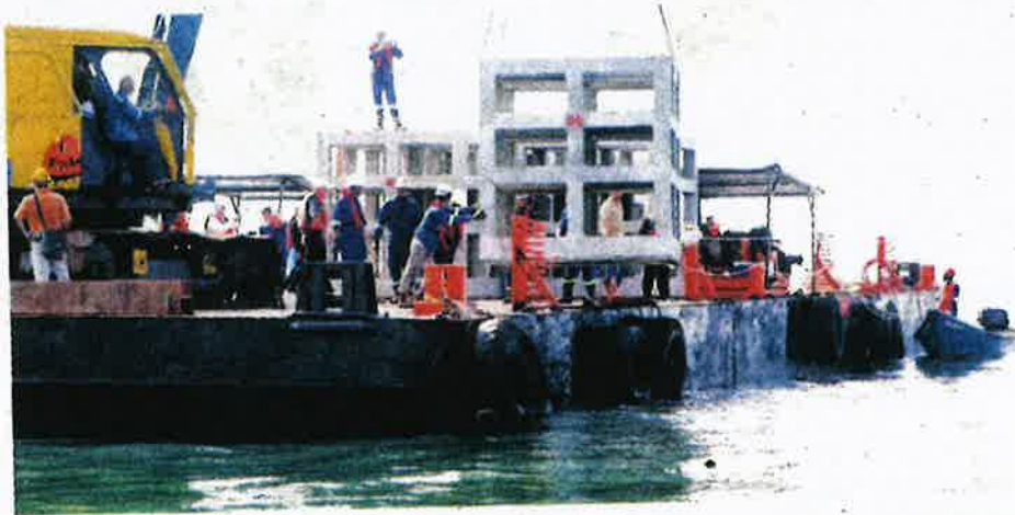
SEBANYAK sembilan tukun tiruan diturun di Pulau Nangka, Melaka semalam.

Mengulas lanjut mengenai pewartaan beliau berkata, ketiga-tiga pulau itu akan dilindungi di bawah Seksyen 41, Akta Perikanan 1985 (Akta 317).