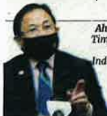
Ahmad Hamzah, Timbalan Menteri Pertanian dan Industri Makanan

“Ia akan memberi impak bukan saja dapat melindungi habitat di kawasan itu, malah mampu menambah tahap sara diri (SSL) perikanan negeri”