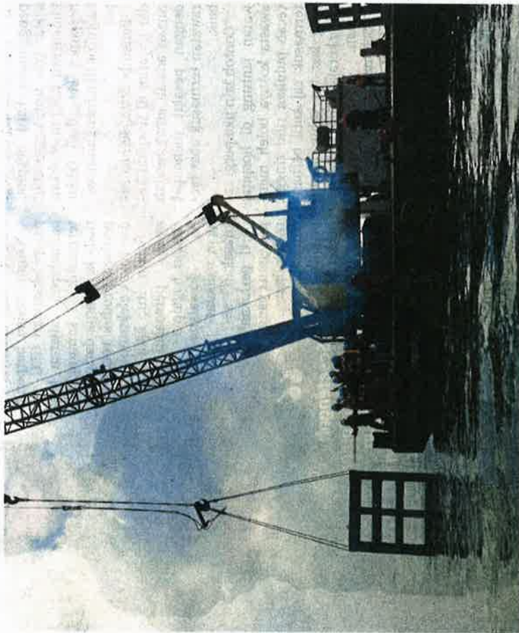
PROSES melabuhkan tukun tiruan konkrit di perairan Pulau Nangka.

Sementara itu, beliau berkata, RM300,000 diperuntukkan untuk sembilan unit Tukun Tiruan Konservasi yang dilabuhkan di kawasan Taman Laut Pulau Nangka.