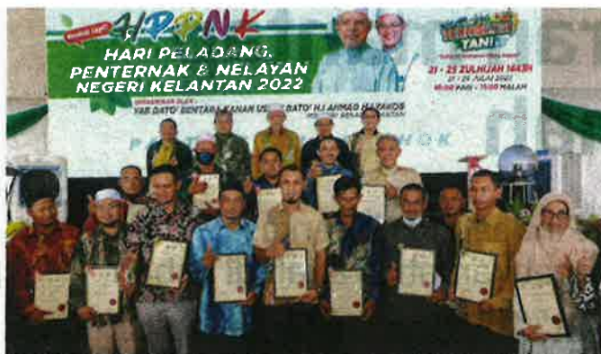
Menteri Besar bersama penerima anugerah sempena sambutan Hari Peladang.