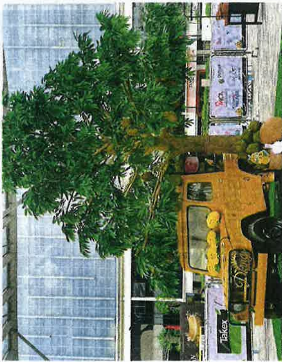
Several varieties of durians were showcased at the festival.

Tourism group: Hold event annually to tap tourists' love for fruit