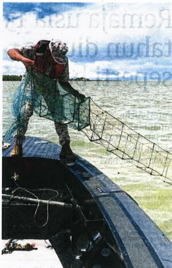
Anggota Maritim Malaysia Zon Perlis menarik keluar set bubu naga yang ditemui di sekitar perairan Perlis.