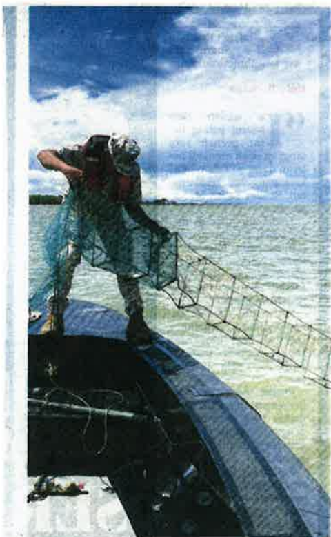
ANGGOTA APMM Zon Maritim Kuala Perlis merampas bubu naga di 0.3 batu nautika dari perairan Pulau Ketam, Kuala Perlis.