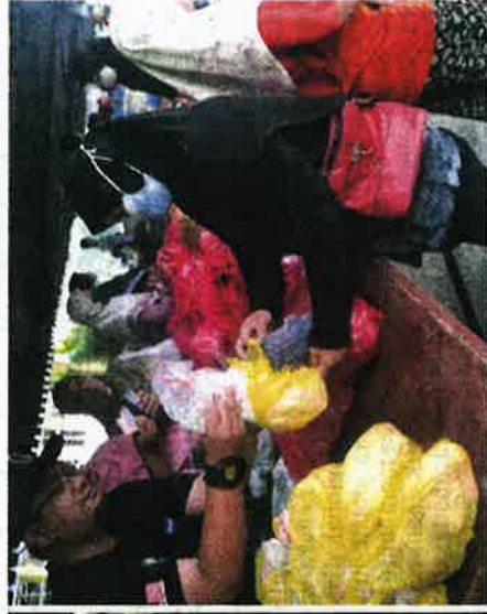
Orang ramai tidak melepaskan peluang membeli ayam yang dijual dengan harga RM6.50 sekilogram, semalam.

"Alhamdulillah, sambutan orang ramai amat menggalakkan dan kami tidak menghehalkan jualan hanya untuk B40, sebaliknya golongan berpendapatan sederhana juga diberi peluang membeli 'Insya-Allah program seperti ini akan diadakan lagi pada ma-