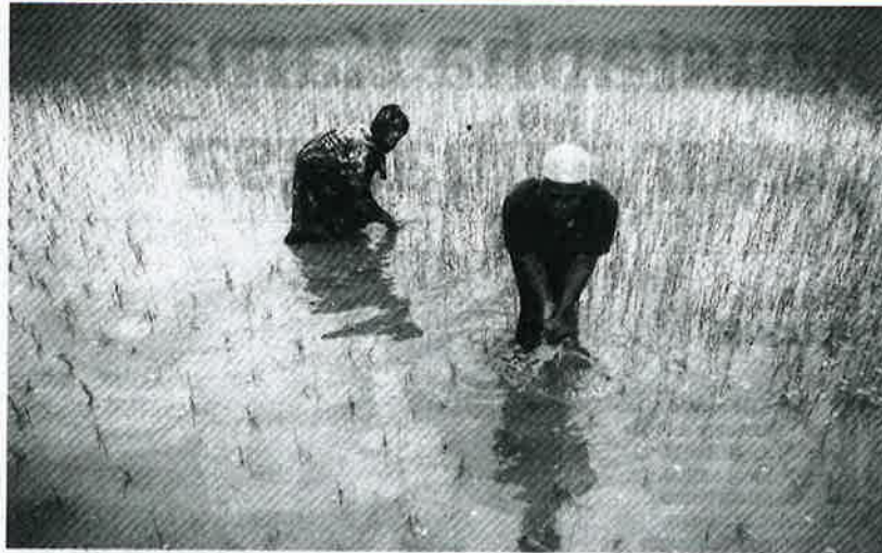
AMAT munasabah menawarkan pencen sebanyak RM500 sebulan untuk setiap pesawah yang mencapai umur 60 tahun. - GAMBAR HIASAN