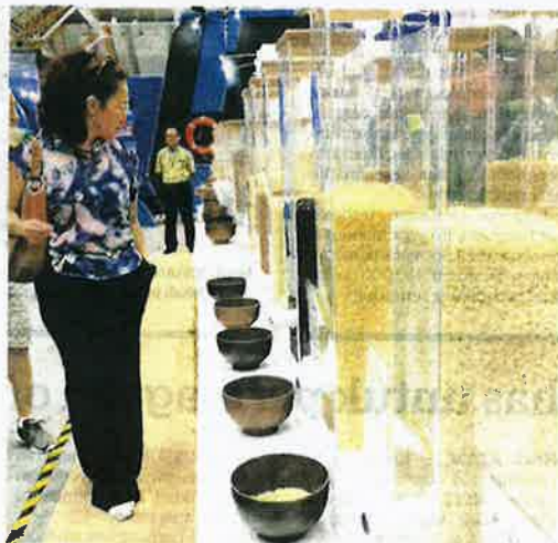
SEBAHAGIAN pengunjung melihat pameran beras dari pelbagai negara yang dibawa oleh Bernas bersempena MAHA 2022 di MAEPS Serdang.

"Antara pertandingan yang bakal dianjurkan oleh Bernas adalah Teeka Berat Beras?, Chop 'til you drop!, No Pain No Grain, Pertandingan Badang Bernas, Rice Click dan Sup-rice!" kata Bernas dalam satu kenyataan se-