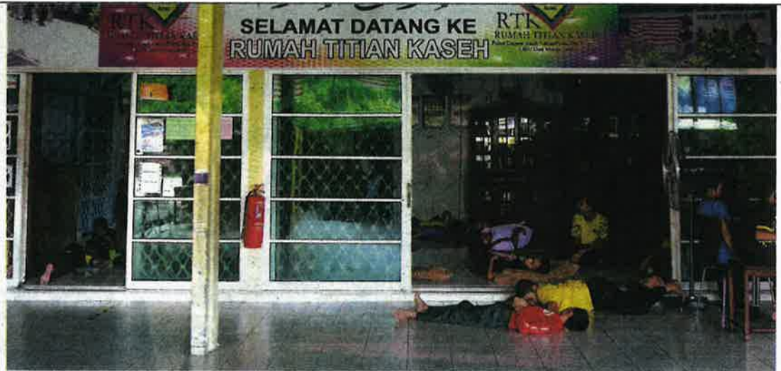
RUMAH Titian Kaseh menjana pendapatan sendiri menampung perbelanjaan bulanan rumah kebajikan terletak di Tasik Titiwangsa.

Mengenal rumah berkenaan melalui bekas majikannya yang juga tokoh politik, Allahyarham Tan Sri Sanusi Junid yang sering berkongsi rezeki bersama mereka membuatkan dia turut terinspirasi untuk melakukan hal yang sama.