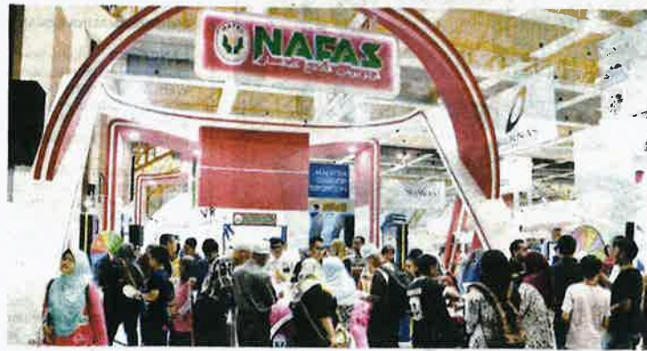
PAVILION NAFAS ketika MAHA 2022 meriah dengan kehadiran orang ramai di MAEPS, Serdang.

"Selain bar emas, pengunjung juga berpeluang memenangi telefon bimbit, basikal lipat, tablet, seterika stim, televisyen