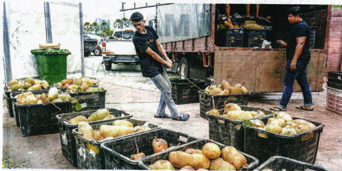
PETUGAS giat melakukan persiapan akhir semalam di Castle of Fruits, MAEPS di Serdang sempena MAHA 2022 yang bermula hari ini.

Pameran 11 hari di MAEPS tumpu pertanian tempatan