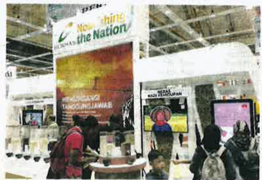
RUANG pameran Bernas di MAHA 2022 terletak di Dewan A, MAEPS, Serdang.

"Pemenang akan membawa pulang RM1,000 bagi tempat pertama, RM750 tempat kedua,