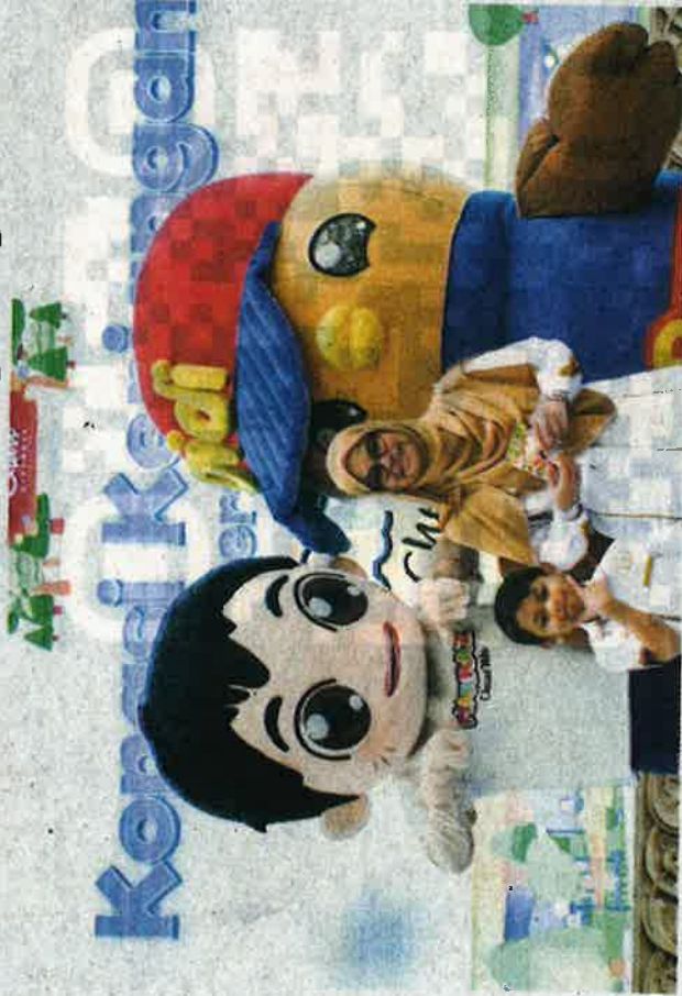
HASZLLILA bersama produk makanan kanak-kanak Harraz Chew Me iaitu gula-gula separa kenyal yang mudah dimakan.

Hasz Trading juga membekalkan ayam kampung segar berjenama Ayam Kampong Harraz yang dipasarkan di seluruh Malaysia.