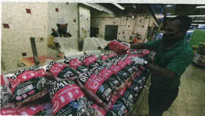
Market supply: An employee arranging frozen chicken at Mydin Hypermarket in Bukit Jambul.

"The high price of chicken feed like soy and corn as well as other raw materials is among factors leading to the high cost of rearing chickens.