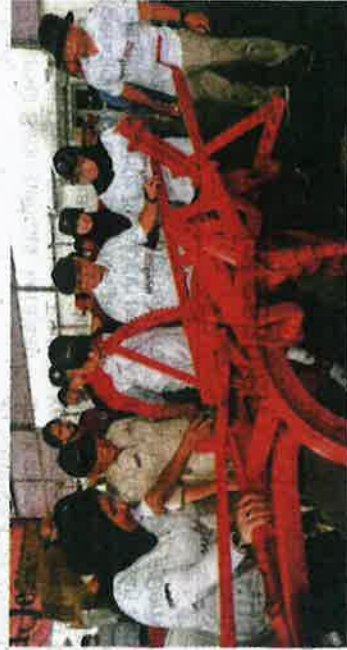
Nafas turut terlibat sama di Laman Mekanisasi yang dimeriahkan dengan aktiviti serta mempamerkan jentera dan produk keluarannya.