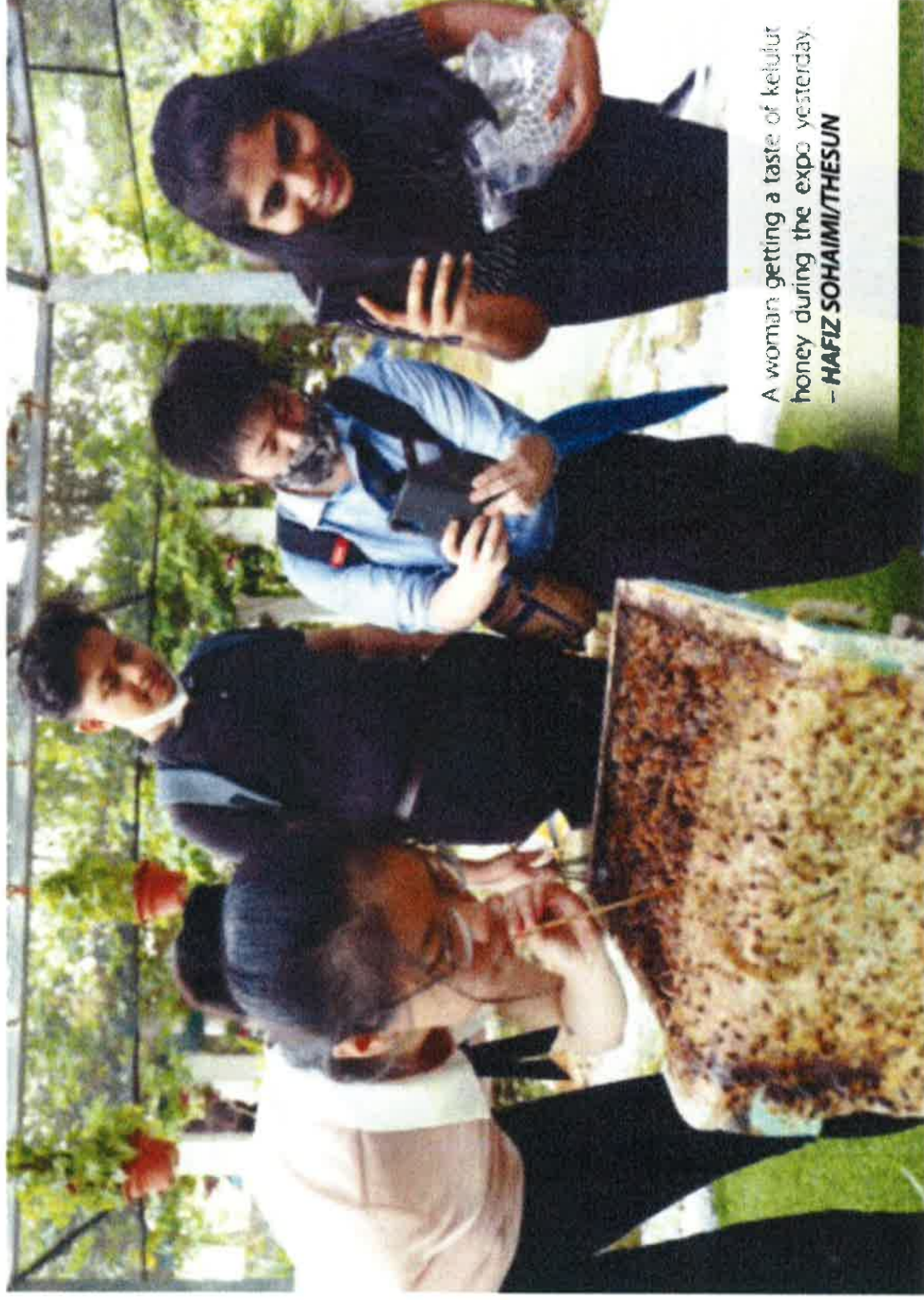
A woman getting a taste of kelulut honey during the expo yesterday. - HAFIZ SOHAIMI/THE SUN

Apart from the pavillion, he said Nafas is also involved in several other sections at the Machinery Site, Padi Site and Agro-edutainment Site. - Bernama