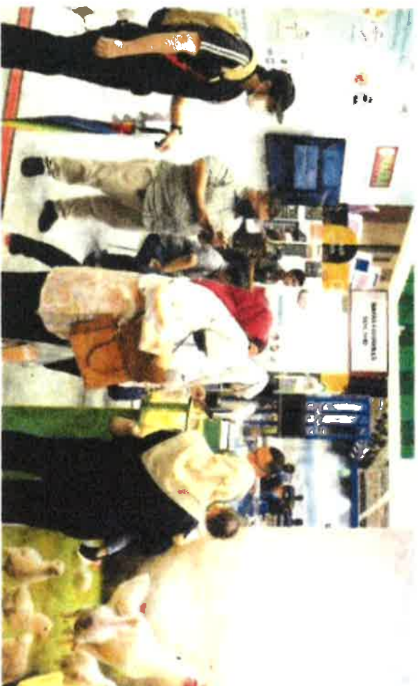
Gelagut orang ramai yang mengunjungi Pavillion Nafas sempena MAHA 2022 di Maeps, Serdang pada Jumaat.