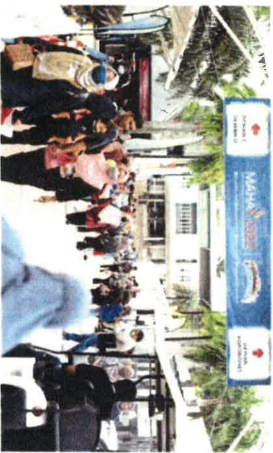
Orang ramai mengunjungi Pameran MAHA 2022 di MAEPS, Serdang, semalam.