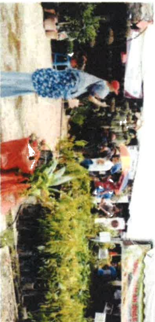
Pengunjung mengambil peluang singah ke Castle Of Fruits bagi melihat pokok jualan seperti buah-buahan, sayur-sayuran dan florikultur di MAHA 2022.

kenalkan nangka sebagai 'super-food' di Malaysia kerana banyak khasiatnya dan pelbagai produk berasaskan nangka juga semakin banyak di pasaran seperti kerpek nangka, menjadikan buah ini semakin mendapat permintaan di dalam dan luar negara.