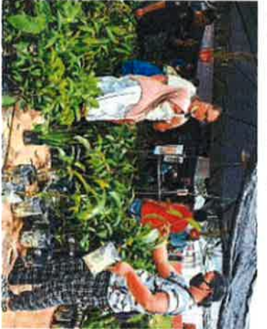
民衆在展覽會上參觀花卉展區。(馬新社區)