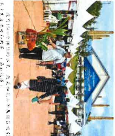
不少民衆參與和研學。

此外，現場亦設有「加 展區，讓農民可以將自己 的各種水果、節節、和各種 的DIY手工藝、