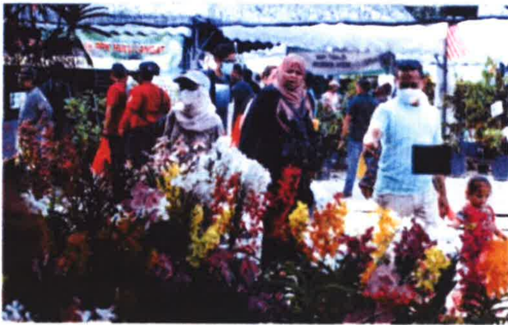
Orang ramai mengunjungi MAHA 2022 di Taman Ekspo Pertanian Malaysia Serdang, semalam.