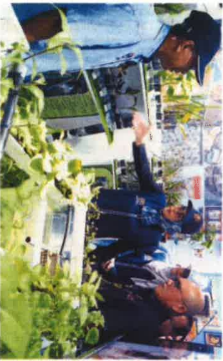
农业及食品工业部长拿督斯里罗建德博士 (右起) 及园艺科科长拿督哈兹姆 (左) 参观马六甲的展览。园艺及农产品展 (MAHA) 由雪兰莪州主办。

为期 11 天的展会主题为“未来农业 20 个重要配对，100 个小型企业/分享家/1500 个展位和销售额”。此外，预计设有 1500 个展位和销售额，以及 13 个州属展览馆，且具备各种特殊及外，还展示各州的特色，包括文化艺术、旅游景点、产品及食品。展览上还将进行超过 20 个重要配对，100 个小型企业/分享家/1500 个展位和销售额。