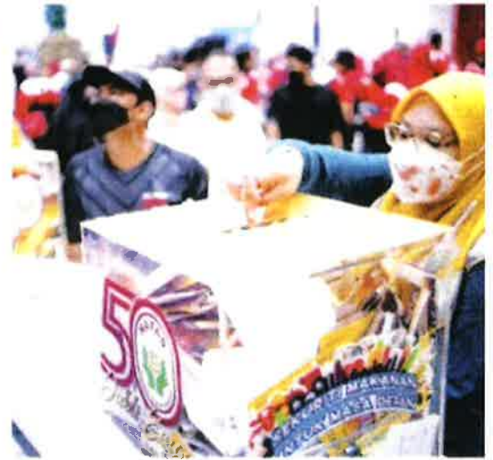
KOTAK penyertaan Peraduan Jawab dan Menang mendapat pe-pengunjung di MAHA 2022.