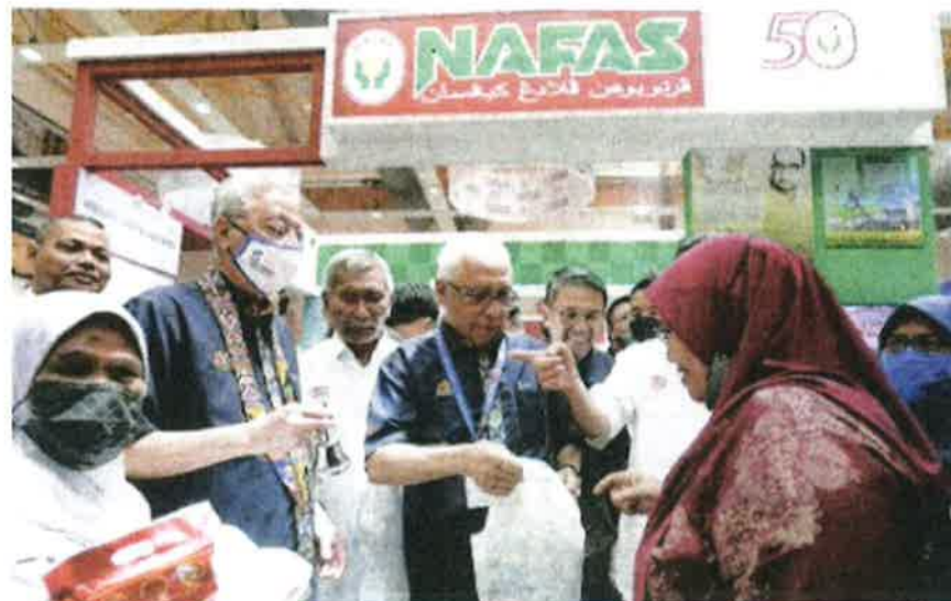
Dana Menteri, Datuk Seri Ismail Sabri Yaakob (depan, dua dari kiri) ketika melawat reruai Nafas di MAHA 2022, Maeps, Serdang.

"Produk-produk ayam bawa kerana kita tahu itu makanan popular di Malaysia. Jadi kita bertekad program ini akan dapat dijalankan dengan banyak lagi penyertaan pempamer," jelas