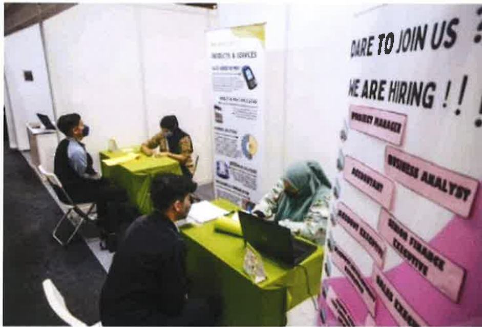
Youths apply for jobs at a company booth set at the Agro Job Fair held in conjunction with Maha 2022.