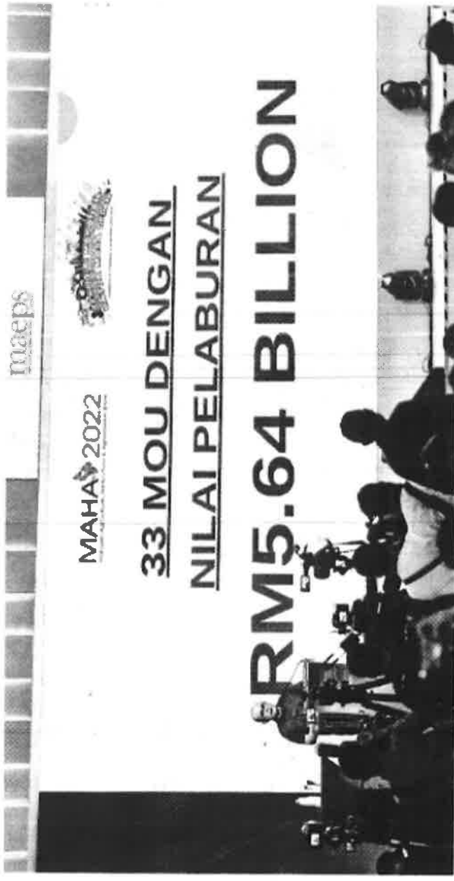
AMANAT... Menteri Pertanian dan Industri Makanan Datuk Seri Dr. Ronald Kiangde menyampaikan ucapan pada majlis penutup sempena Pameran Pertanian, Hortikultur dan Agropelancongan Malaysia (MAHA) 2022 di Taman Ekspo Pertanian Malaysia (MAEPS), semalam.