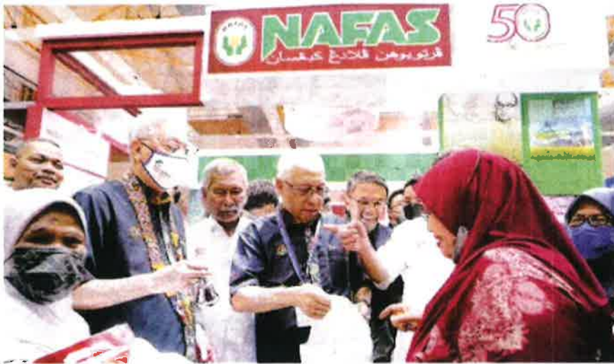
NA Menteri, Datuk Seri Ismail Sabri Yaakob membantu menjual ayam di gerai pameran NAFAS di MAHA di MAEPS, Serdang baru-baru ini.