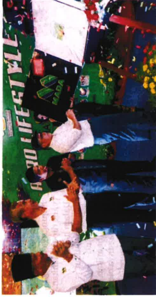
LEMBAGA Kemajuan Pertanian Muda (MADA) mencatat jumlah jualan keseluruhan sebanyak RM197,080 sepanjang penyertaannya dalam Pameran Pertanian, Hortikultur dan Agropelancongan (MAHA) 2022.

"MADA juga ada menjemput lima orang usahawan yang terlibat dengan kluster Agro Business, produk-produk mereka dibawa