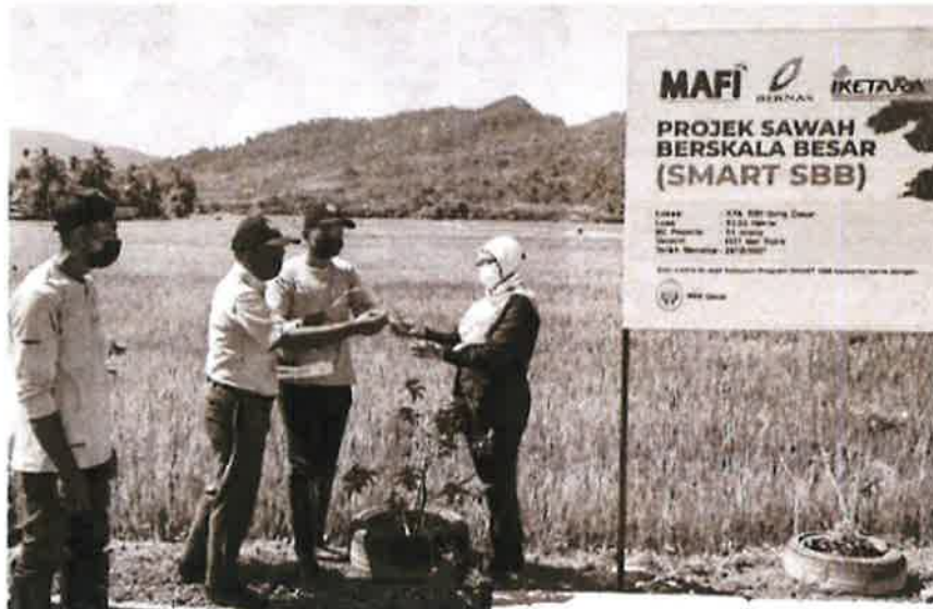
SMART SBB merupakan inisiatif kerajaan untuk meningkatkan hasil pendapatan pesawah dengan menyelaraskan sistem pengurusan ladang secara berkelompok bagi mencapai skala ekonomi.

“ BERNAS kini mempunyai peranan penting dalam menjamin keselamatan makanan negara.”