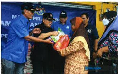
MAFI, FAMA committed to hold JMKM nationwide