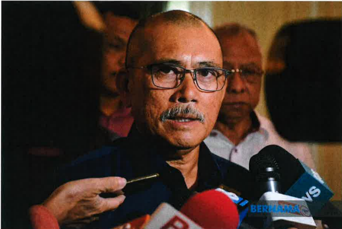
© Bernama/Photo by Bernama/Ministry of Agriculture, Food and Rural Affairs, Kuala Lumpur, 18/09/2022 (Bernama/Photo by Bernama)