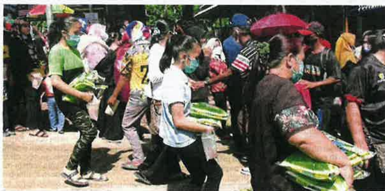
Pengunjung tidak melepaskan peluang membeli beras yang dijual RM1 sekilogram.

"Pembangunan rangkaian pemasaran kekal bagi memudahkan urusan antara usahawan dan pengunjung serta pihak berkuasa tempatan.