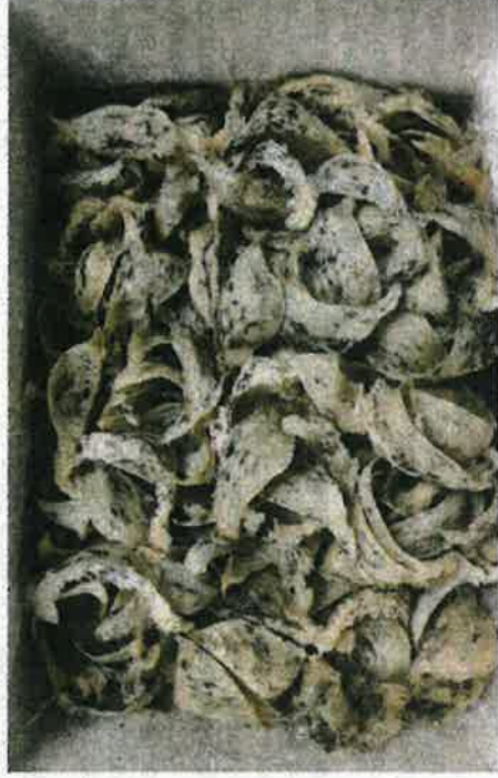
15 kotak berisi sarang burung walet yang cuba dieksport ke Vietnam.

"Pihak Maqis sentiasa bersedia dalam melakukan tugasan di semua pintu masuk negara bagi memastikan komoditi haiwan, pertanian, ikan yang masuk atau keluar dari Malaysia mematuhi syarat serta peraturan yang ditetapkan bagi memastikan keselamatan makanan terjaga," jelasnya.