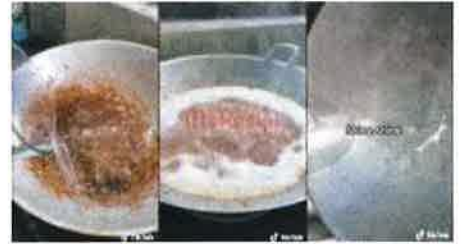
Susah Nak Tanggalkan Kerak Kuala Lumpur? Ikut Tips Ini Pasti Menjadi