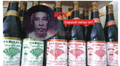
Ini Sebenarnya Kisah Sejarah Kicap Cap Kipas Udang, Ramai Orang Tak Tahu