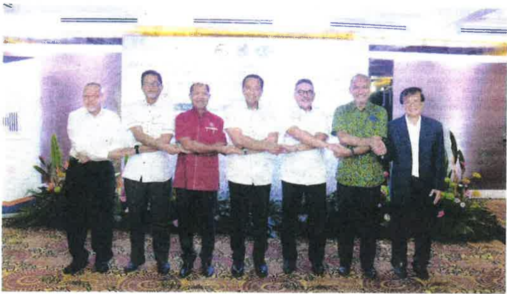
MENTERI Besar Terengganu, Datuk Seri Ahmad Samsuri Mokhtar (tengah) melancarkan projek pembangunan hidrokuasa kecil berkapasiti 2.85 megawatt di Besut baru-baru ini. Projek itu dilaksanakan Domainedge Sdn. Bhd., syarikat tujuan khas di bawah usahasama syarikat milik kerajaan negeri, MBI Modal Sdn. Bhd. dan TelTech Padu Berhad serta Inter Global Hydro Sdn. Bhd.