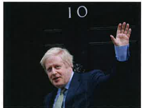
Calon PM Britain: Johnson sudah ada 100 sokongan