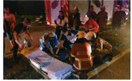
Bas persiaran berlanggar, tiga parah