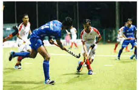
India benam Malaysia aksi Piala Sultan Johor

Untuk pengetahuan korang, program yang berlangsung selama tiga hari di Tapak Pasar Tamu Telupid ini diisi dengan pelbagai aktiviti menarik seperti Karnival My Best Buy Keluarga Malaysia, Kenduri Rakyat, Karnival Sukan Rakyat dan lain-lain lagi.