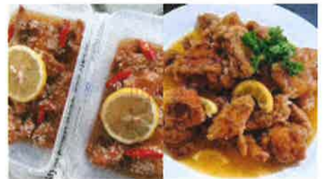
Cara Buat Ayam Lemon Ala Chinese Style, Anak-anak Mesti Makan Bertambah!