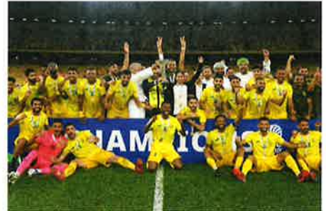
'Kami tewas kerana kesilapan sendiri'