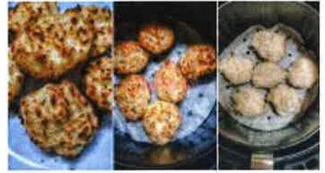
Sedapnya Bingka Kelapa, Kuih Tradisional Yang Makin Susah Nak Jumpa