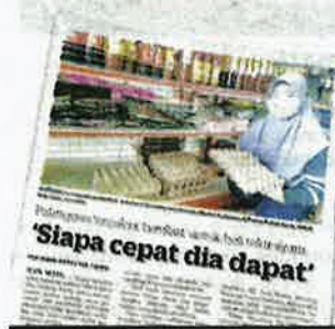
KERATAN Kosmo/19 Oktober 2022.

biji telur dianggarkan 51 sen sebiji dan harga kawalan ditetapkan mengikut gred kira-kira 41 sen.