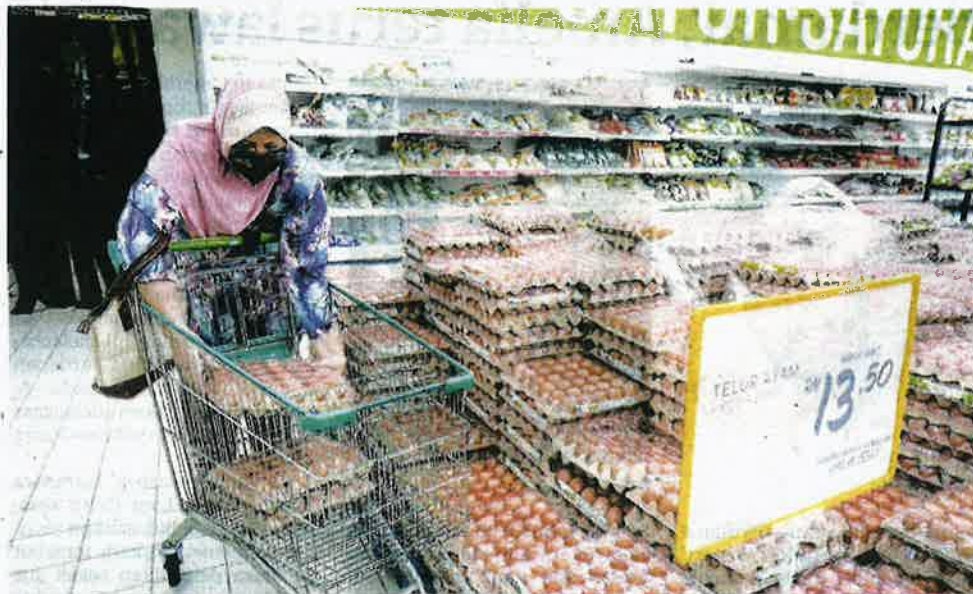
GANGGUAN bekalan telur didakwa berlaku sejak seminggu lalu sehingga meresahkan pengguna dan peniaga.

"Keadaan itu menyebabkan penternakan ayam yang akan bertelur akan mengambil masa sehingga menyebabkan kekurangan bekalan telur sehingga 100,000 biji sebulan," ujarnya.