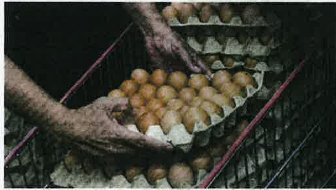
MESYUARAT Jawatankuasa Teknikal Pasukan Khas Jihad Tangani Inflasi minggu lalu memaklumkan bekalan telur ayam semakin meruncing.

"Masih ada 'gap' (beza) dua sen yang menyebabkan pengeluar telur tidak berminat untuk mengeluarkan telur berasaskan permintaan yang diperlukan," katanya pada sidang media, semalam.