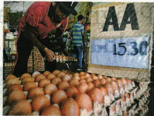
Peniaga menyusun telur dalam tinjauan di Pasar Borong Selangor, Seri Kembangan, semalam.

Annuar Musa, Pengerusi Pasukan Khas Jihad Tangani Inflasi