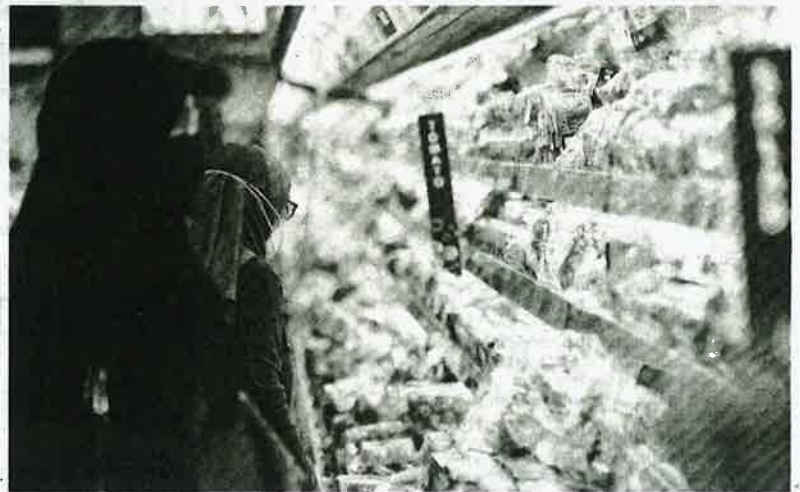
MALAYSIA bergantung tinggi kepada import makanan dan juga import bahan mentah.

Gambar rajah di bawah dapat memberi gambaran strategi yang telah dilakukan