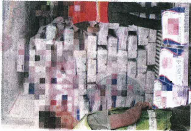
Pegawai Maqis melakukan pemeriksaan pada kontena yang membawa muatan daging lembu sejuk beku dari Brazil.

BUTTERWORTH - Jabatan Perkhidmatan Kuarantin dan Pemeriksaan Malaysia (Maqis) Pulau Pinang merampas 120 kotak atau 3,000 kilogram (bersamaan tiga tan) produk lembu sejuk beku yang diimport dari negara Brazil di Pelabuhan Pangkalan Kontena Utara Butterworth (NBCT), di sini pada Khamis lalu.