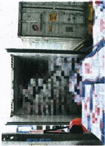
MAQIS sita 120 kotak ekor lembu dari Brazil di Pelabuhan Pangkalan Kontena Utara Butterworth (NBCT).

Menurutnya, Maqis sentiasa melakukan pemeriksaan keluaran pertanian di setiap pintu masuk negara bagi memastikan tumbuhan, haiwan, karkas, ikan, keluaran pertanian dan mikroorganisma yang diimport ke dalam negara bebas ancaman perosak, penyakit dan bahan cemar serta mematuhi syarat dan peraturan yang ditetapkan kerajaan.