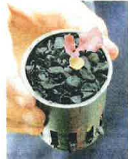
BIOCHAR ini dihasilkan daripada proses pembakaran sisa pertanian dan hutan.

"Kebalkan biochar telah terbukti berdasarkan kajian-kajian yang kami jalankan. Melalui amalan pertanian yang baik,