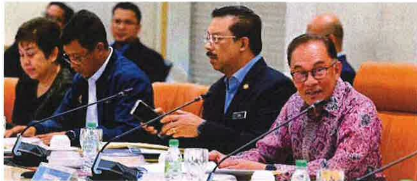
Anwar mempengerusikan Mesyuarat Khas Majlis Tindakan Sara Hidup Negara di Bangunan Perdana Putra, semalam.