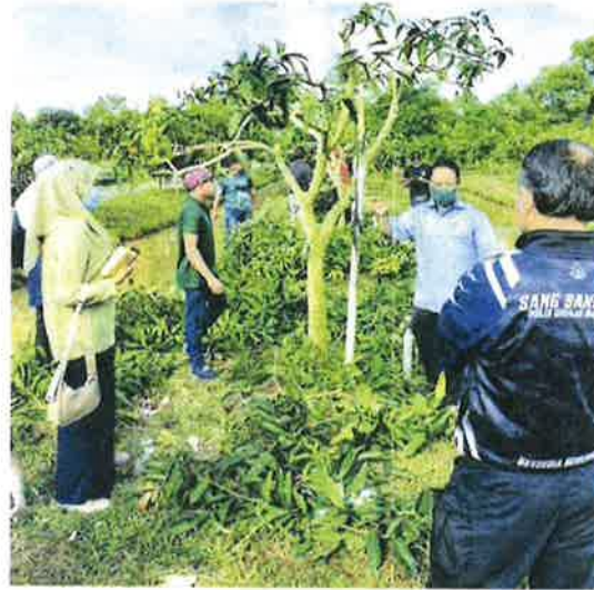
PARA peserta bengkel turut didedahkan dengan teknik memangkas pokok harumanis dengan betul oleh pihak MARDI.

teknik memangkas pokok harumanis dengan betul. Hal ini kerana ia memberi kesan kepada pertumbuhan pokok dan penghasilan bunga.