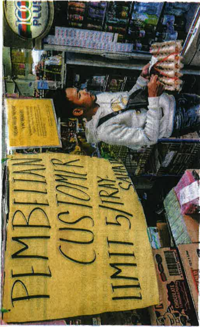
BEKALAN telur masih berkurangan dalam satu tinjaian yang dilakukan di sektor Chow Kit, Kuala Lumpur serantau.

"Saya difahamkan, pengusaha di peringkat ladang ada membangkitkan isu kos pengeluaran yang semakin meningkat, namun ia sudah diseimbangkan dengan agihan subsidi," katanya kepada pemberita selepas menyempurnakan Program 'Sihat Ke Saya di sini semalam.