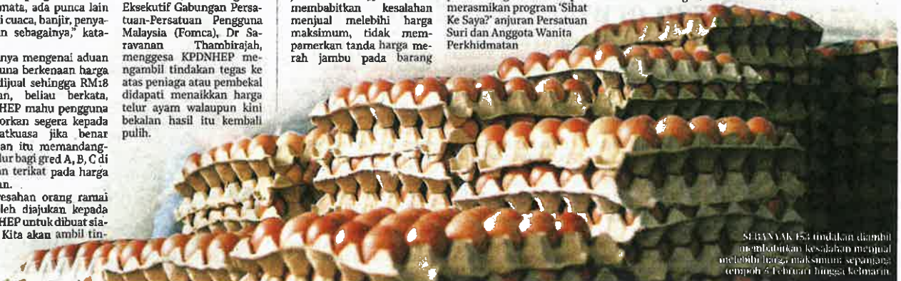
SEBANYAK 153 tindakan diambil membabitkan kesalahan menjual melebihi harga maksimum sepapan tempoh 5 Februari hingga kelmarin.

Baru-baru ini tular di laman media sosial mengenai bekalan telur ayam kembali pulih di pasaran namun dijual pada harga yang tinggi selain dikaitkan dengan kewujudan kartel telur ayam yang memanipulasi bekalan terbabit.