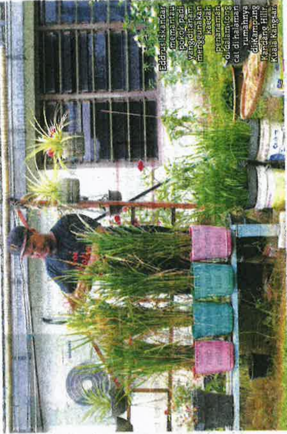
Eddrus Iskandar meminati pekelip padi yang ditanam menggunakan kaedah penanaman di dalam tong cat di halaman rumahnya di Kampung Hilir, Kuala Kangsar.

cat adalah mudah kerana tidak memerlukan banyak peralatan selain tidak perlu risau kehadiran haiwan perosak. "Anggaran secara kasar, 20 pasu atau tong cat padi boleh mengisi perut sebuah keluarga yang mempunyai tiga hingga empat orang anak untuk keperluan sebulan," ujarnya.