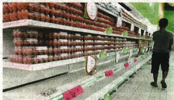
BEKALAN telur ayam 30 biji sepapan tiada di rak telur sebuah pasar raya ketika tinjauan di Johor Bahru.

"Begitu juga dengan minyak masak paket, kita tempah banyak tetapi yang sampai hanya 2,000 paket sahaja. Kita akan keluarkan semua, biasa dalam empat hari pertama selepas bekalan tiba akan habis dijual. Itu pihak kami telah hadkan pembelian kepada tiga paket seorang," katanya.