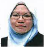
Pegawai Penyelidik Kanan Pusat Kajian Sains Dan Alam Sekitar, Institut Kefahaman Islam Malaysia (IKIM)

• Perlu reformasi tanah pertanian, penternakan, guna teknologi pintar berskala besar dan latih tenaga muda dalam program agromakanan