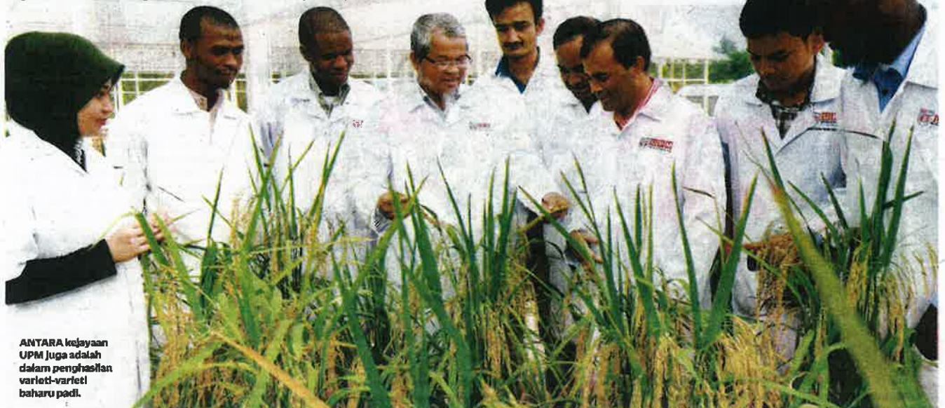
ANTARA kejayaan UPM juga adalah dalam penghasilan varieti-varieti baharu padi.

"Graduan UPM sebenarnya secara langsung dapat membantu ekonomi negara serta memodenkan pertanian dengan adanya pengetahuan serta berpendidikan terutama dalam penggunaan teknologi moden pertanian yang membawa pertanian negara ke seantero dunia," ujarnya.