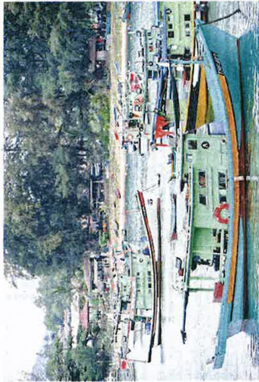
SEBAGIAN daripada bot nelayan yang 'terkandas' dan tidak dapat keluar untuk tangkapan ikan pada musim tengkujuh di Terengganu.