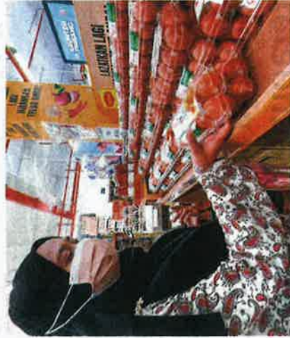
SEORANG pelanggan melihat bekalan telur ayam omega di sebuah pasar raya di Bandar Gua Musang, Kelantan, semalam.

"Bagi kami yang berkeluarga atau mempunyai bilangan anak ramai, telur sumber makanan asas kami," katanya. Sebelum ini, bekalan telur ayam di beberapa negeri dilaporkan kembali stabil namun harganya kini meningkat sehingga mencecah RM18 sepapan bagi telur gred A.