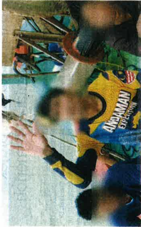
TIGA lelaki warga Myanmar ditahan pihak berkuasa di perairan Kuala Selangor kelmarin.