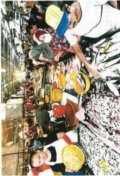
Tinjauan di Pasar Chow Kit, Kuala Lumpur, mendapati harga barangan basah alami kenaikan berikutan bekalan yang sukar diperolehi