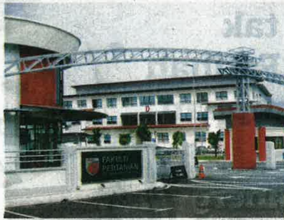
FAKULTI Pertanian di UPM banyak berjasa dalam melahirkan graduan-graduan pengkhususan pertanian.