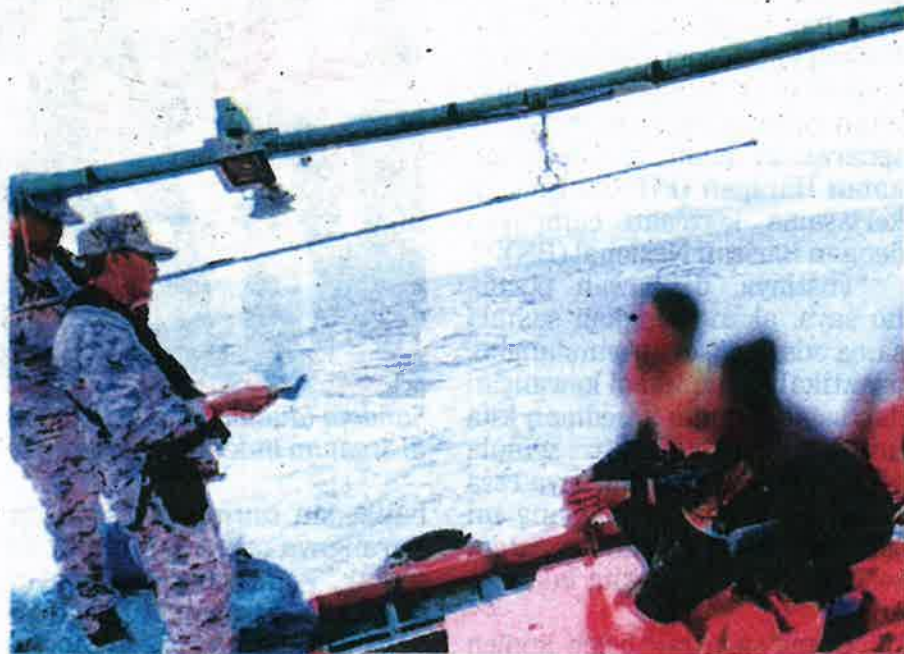
Anggota APMM Selangor memeriksa tiga nelayan warga asing di kedudukan 3.1 batu nautika Kuala Selangor, semalam.

Sebarang aduan dan maklumat mengenai kegiatan jenayah serta kecemasan di laut, orang ramai boleh menghubungi Pusat Operasi Maritim Negeri Selangor di talian 03-31760627 atau MERS 999.