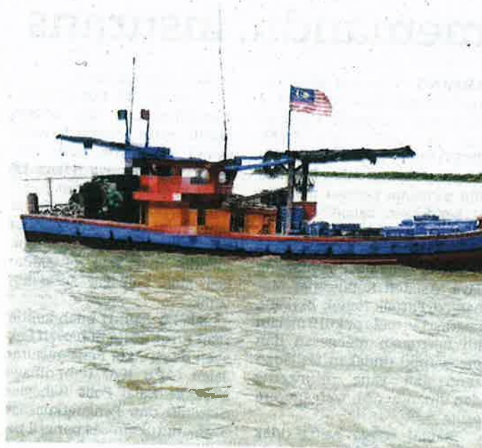
BOT dinalki tiga nelayan yang ditahan di Tanjung Piandang, Bagan Serai kelmarin.

Sebarang aduan dan keceemasan, orang ramai diminta supaya melaporkan kepada APMM menerusi MERS 999 atau Pusat Operasi Zon Maritim Kuala Kurau di talian 05-7279919 .