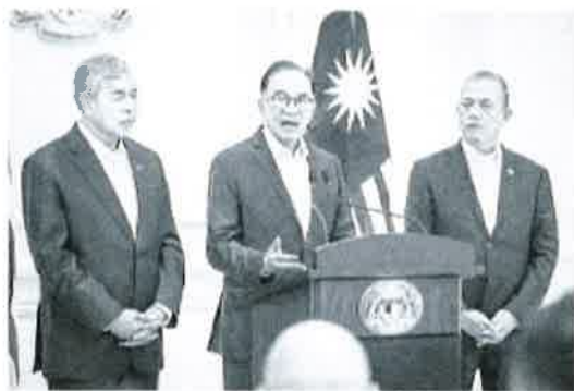
SIDANG MEDIA. Anwar pada sidang media di Perdana Putra semalam. Dari kiri: Menteri Kanan, Datuk Seri Anwar Ibrahim dan Timbalan Perdana Menteri, Datuk Seri Ahmad Zahid Hamidi.

Anwar telah mengumumkan bahawa beliau akan mengurangkan bilangan cabutan khas kepada lapan kali berturut-turut pada 22 Mei ini.