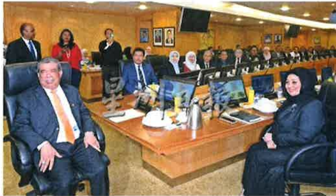
末沙布（左）表示该部优先关注食物供应与价格，尤其鸡蛋价格。

（布城5日讯）农业及粮食安全部长莫哈末沙布说，该部的优先事项是食物供应及食品价格，尤其是鸡蛋价格。