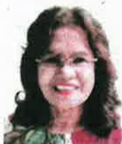
Felo Laboratori Kajian Dasar Pertanian dan Makanan, Universiti Putra Malaysia (UPM)

• Kerajaan dan GLC tidak boleh jadi 'orang tengah', manakala ahli politik usah kawal Pertubuhan Peladang Kawasan, sebaliknya serah tanggungjawab kepada golongan petani sendiri