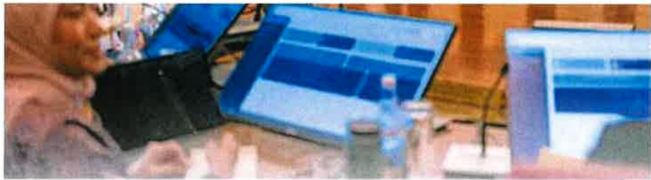
首相拿督斯里安华（左五）在组织团结政府后，周一在首相署主持第一次的特别内阁会议。其右为副首相阿末扎希，其左为副首相法迪拉。左起莫哈末哈山、拉菲兹和陆兆福，右起为莫纳兹末，沙拉胡丁，都立谦，亚历山大，倪可敏和莫哈末沙布。