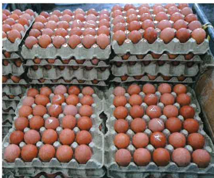
安华指明天公布鸡蛋新价格。（档案照）