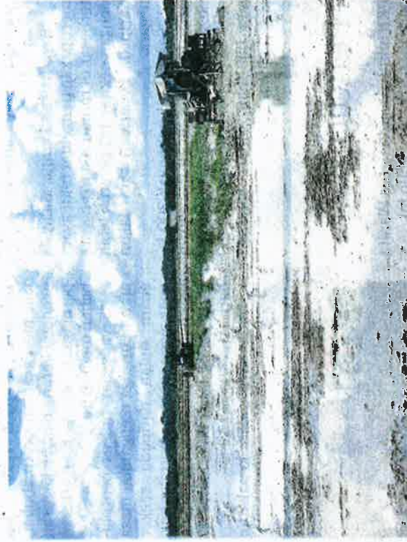
PESAWAH di Rompin menanggung kerugian selain terpaksa berhutang selepas tiga musim sawah padi mereka tidak menjadi.

Katanya, selepas tiga musim sawah tidak menjadi dia terpaksa menanggung kerugian se-terusnya terpaksa berhutang un-