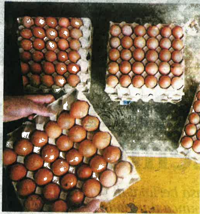
KOS makanan ayam yang tinggi menyebabkan pengeluaran telur ayam terhad.

"Kos makanan ayam meliputi 75 peratus daripada jumlah kos pengeluaran, jika kita boleh menghasilkan sendiri makanan ayam kita