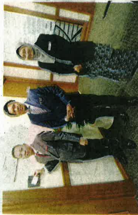
FOONG HIN (kiri) ketika hadir sesi clock-in di Wisma Tani, Putrajaya semalam.

PUTRAJAYA - Timbalan Menteri Pertanian dan Keterjaminan Makanan, Chan Foong Hin berhasrat untuk memajukan sektor pertanian di Sabah dan Sarawak, sekali gus menyumbang kepada keterjaminan makanan negara.