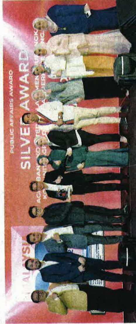
AGROBANK menerima tiga anugerah pada Anugerah Perhubungan Awam Malaysia 2022, Jumaat lalu.

Mengulas kejayaan itu, Presiden/Ketua Pegawai Eksekutif