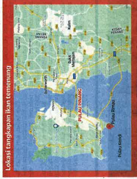
Lokasi tangkapan ikan temenung

gu sehingga pukul 4 petang dan akan membawa pulang hasil laut sehingga satu tan.