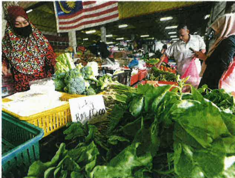
A vegetable stall at the Taman Tun Sardon market in George Town.

"Similar issues are happening with other livestock. I know breeders of milk-producing goats who have sold their livestock as meat,"