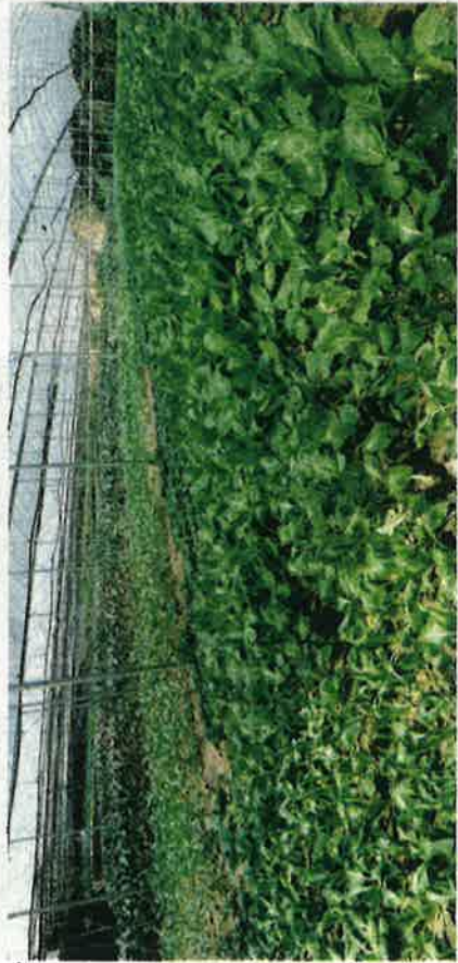
HASIL tanaman sayur di Cameron Highlands berkurangan ketika musim tengkujuh menyebabkan harganya melambung di pasaran. - GAMBAR HIASAN