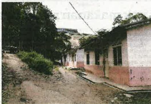
KAWASAN penduduk Orang Asli di Kampung Jedip, Gua Musang yang terfetak berhampiran kawasan pertanian di Lojing.

"Kalau boleh kami mahu pekebun mengurangkan aktiviti kerja