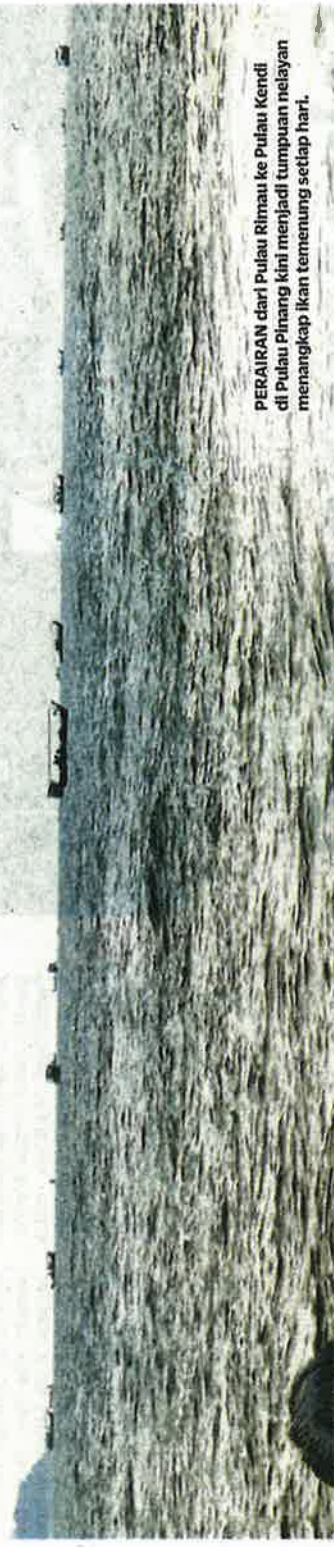
PERAIRAN dari Pulau Rimau ke Pulau Kendi di Pulau Pinang kini menjadi tumpuan nelayan menangkap ikan temenung setiap hari.

Menurutnya, nelayan dari Kedah dan Perak sanggup memung-