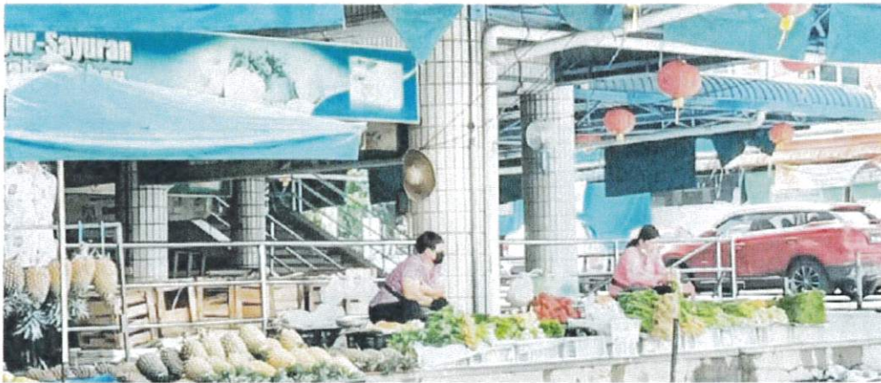
NIAGA: Penjaja sayur-sayuran di Pasar Sungai Maong Batu 3, Kuching.