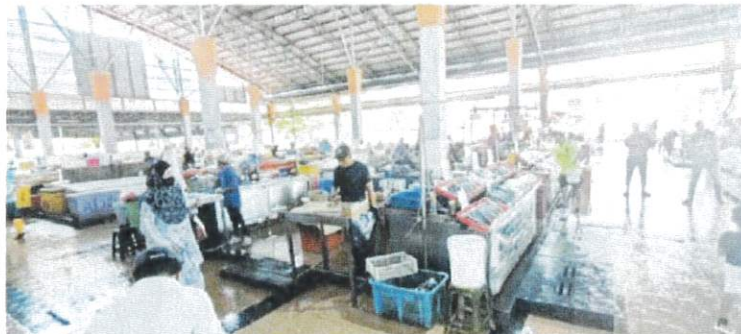
MAKANAN LAUT: Keadaan pasar ikan di Medan Niaga Satok semalam.