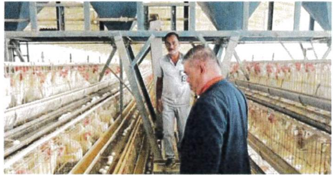
末沙布到8小时车程的纳马卡尔鸡蛋农场参观,确保入口大马的鸡蛋是干净与安全的。

末沙布对此解释说,在发现鸡蛋安全、干净并为人们所接受后,这些鸡蛋将通过海运的空调集装箱进口,确保鸡蛋的质量不会在运输途中下降。#