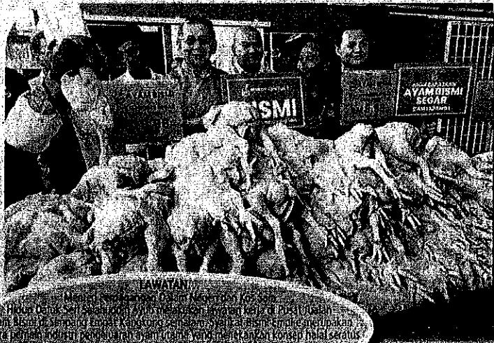
Hubungan antara ayam dan manusia. Ayam Bisi di pasar malam Alor Setar.

ling baharu itu nanti akan lebih murah berbanding harga siling semasa atau sebaliknya. Salahuddin