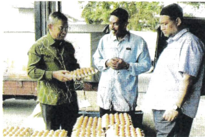
AZMAN (kiri) memeriksa bekalan telur ayam yang dibekalkan FAMA di Pusat Pengedaran FAMA, Chendering, Kuala Terengganu semalam.