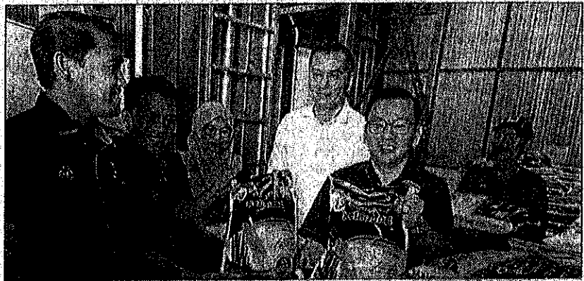
CHAN melawat kilang pembungkusan beras PPK Kalabakan sempena lawatan kerja itu.

"Kolaborasi strategik antara kementerian di peringkat Persekutuan dan Negeri perlu