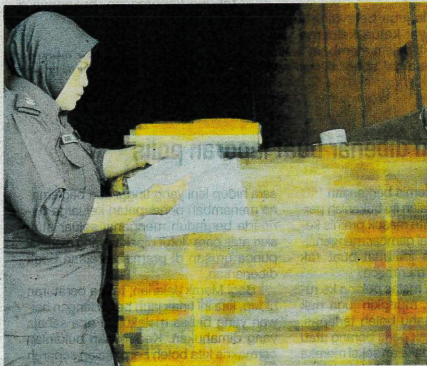
Pegawai Maqis memeriksa dokumen setelah menahan makanan haiwan di Kompleks Sultan Abu Bakar (KSAB) di Iskandar Puteri, Johor, pada Selasa.

Kes disiasat mengikut Seksyen 11(1) Akta Perkhidmatan Kuarantin dan Pemeriksaan Malaysia 2011 (Akta 728).