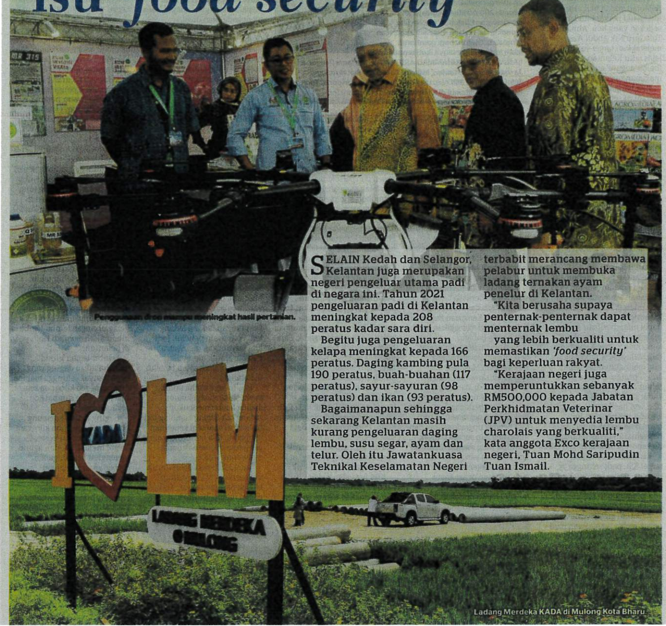
Penggunaan dron mampu meningkat hasil pertanian.

S ELAIN Kedah dan Selangor, Kelantan juga merupakan negeri pengeluar utama padi di negara ini. Tahun 2021 pengeluaran padi di Kelantan meningkat kepada 208 peratus kadar sara diri. Begitu juga pengeluaran kelapa meningkat kepada 166 peratus. Daging kambing pula 190 peratus, buah-buahan (117 peratus), sayur-sayuran (98 peratus) dan ikan (93 peratus). Bagaimanapun sehingga sekarang Kelantan masih kurang pengeluaran daging lembu, susu segar, ayam dan telur. Oleh itu Jawatankuasa Teknikal Keselamatan Negeri