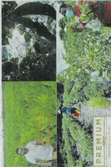
Sektor pertanian wajar diberi perhatian khusus agar produktiviti pengeluaran makanan dalam negara ditingkatkan.

"Jika dilihat bajet yang sebelum ini, golongan berkenaan tidak mendapat sebarang bantuan secara langsung kecuali dalam bentuk insentif potongan cukai." "Bagaimanapun, harus diingat bahawa tekanan turut dirasakan golongan ini berikutan kenaikan inflasi dan kos sara hidup," katanya lagi.