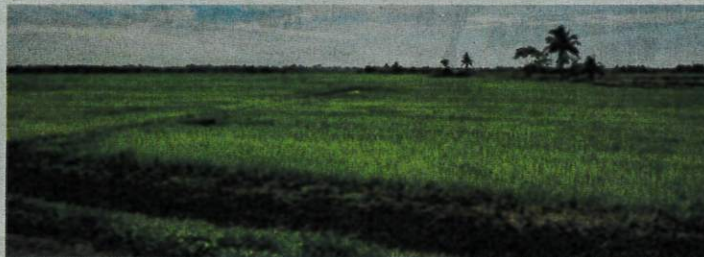
Ladang Merdeka di Jelor.

Sekarang proses pemilihan lembu-lembu yang sudah bunting. Sebanyak 30 ekor akan masukkan di situ tidak lama lagi. Dan dari segi perkiraan formula biasa akan melahirkan 30 ekor anak yang baharu. Sebahagian lembu jantan dan sebahagian betina induk kita akan simpan, manakala anak lembu jantan boleh dijadikan lembu pedaging bagi meningkatkan food security di Kelantan.