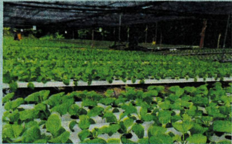
Rumah hijau projek tanaman sayuran secara hidroponik di Rong Chenok Tok Uban.

“Agensi itu juga me-laksanakan projek ter-nakan ayam daging dan tanaman rumput bagi