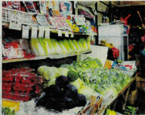
SAYUR-SAYURAN dan buah-buah segar yang dijual di sebuah premis di Cameron Highlands.

Menurut data Jabatan Pertanian Cameron Highlands, ke-