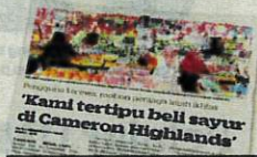
KERATAN Kosmo! semalam.

luas fizikal tanaman sayur-sayuran dan lain-lain di lokasi perangan tersebut berjumlah 6,052 hektar secara keseluruhan.