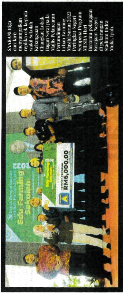
SAARANI (tiga dari kiri) menyampaikan replika cec kepada wakil sekolah kebangsaan Changkat Lohak Bagan Serai pada Majlis Pelancaran Pertandingan Urban Farming Masjid/Surau 2023 Peringkat Negeri sempena Program MESRA Hari Bertemu pelanggan kerajaan negeri di Stadium Indra Mutia, Ipoh.

Beliau berkata demikian ketika sidang media selepas menyempurnakan pelancaran Pertandingan Urban Farming Masjid/Surau 2023 serantau melalui penyampaian hadiah Pertandingan Edu Farming Sekolah 2022 peringkat