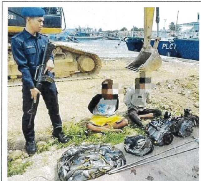
The two fish bombing suspects arrested in the operation.