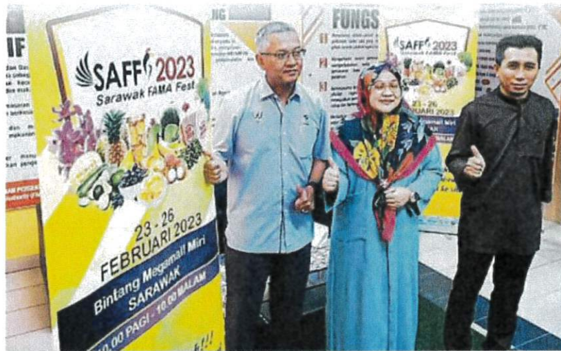
左起为联邦农业销售局砂分局副局长（行动）南里沙尼、副局长（发展）高蒂拉菲扎及发展部主管阿都阿兹召开新闻发布会。