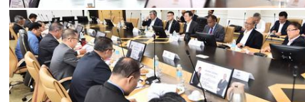
Taklimat berkaitan status terkini pelaksanaan projek penang south reclamation (PSR). YB Menteri KPKM dan Ketua Menteri Pulau Pinang, yang diadakan di Menara Lembaga Pertubuhan Peladang (LPP) Kuala Lumpur. 21 Mac 2023 | Menara LPP, Kuala Lumpur.