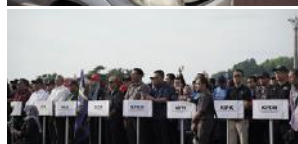
Majlis Pelepasan Pasukan Sukarelawan Penjawat Awam Pasca Banjir ke Johor telah disempurnakan oleh YAB Datuk Seri Anwar bin Ibrahim, Perdana Menteri Malaysia di Bulatan Putra Perdana, Putrajaya. 21 Mac 2023 | Bulatan Putra, Putrajaya.