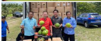
YB Tuan Chan Foong Hin, Timbalan Menteri Pertanian dan Keterjaminan Makanan telah mengadakan lawatan kerja ke Ibu Pejabat Lembaga Pemasaran Pertanian Persekutuan (FAMA) bagi mendapatkan maklumat dengan lebih lanjut berkaitan peranan FAMA dalam sektor pemasaran agromakanan negara. 21 Mac 2023 | Ibu Pejabat FAMA, Selangor.