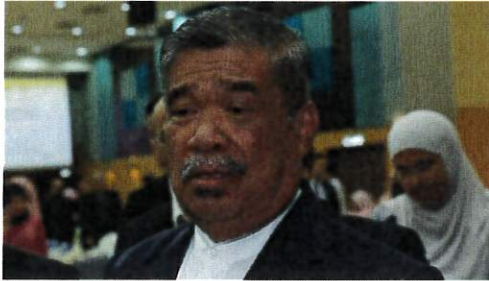
MOHAMAD Sabu.

Kuala Lumpur: Jabatan Perkhidmatan Veterinar (JPV) akan terus memantau kemasukan bekalan daging lembu import dari Brazil ke negara ini susulan laporan kes penyakit lembu gila di kesan di negara berkenaan.