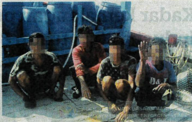
BOT beserta kru warga asing ditahan di perairan Pulau Kendi, Pulau Pinang semalam.

Tambahnya, kedua-dua bot beserta kru ditahan bersama 550 kilogram hasil laut dan kemudiannya dibawa ke Jeti Limbungan Batu Maung serta jeti Pasukan Polis Marin (PPM) Batu Uban untuk tindakan lanjut.