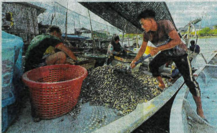
NELAYAN mengasingkan hasil tangkapan siput retak seribu yang mampu menjana pendapatan di sebalik hasil laut seperti ikan yang semakin berkurangan di Kuala Perlis semalam.

Dalam masa sama, mereka juga meminta kerajaan negeri campur tangan dan menjadi pengantara dengan Jabatan Perikanan agar ak-