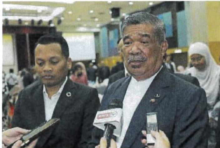
■莫哈末沙布（右）指兽医局监督从巴西进口的牛肉，左为聂纳兹米。

（吉隆坡7日讯）农业及食品安全部长拿督斯里莫哈末沙布指出，随著报导指巴西出现疯牛症病例后，兽医局继续监督从巴西进口的牛肉。他说，并非所有地方都爆发疯牛症。然而，兽医局监督从该国输入我国市场