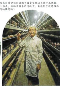
▲ 養鴨場在行動管制令下下的重型機械不能停止供電，所以在售價上不去，移路不來的情況下，蛋農於上述連續的困境。