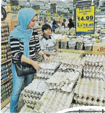
▲政府去年12月引进印度鸡蛋，以应付国内鸡蛋短缺的问题。（杨景照）