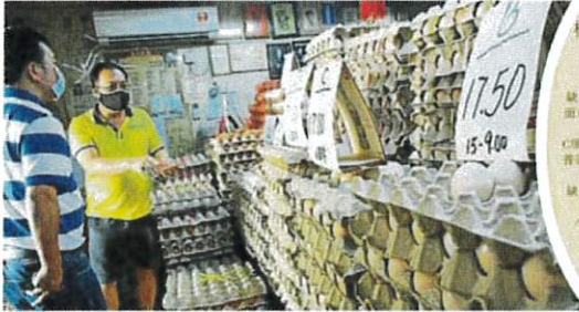
相比几个月前出现的鸡蛋短缺情况，如今市场已经逐渐回稳，足够供应市场。（杨景照）

他说，去年蛋荒问题是非非常明显，但是他并不认为今年会重演类似情况，不需要担心买不到。