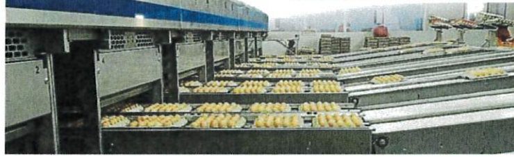
▲ 雪隆養禽畜協會在會議中，選派大會中呼政府停止對蛋價，務求解決困境。在起為李志豪、蔡德成、羅錦榮、何炳強、陳進堂、林德輝、曾永和、林樹成及何炳強。(何炳強提供) ▲ 蛋場場的生产機已機械化，為蛋農帶來巨大的經濟壓力。(何炳強提供)