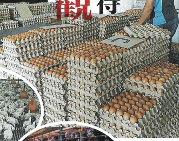
▲鸡蛋减少对影响产蛋量，但因此鸡蛋货源减少一些，但市面上的鸡蛋仍然处于正常水平。