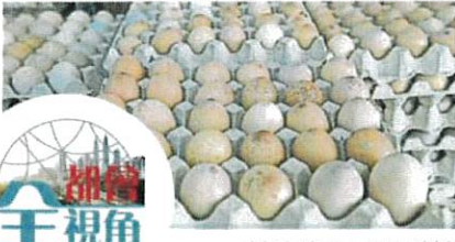
鸡蛋是生活食品之一，因此人们对鸡蛋的需求非常高。（杨景照）