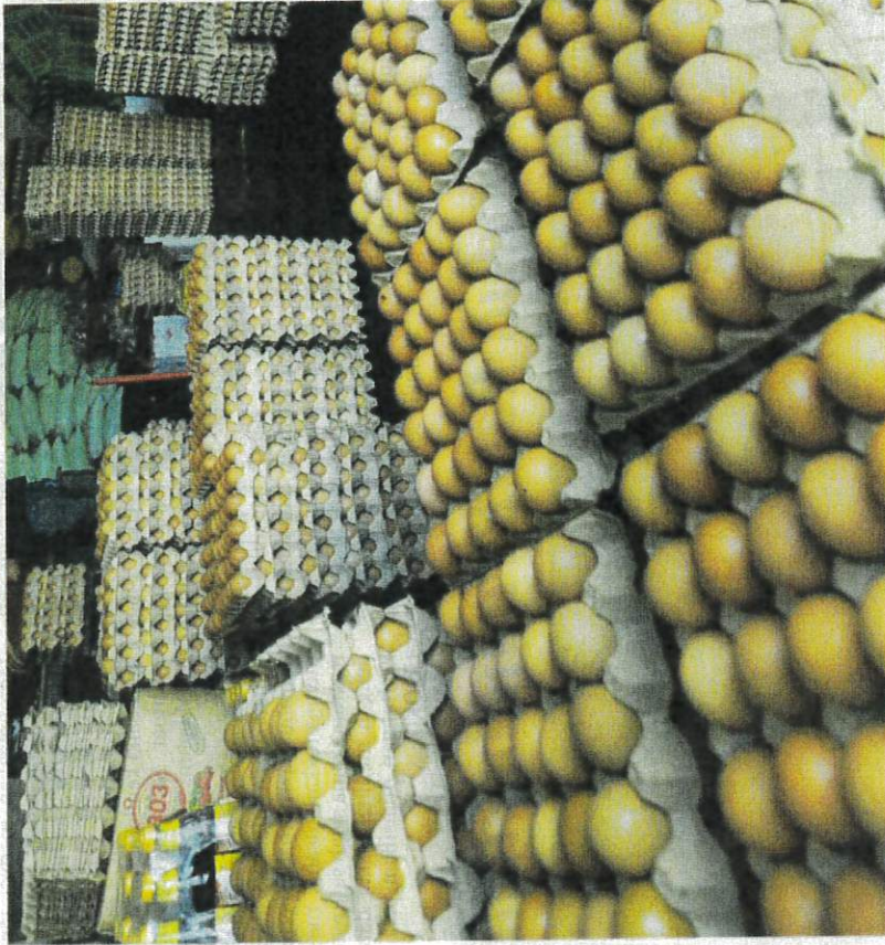
PERBELANJAAN dan risiko mengimport telur ayam ditanggung sepenuhnya oleh syarikat pengimport.

"Sejak Oktober hingga Disember 2022 menunjukkan unjuran kurangnya bekalan telur ayam iaitu -118,272,070 (Oktober), -157,543,291 (November) dan -1,282,094 (Disember), namun pada Januari 2023 unjuran menunjukkan