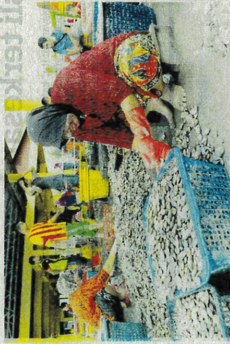
SIPUT retak seribu yang ditangkap diasingkan untuk dijual di pasar-pasar.