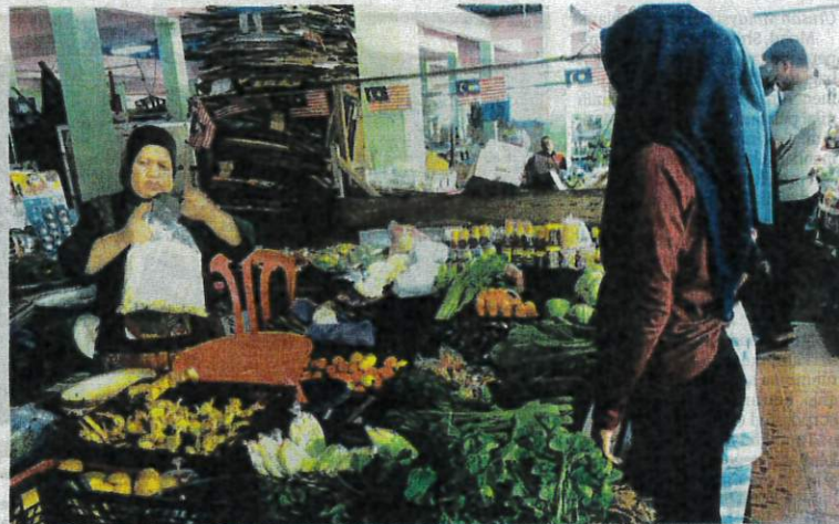
ORANG ramai mendapatkan bekalan sayur-sayuran di Pasar Ketereh, Kota Bharu, Kelantan semalam.

Katanya, sebelum ini sawi dijual pada RM12 dan telah turun kepada RM5 sekilogram.