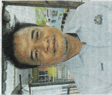
Zahari says an official request will be sent to the state government for the land to be formally gazetted.

"The Malaysian Armed Forces have sent food aid too, via helicopter to two Orang Asli villages in Punan and Peta that were cut off due to the recent floods," he added.