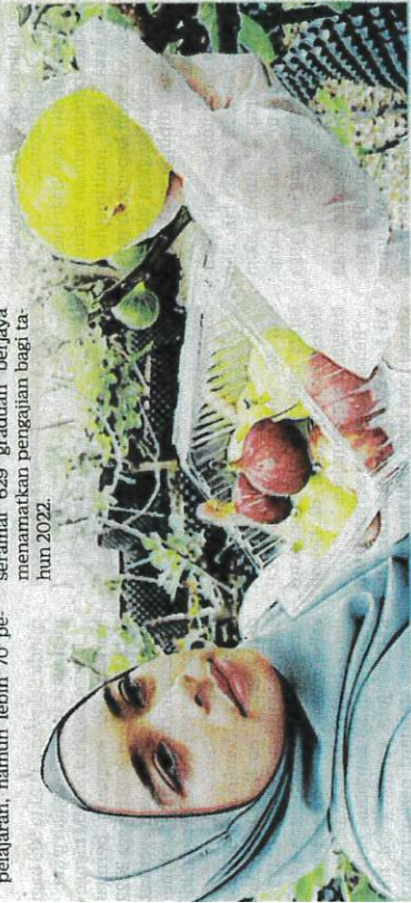
GRADUAN bidang pertanian mendapat permintaan tinggi di pasaran kerja. — GAMBAR HIASAN (KOLEKSI HARIAN)

Selain itu, ia turut memperuntukkan sumber kewangan mencukupi bagi pembangunan infrastruktur dan kemudahan bagi pelaksanaan program latihan yang dirancang," ujarnya.